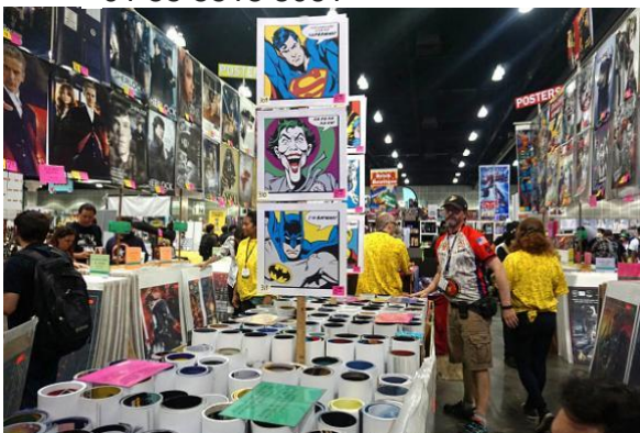
Eje Central Lázaro Cárdenas 9, Cuauhtémoc, Centro, 06000 Ciudad de México, D.F. 01 55 5518 8061