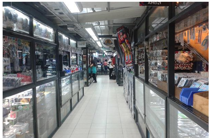
Bazar del Entretenimiento y el Video