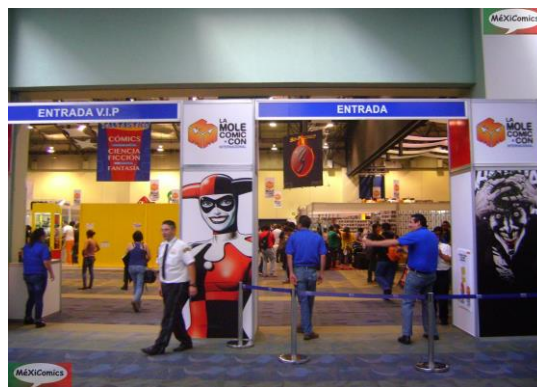
La Mole Comic con Montecito 38, Nápoles, Benito Juárez, 03810 Ciudad de México, D.F. 01 55 9000 6000