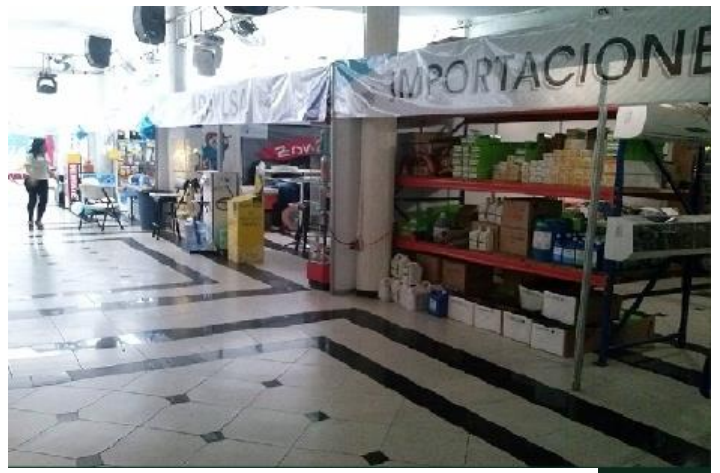
Centro de Convenciones Tlatelolco Eje 2 Norte (Manuel González) #171, Cuauhtémoc, San Simón Tolnahuac, 06920 Ciudad de México, D.F. 01 55 5782 3762