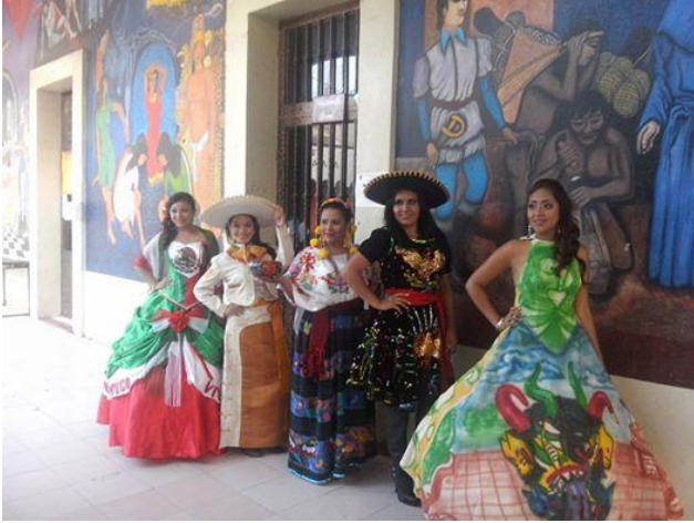
Candidatas para Reina de Los Diablos