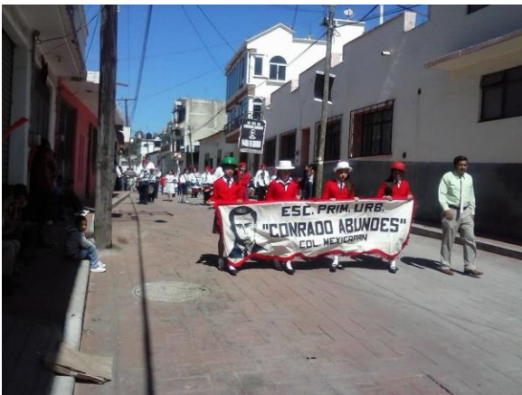
Desfile del 16 de septiembre