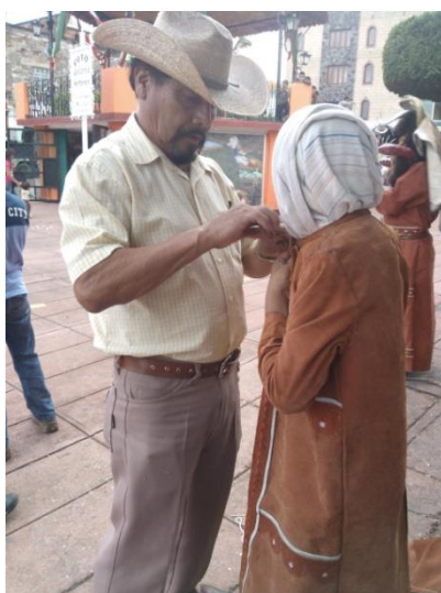
Teloloapan, Gro. 2013