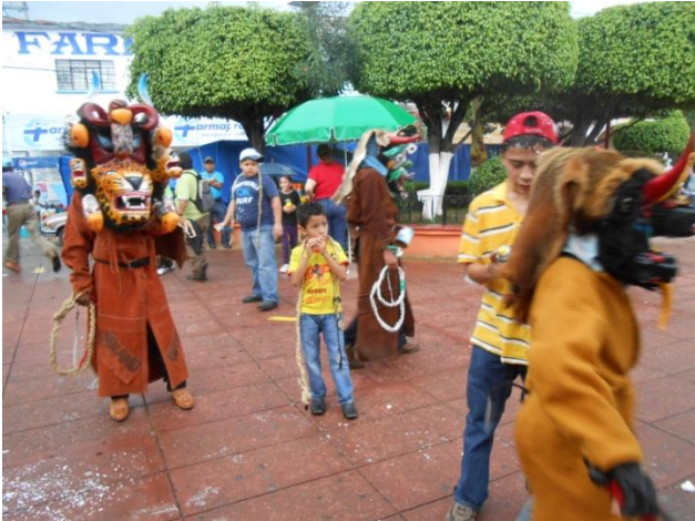
en Teloloapan, Gro. Septiembre 2013

A partir de ese momento como muestra de gratitud se empezaron a disfrazar de diablos y poco a poco se fue haciendo tradición, a tal punto que ahora se conmemora cada año esta gran hazaña de mi pueblo. (Ángel; entrevistado 2013)