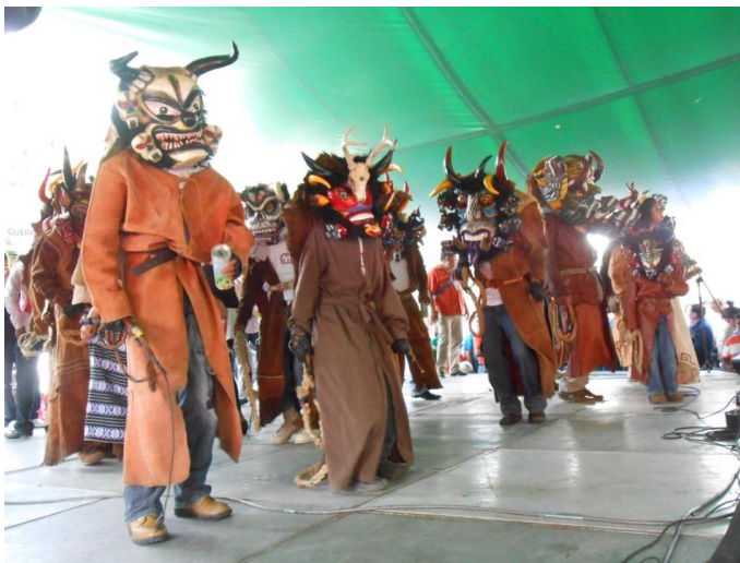
D.F. México 2013.

Como podemos darnos cuenta, se exigen hasta cierto punto, reglas rigurosas a cumplir pero que a la vez sirven para que “Los Diablos Tecampaneros” salgan bien vestidos, derrochen arrogancia y personalidad y, así el evento, lejos de sufrir degeneración alguna, al contrario se proyecte hacia mejores realizaciones. (Nájera Castejón; 1995: 29-30).