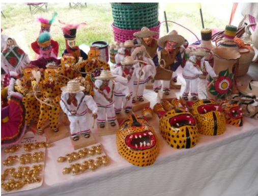
“Área de Artesanías” D, F. México. 2013

Las fotografías muestran artesanías de diferentes bailes que se realizan en Teloloapan y se expone en la feria de Iztapalapa, empero no hay nada de Los Diablos.