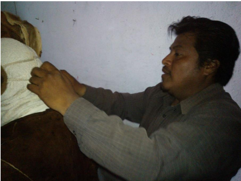
Teloloapan, Gro. 2013.

Esta serie de fotos muestra el proceso de vestimenta para convertirse en diablo.