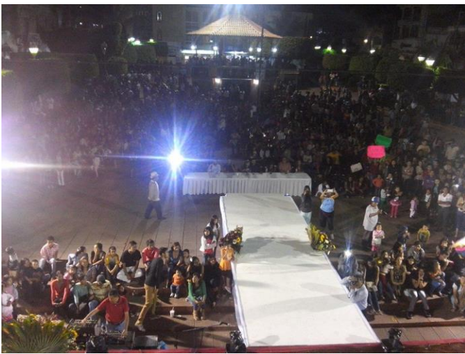
Pasarela para seleccionar a la Reina