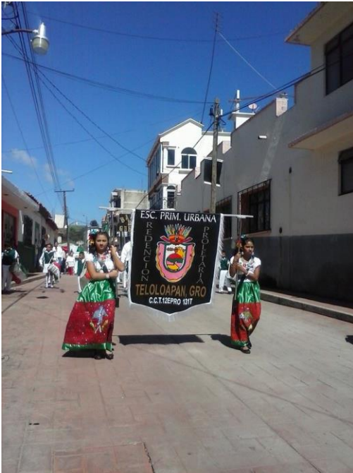
Desfile del 16 de septiembre