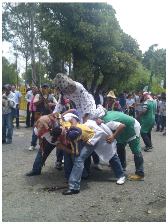
La danza de los tecuanes. Fotografías tomadas por Monserrat Sánchez. D,F. 2014