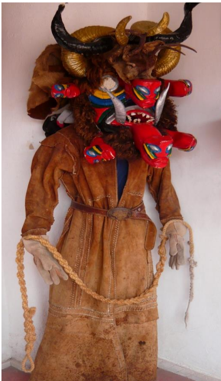
Foto tomada por Monserrat Sánchez en el Museo de sitio en Teloloapan, Gro. 2013

Después de celebrar en la plaza de Teloloapan, los diablos regalaron sus máscaras a los jóvenes del pueblo, quienes cada año recordaron el acontecimiento el día del inicio del movimiento de Independencia.” ( http://www.mexicodesconocido.com.mx )