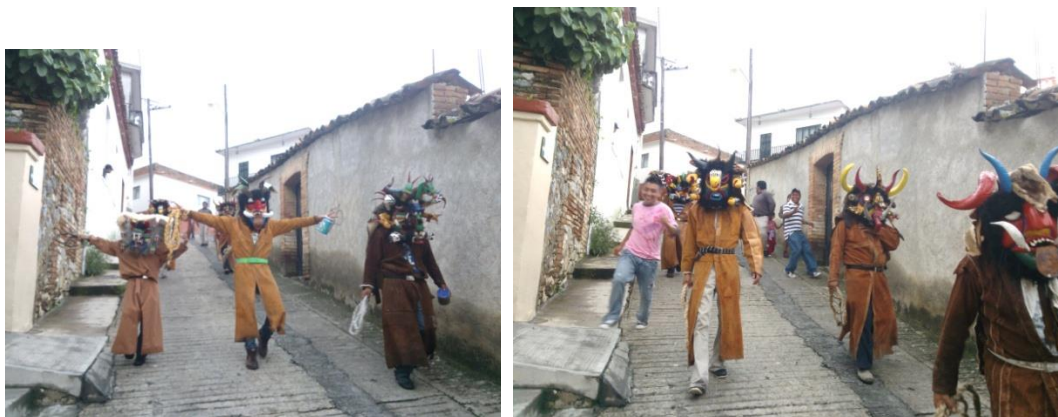
“El recorrido de Los Diablos, por la colonias de Teloloapan.” Fotografías tomadas por Monserrat Sánchez, Teloloapan, Gro. 2013

salen, la mayoría de los jóvenes entre 15 a 20 años los acompañan por el recorrido que son solo unas colonias alrededor de Teloloapan, sin llegar a Mexicapan.