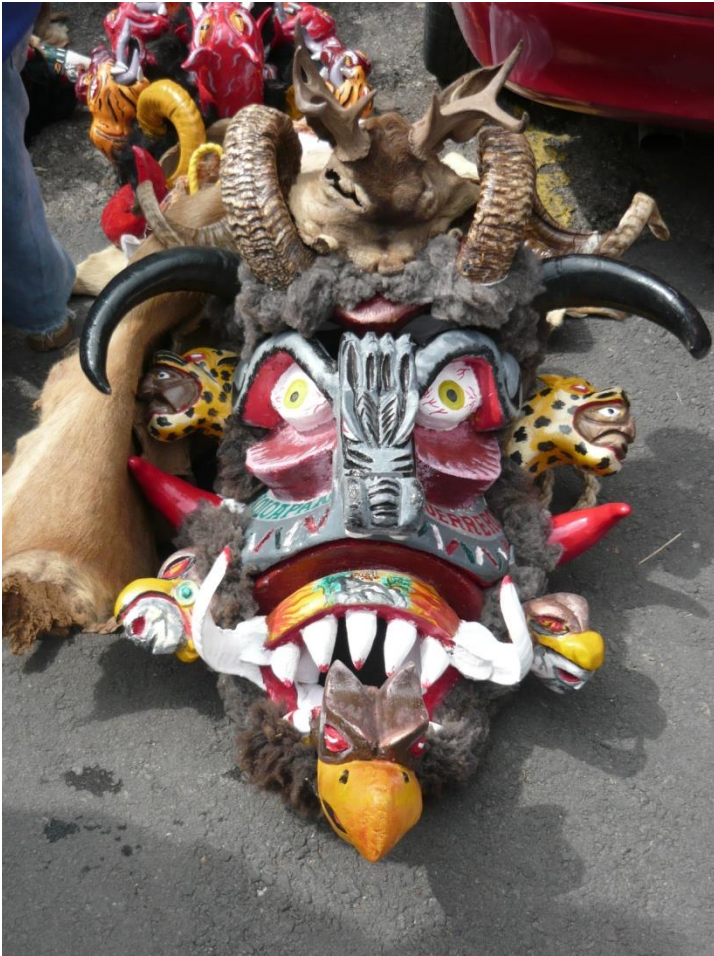
Fotografía tomada por Manuel Talavera. D, F. 2010