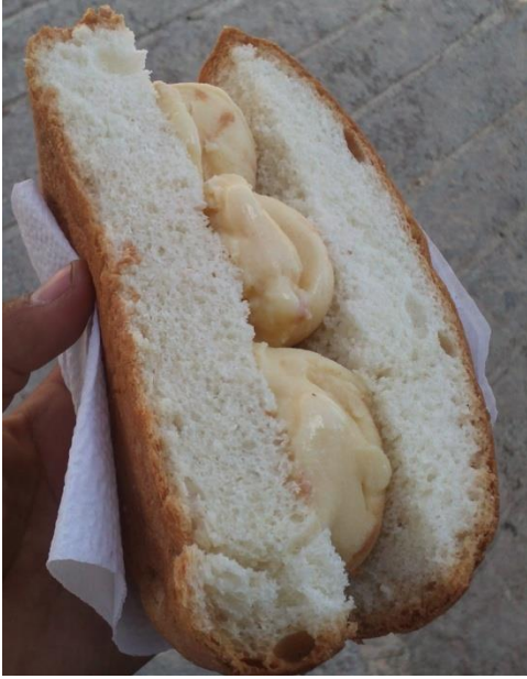
“Pan de baqueta con nieve” Fotografía tomada por Ángel Cleto. 2013.

Las personas que van a estar en la parte de la vendimia llegan al deportivo desde muy temprano, aproximadamente desde las 8:00am, y a partir de esa hora empieza la comida, birria, consomé, tamales, atoles, helados, mezcal, pepitas, pan y no podría faltar el refresco yoli , muy típico de Teloloapan y del Estado, estos son los alimentos que más predominan en este día. Los visitantes que acuden regularmente son familiares de Teloloapan, saben que para poder tener un buen desayuno, se llega temprano.