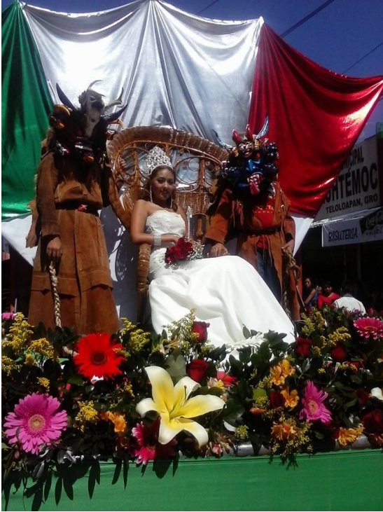
Desfile del 16 de septiembre