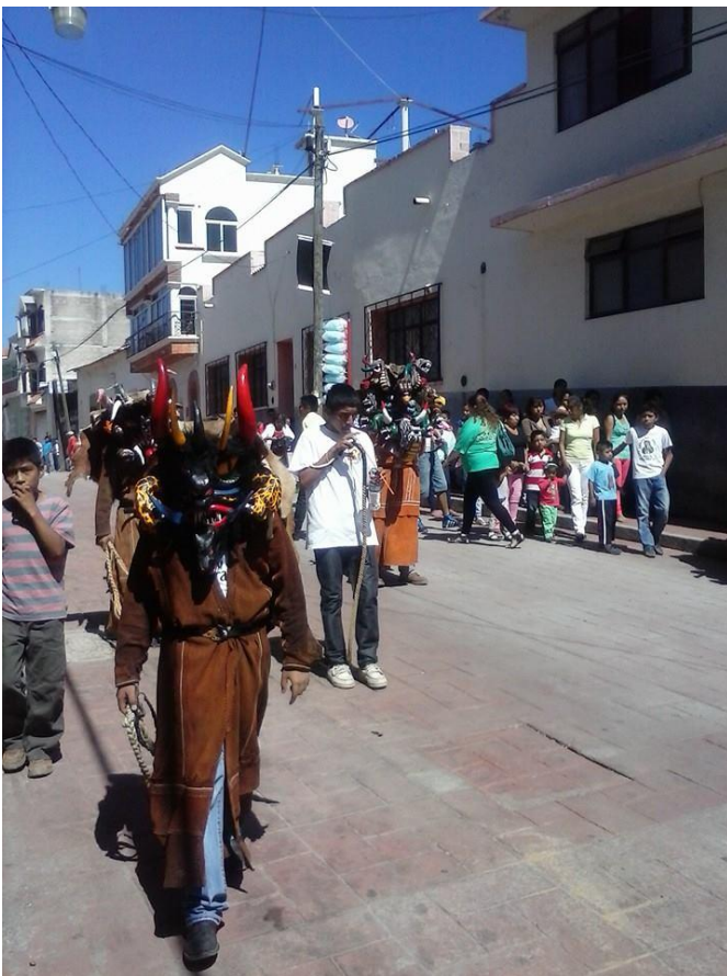
Desfile del 16 de septiembre