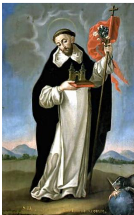
Museo Nacional de Bellas Artes. Santiago, Chile. Óleo sobre tela. Dimensiones 0.73 x 0.46m. Año 1817. Autor Gil de Castro, José.

Su hábito se compone de una amplia túnica ceñida por una correa de la que pende un rosario, un escapulario (tira de tela que se mete por la cabeza para cubrir pecho y espalda) que cae hasta los tobillos, esclavina (capa pequeña que cae a la altura de los hombros) con amplio capillo o capucha, todo esto de color blanco, y para salir, una amplia capa con esclavina de color negro. “La tradición dominica cuenta que el hábito fue inspirado por la Virgen María a uno de los frailes; en cuanto a los colores, el blanco recuerda la castidad de los frailes y el negro su vida de penitencia”. (Arroyo; 1964; 15 – 23)