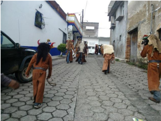
“De visita al panteón” Teloloapan, Gro. 2013

En el año 2014 no se realizó el tradicional recorrido de una semana, las condiciones de inseguridad no permitieron que se realizara. Así que sólo salieron el mismo 15 para su recorrido y la celebración del grito. Este mismo día se realizó el concurso para elegir a la reina de los diablos .