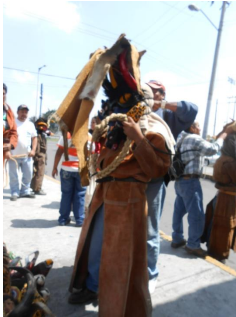
“Preparativos para la caminata sobre la avenida Telecomunicaciones” Fotografías tomadas por Monserrat Sánchez. 2013.

Estando ya todos vestidos y listos, empieza el recorrido, que es muy similar al que se realiza en Teloloapan, salen desde la calzada Zaragoza y siguen su camino sobre la avenida Telecomunicaciones así conocida y actualmente con el nombre de Azcárraga Vidaurreta que son unas cuadras para llegar al deportivo Francisco I. Madero en la delegación Iztapalapa, en ese mismo recorrido los acompañan con música de banda, y otras fiestas, por ejemplo en el año 2010 sus acompañantes fueron la danza de los viejitos y unos charros; este año los acompañó la danza del Tecuán.