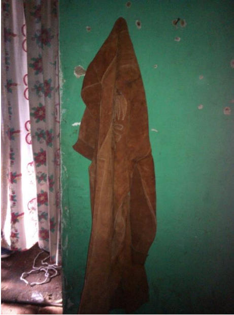
“La cuera”, utilizada por los diablos. en Teloloapan, Gro. 2013.

En esta foto se muestra a una cuera, hecha por piel de diversos animales, como borrego, vaca, venado, toro, etc., la cuidan mucho porque es muy costosa para comprarla y más complicada para realizarse. Por esta razón es que son muy escasas, no hay demasiados fondos para comprarlas, se las van turnando por días o por momentos, regularmente cuando llueve no salen porque se mojan y producen un olor de putrefacción, hasta que se logra secar.