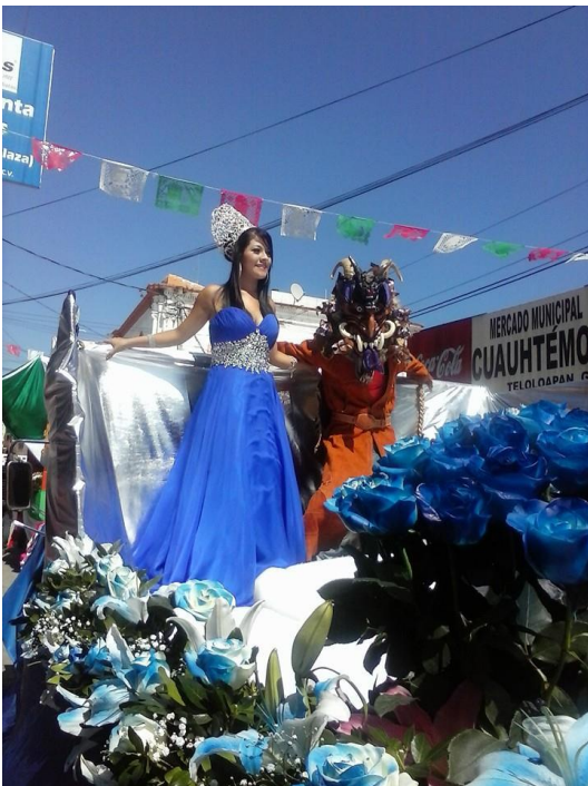
Desfile del 16 de septiembre