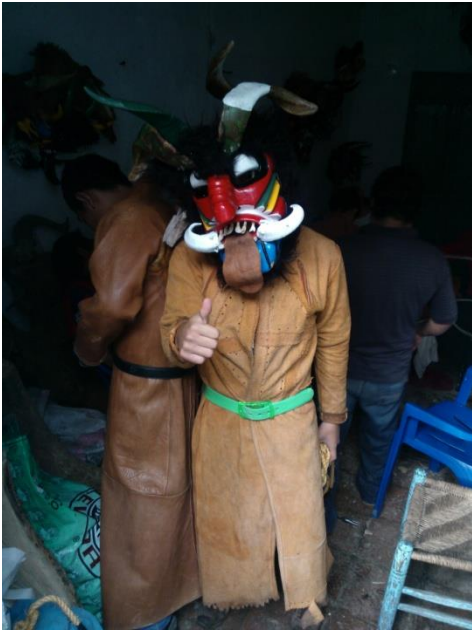
El diablo listo.