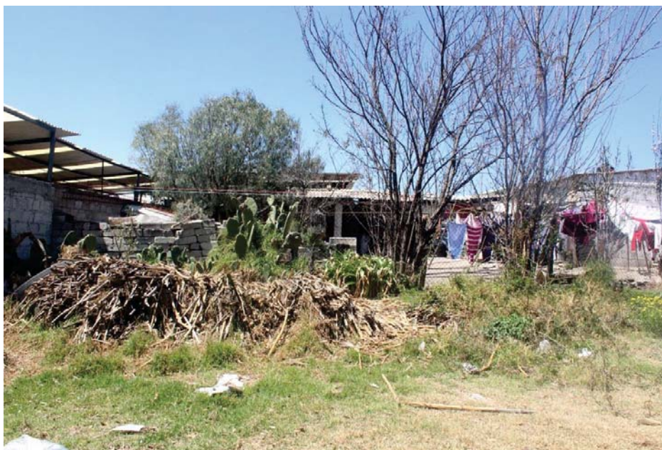
Patio de Antonio, donde se refleja las carencias que se tienen en el pueblo.