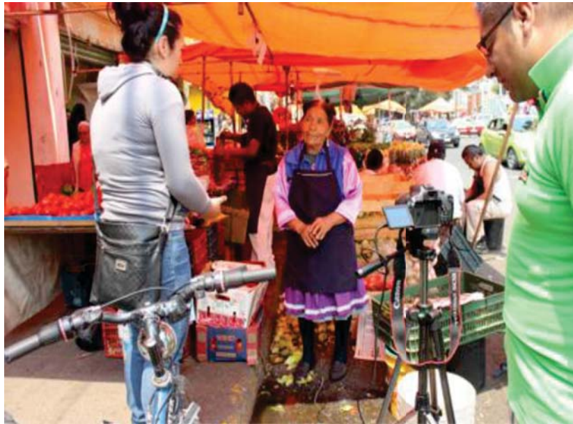
Momento de la grabación.