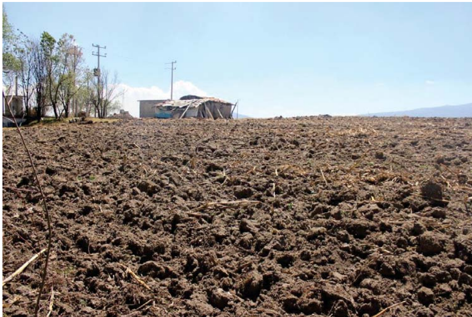
Vivienda de los vecinos más cercanos a la casa de Antonio.