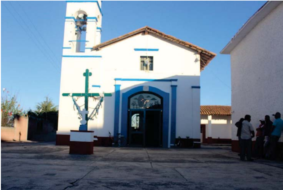
Iglesia de la comunidad mazahua Guadalupe Cachi, Ixtlahuaca. Edo. de México