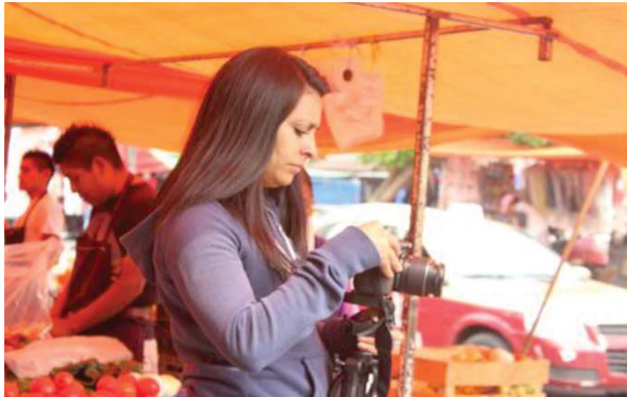
Ángeles colocando la cámara para captar detalles de nuestra entrevistada.