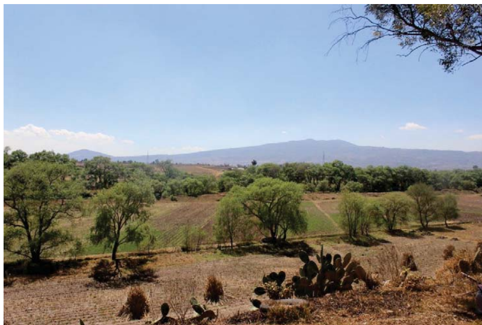
Vista de la comunidad San Pablo de los Remedios, Ixtlahuaca