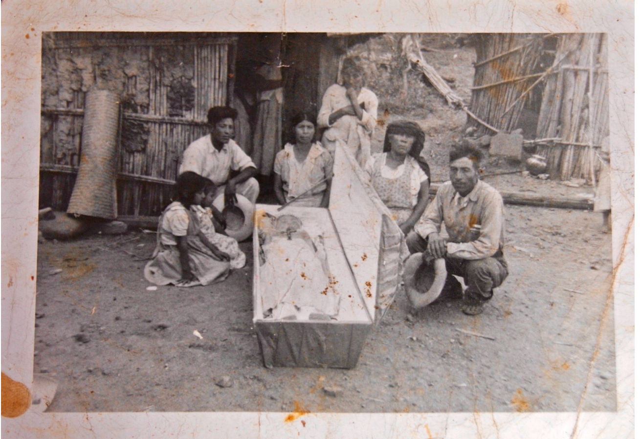
---La última foto de mi madre---