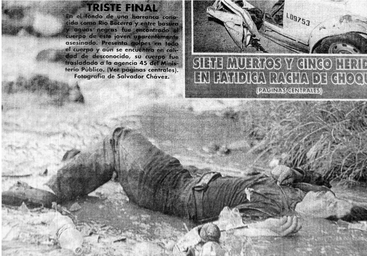
Triste Final 32