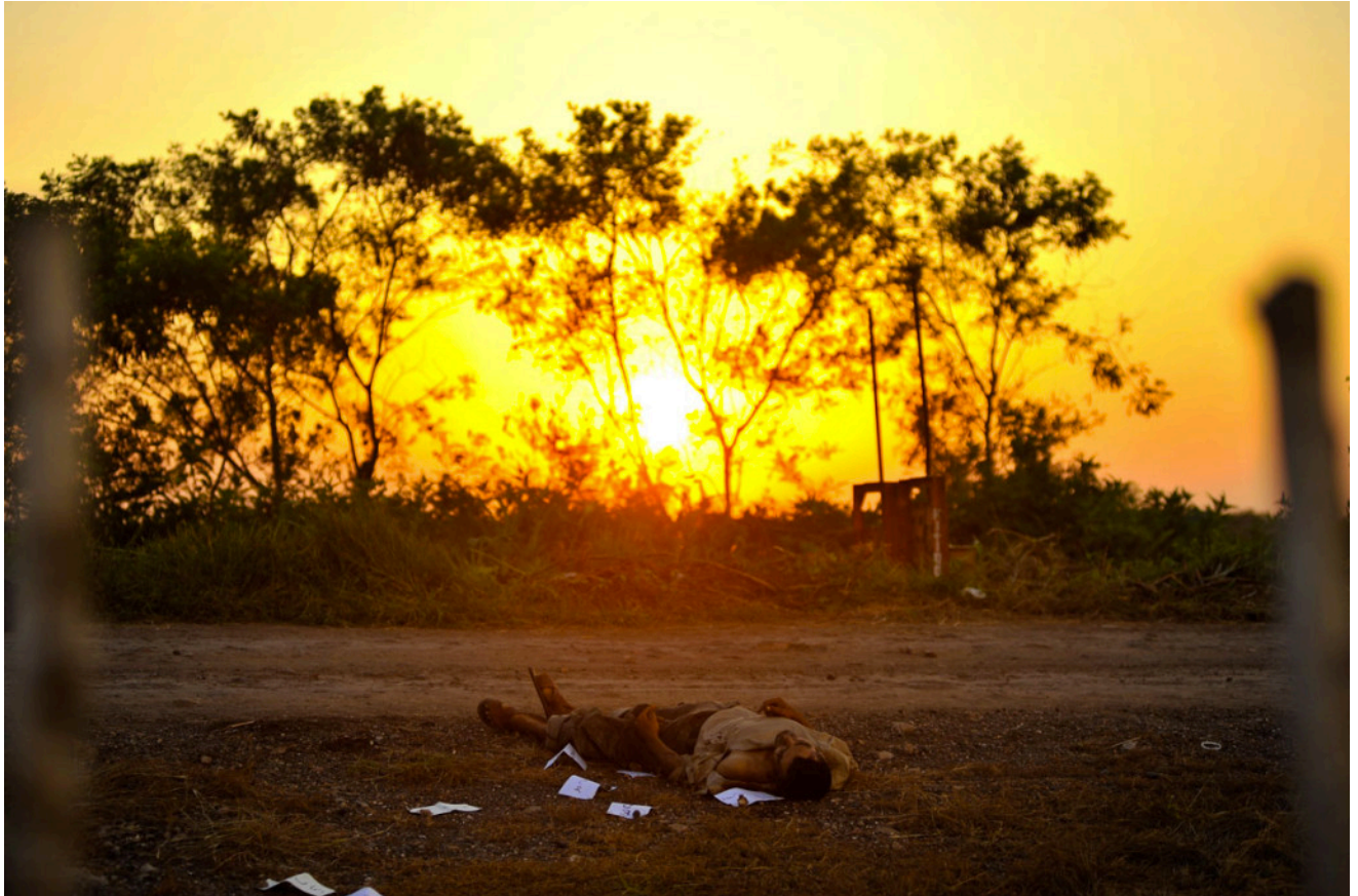
Fotografía perteneciente a la serie: "Tus pasos se perdieron en el paisaje" 25