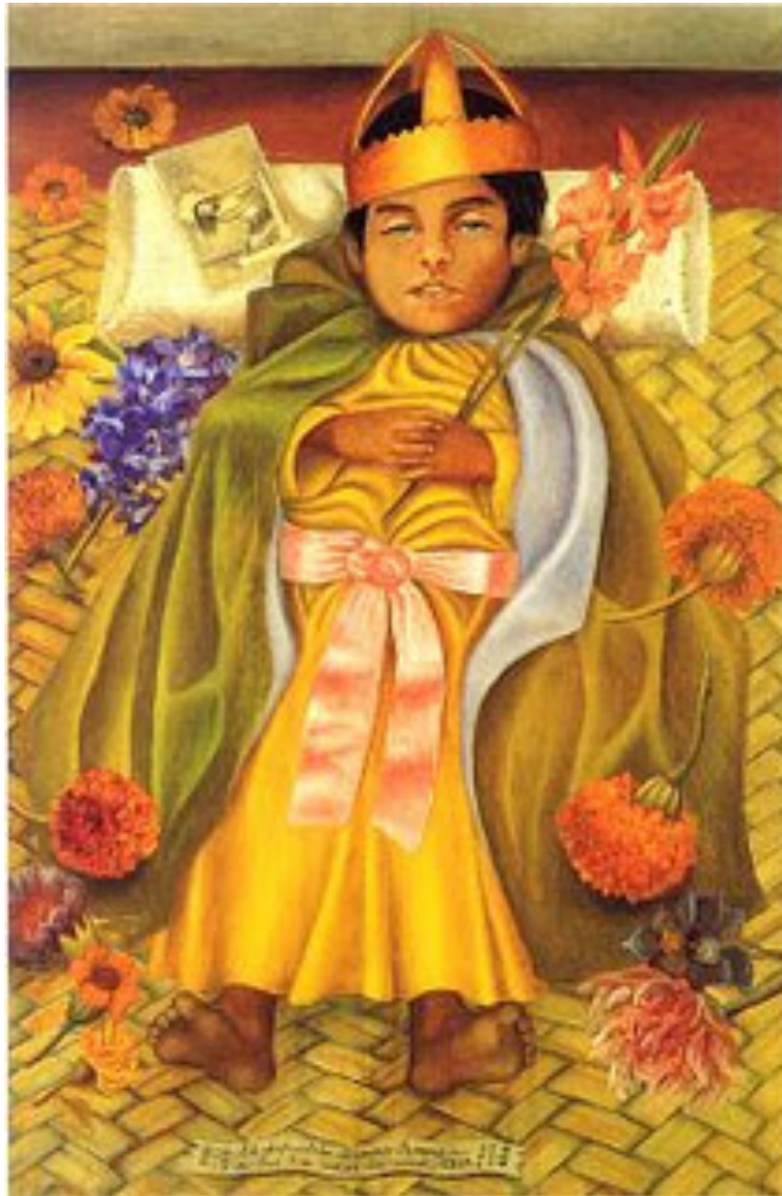
Frida Kahlo El difuntito Dimas, (1937) Óleo sobre masonite 48 x 31 cm