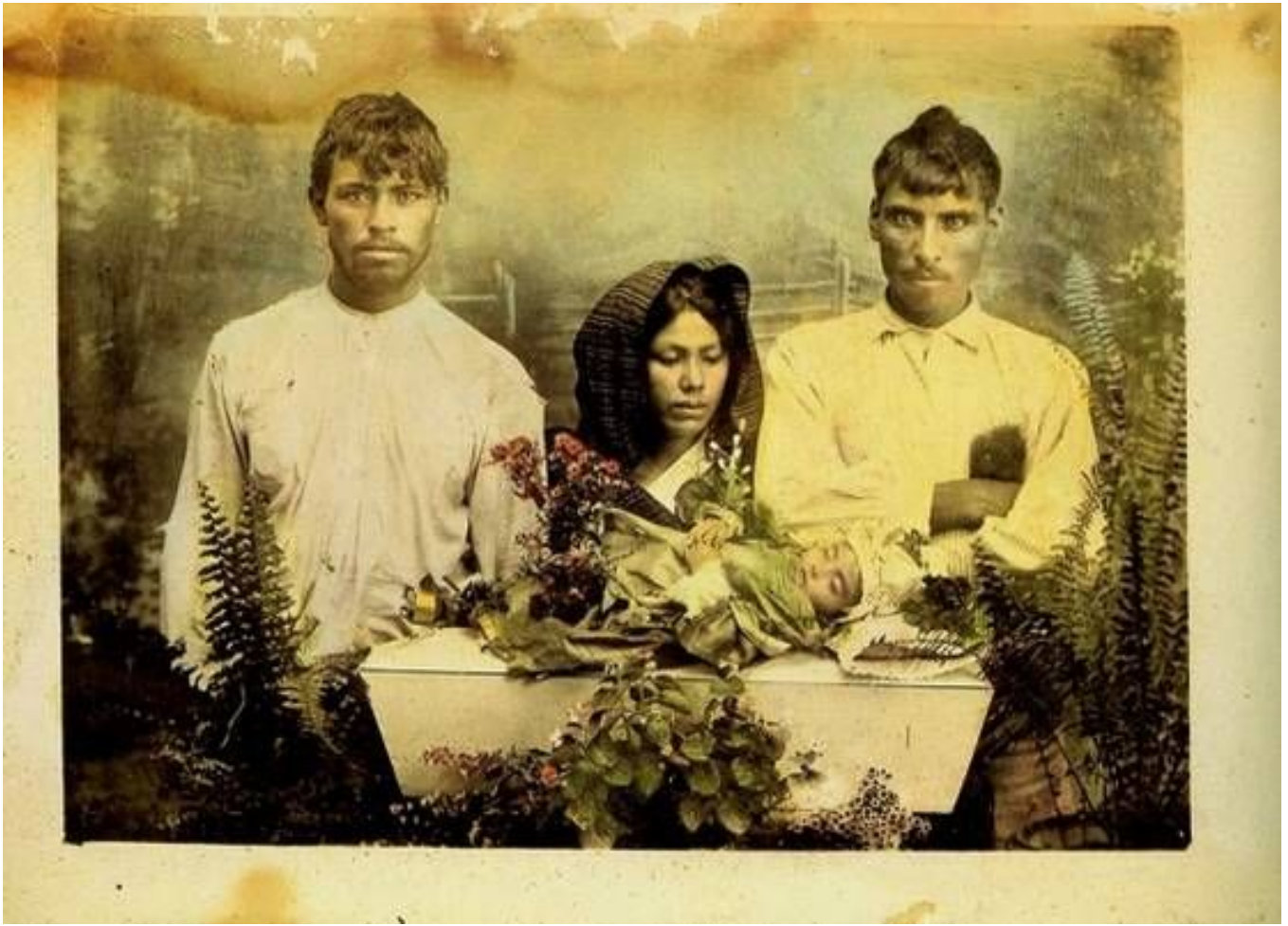
Juan de Dios Machain

Fines del siglo XIX y principios del XX.