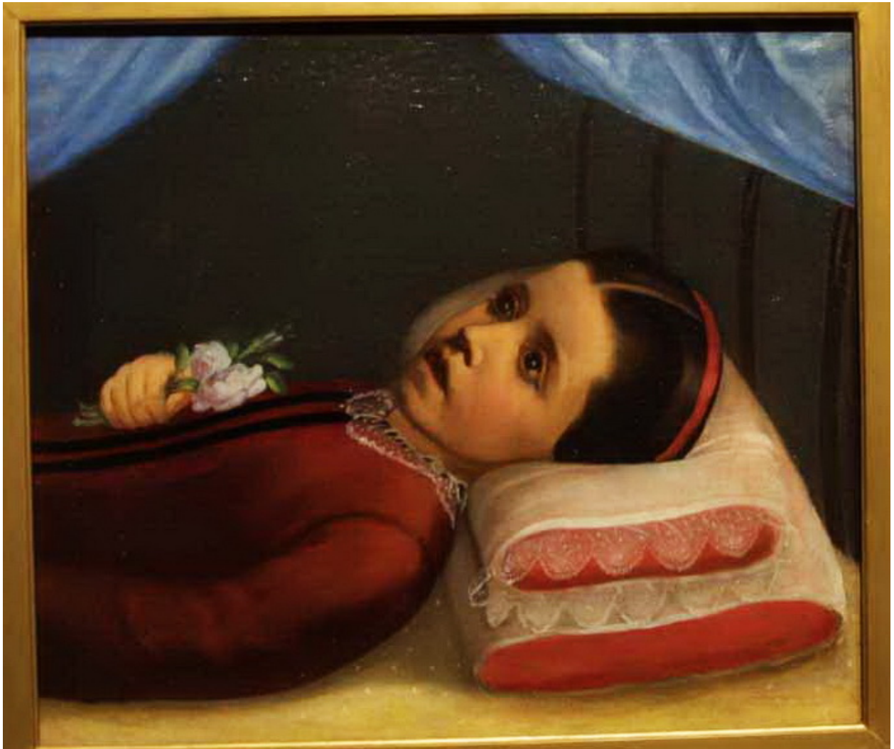
José María Estrada Retrato de niña muerta Fines del siglo XIX Oleo / tela 44.5x56 (Gutierre, 1992:39)