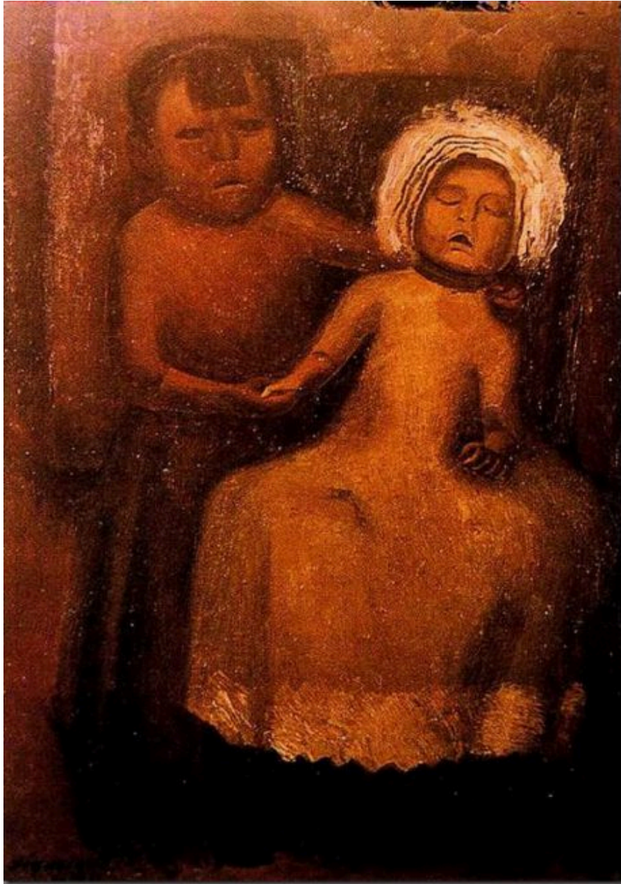
David Alfaro Siqueiros Niña viva y niña muerta , (1931) 9 100 x 75.5 cm