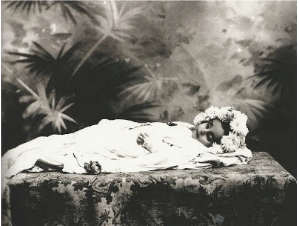
Romualdo García. Retratos. Finales del siglo XIX. Col. Fototeca Guanajuatense, Museo de la Alhondiga de Granaditas. INAH