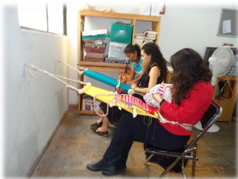
Clase de Telar de Cintura, instalaciones de Asamblea de Migrantes Indígenas de la Ciudad de México, 24 de mayo de 2014, Fotografía: Jessica Alavez Ruíz.

consiste en difundir la práctica y la valoración e importancia que ésta tiene y al mismo tiempo es un punto de encuentro entre diversas personas.