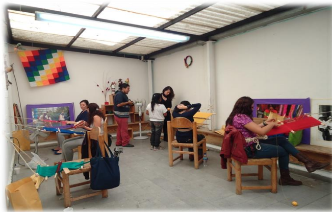
Taller de telar de Cintura, Espacio Comunitario Para todos, Todo, Instalaciones de la Asamblea de Migrantes Indígenas de la Ciudad de México, 7 de junio de 2014, Fotografía: Jessica Alavez Ruíz.

Actualmente, el Espacio Comunitario de la Asamblea de Migrantes Indígenas ha sido un punto de encuentro para la enseñanza de la práctica del telar de cintura. A los talleres asisten hombre y mujeres, siendo estas últimas mayorías. Gran parte de ellas con una formación académica y con un perfil en Ciencias y Humanidades, con una edad de entre los 23 años a los 40 años de edad. Además, un vínculo con procedencia indígena, mismos que se vieron en la necesidad de migrar a la ciudad. Es importante mencionar que el medio por el cual se enteraron de los talleres fue a través del Facebook de Zapaz Telar.