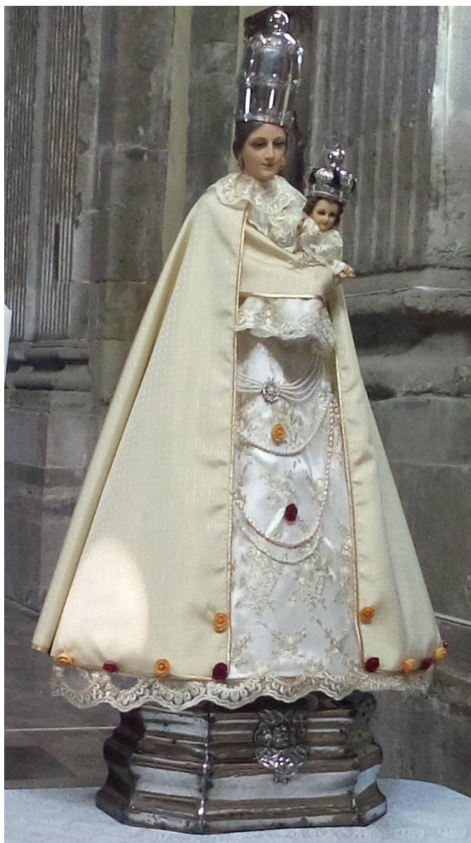
Réplica de la Virgen de Nuestra Señora de Loreto, traída desde Italia en 1675, ubicada actualmente en la iglesia con el mismo nombre con dirección esquina calle San Ildefonso y calle Loreto a un costado de la Universidad Obrera (antiguo Colegio de San Gregorio).

Desde 1578 los jesuitas, a través del Zodiaco Mariano plasmaron las tradiciones del culto a la Virgen María, introdujeron ciertas ideas de comportamiento, costumbres y valores para crear modelos y satisfacer las demandas religiosas. 77