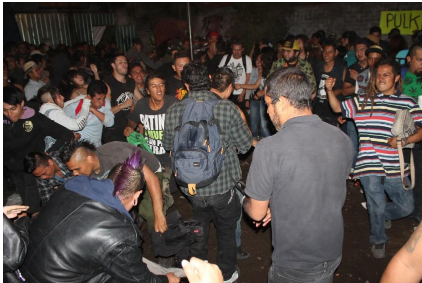
Slam en el Marranero Fest