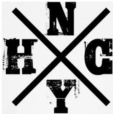
Imagen que muestra la apropiación del Straight edge con el hardcore de la ciudad (dhcarterblog, 2014).

En ese tipo de cuestiones siempre habrá diversas versiones sobre qué ciudad surgió el movimiento o quienes fueron los pioneros del estilo. Lo cierto es que el sonido de las bandas era una mezcla entre el Oi británico, el punk anarquista norteamericano y las bandas de Washington DC. En esta última ciudad también habían aparecido bandas de punk y hardcore , como Minor Threat y SS Descontrol , que promovían un estilo de vida libre de vicios (alcohol y tabaco) conocido con el nombre de Straight Edge . El hábito, que posteriormente se hizo común, de ponerse una “X” en la mano para ser identificado como Straight Edge , hizo que los neoyorquinos adoptaran rápidamente dicho símbolo agregando las letras NYHC a su alrededor.