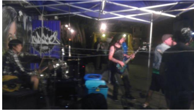
Skatofilia el día del evento

en la banqueta que está frente al escenario y otros cuantos vomitando a un costado del mismo, en ese momento el toquín ha quedado en segundo término, son muy pocos los que en unos cuantos sentidos aun le ponen atención a quienes siguen tocando.