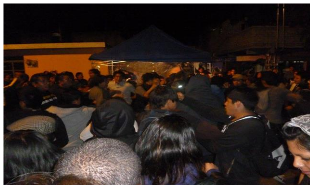
Vista desde la parte delantera del escenario. 30

El toquín terminó a las 3:00 AM, el objetivo se cumplió, una velada de mucho ruido, de mucho baile, la calle se comienza a vaciar, dejando el rastro de botellas, vasos, hasta de playeras tiradas en el suelo y uno que otro chavo al que se le pasaron los tragos, pero lo que quedará en el recuerdo es otro toquín más.