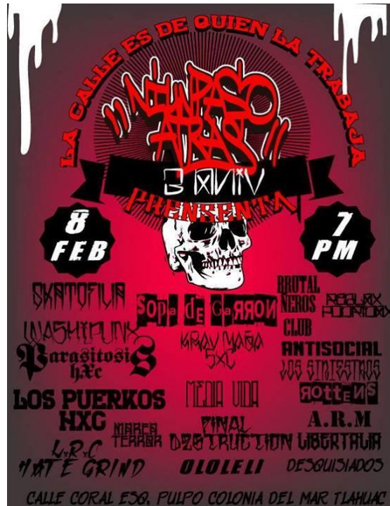
Propa del toquín

Tocada 1 Col. Del mar, Delegación Tláhuac.