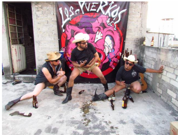
Los puerkos en la realización de uno de sus videos. 27

Hasta el día de hoy, Los Puerkos son una banda reconocida, principalmente en la zona de Iztapalapa y Tláhuac, de igual manera se han llevado la sorpresa de que en otras partes del país, como en Toluca y en Monterrey los conocen, gracias a los videoclips que tienen en la página Youtube. Actualmente el Tocino trabaja en la CFE y es diseñador freelance , Jorge además de ser baterista es comerciante y el Queso de puerco es elemento de un verificentro. Haciendo un breve análisis esta banda, lejos de tener la facha común del punk, la actitud es la que los ha caracterizado y la que les ha dado el sello en las zonas demográficas descritas líneas arriba, esto es un ejemplo de que no se necesita tener toda una indumentaria para expresar las inconformidades cotidianas a través de la música.