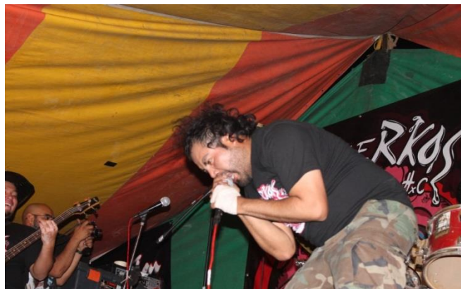
Los Puerkos en acción.

Aunado a ello, si bien había restricción en cuanto a que había una puerta para entrar y salir del lugar, no hubo una regulación para designar quién entraba o quién no, es decir, la entrada era libre y sin discriminaciones, por esa misma situación de que el lugar en modo simbólico era abierto, había personas afuera del terreno por lo que inundaron la Avenida San Antonio, pero no impedían el paso de los coches, rumores que se decían dentro del terreno era de que las patrullas al ver el mar de gente arriba y de bajo de las aceras optaban por darse la vuelta y no seguir por la Avenida, por lo que se vivía un aire de libertad y un toquin callejero como si se hubiera pagado por entrar, pero lo cierto es que el Marranero cada vez es más popular apto para hacer de él un evento de gran escala y hacer saber que la escena hardcore en Iztapalapa es mayor con el pasar de los años.