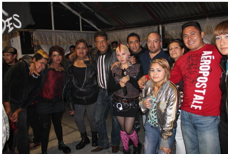
Integrantes de la banda de los Sex Panchitos 32