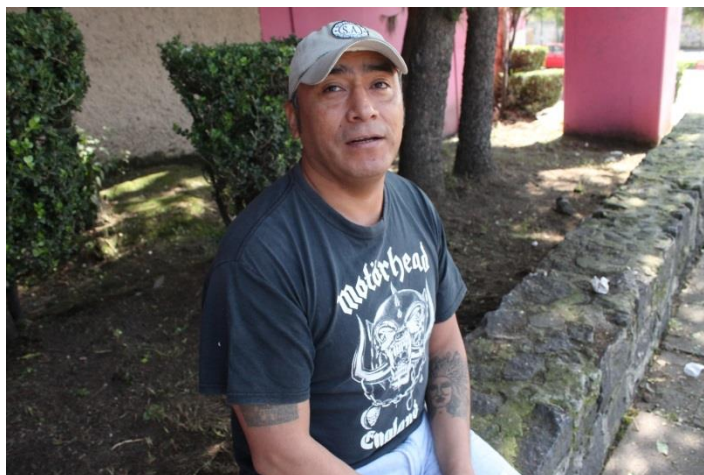
El Tatix 24