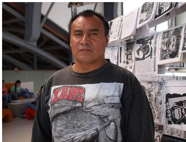
El Toluco 22

ochenta, es decir, ellos tenían la creencia que para todo mal institucional se debía de combatir desde sus entrañas, esto lo comento pues conozco a personas que son de la misma generación: rockeros , punks , jipitecas , incluso personas de clase media que creían lo mismo y terminaron enrolándose en alguna corporación, algunos son policías, otros cuantos burócratas y Álvaro Detor trabaja en el GDF, esta cuestión creo no es de criticar, pues considero es producto de una ideología bien planteada que se llevó a la praxis, cuestión que hoy en día es criticada ya que muchas personas actúan sin coherencia, por el contrario considero que puede verse como ejemplo de la creencia de intentar cambiar el orden desde las instituciones mismas, ya que es como dicen siempre y cuando tu dignidad y tu pensamiento no se pisotee, cada quien lucha desde su trinchera, aunque parezca difícil concebirlo.