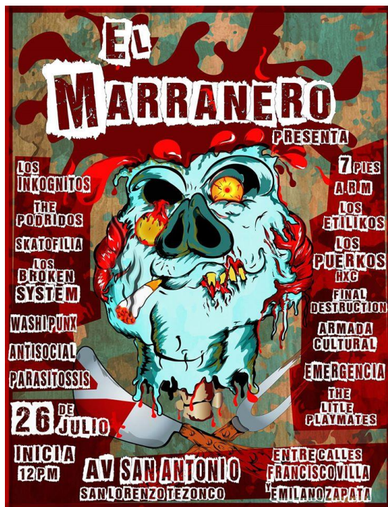
Propa del toquín.

Tocada 2 San Lorenzo Tezonco, Deleg. Iztapalapa.