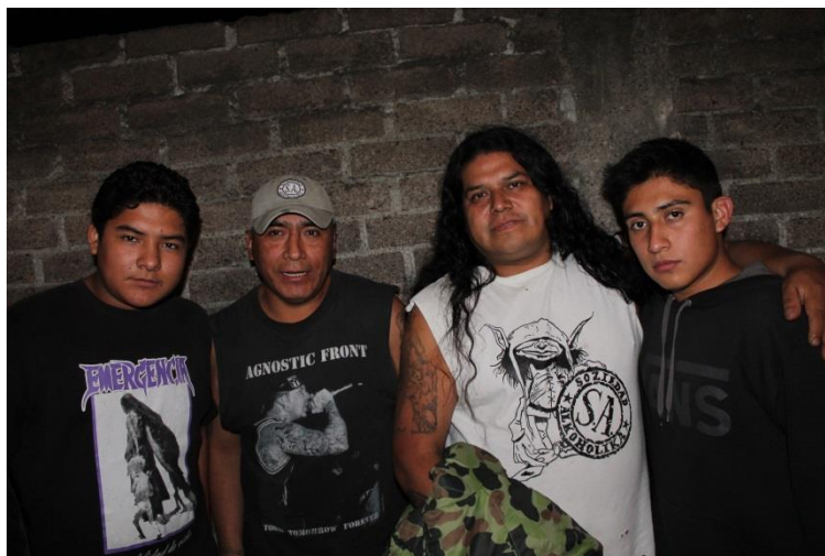
Emergencia el día del toquín.

En comparación con la primera etnografía en la cual ofrecí detalles más concretos, en este evento estoy haciendo pequeñas omisiones, pues como lo comenté líneas arriba, la mayor parte de los asistentes son quienes acudieron meses atrás al evento que describí en primera instancia, por lo que los rituales fueron similares, las horas de las bandas quienes tocamos meses atrás y en este evento tocamos a horas similares y el punto de ebullición es similar, las resignificaciones en cuanto al lenguaje verbal y no verbal de la tocada de meses atrás a esta tocada curiosamente son iguales, los mismos insultos, los mismos gestos, las mismas señas, por lo que omito ciertas partes para evitar el hastío de los lectores y así sea de gran interés los puntos en los cuales este evento fue diferente al primero que describí.