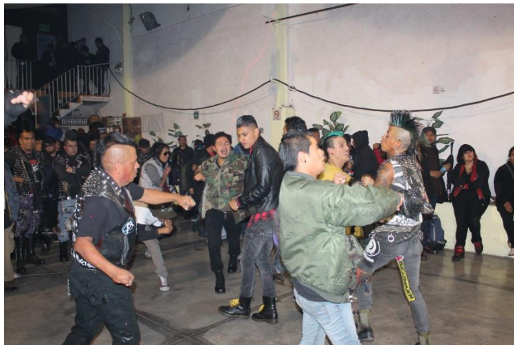
Danza de generaciones en el CPJ

Aunque la juventud ha cambiado, dentro del toquín se observa a gente adulta y a gente muy joven, lo curioso es que el ambiente desde que comenzó está a flor de piel, es decir, el ánimo esta al tope, uno que otro con mona en mano se encuentra bailando, pero son muy contados, lo que impera son los vasos de plástico transparentes llenos de cerveza que dentro del lugar se está vendiendo, pero con el baile se suda, dice el Camilo.