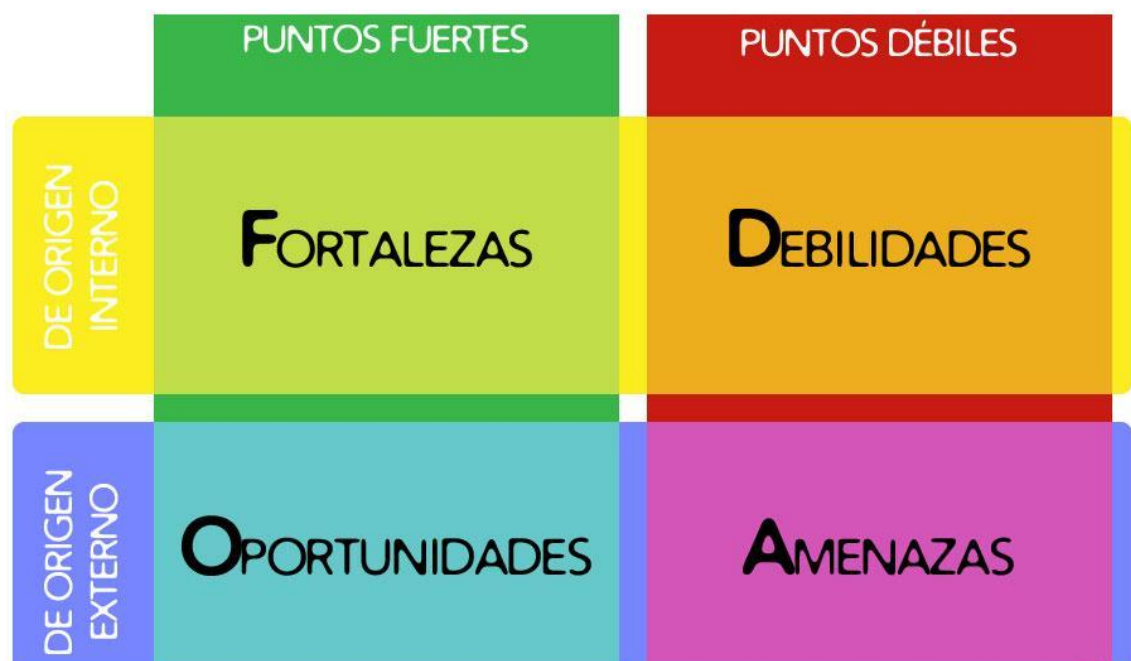
Imagen 4. Elementos que conforman un Análisis FODA para la realización de un Proyecto.

El análisis o la matriz FODA consiste en realizar 4 listas de un posible objetivo, situación o proyecto en donde se plasman las fortalezas, las oportunidades, las debilidades y las amenazas que podrían obstaculizar o favorecer la eclosión de nuestro proyecto.