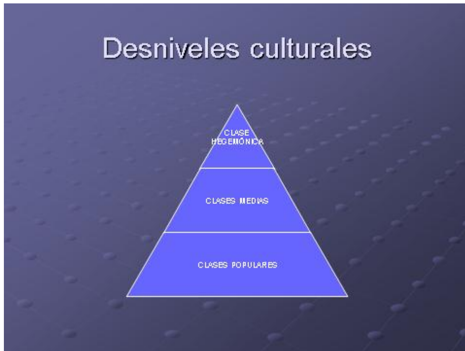
Imagen 2. Pirámide de Desniveles Culturales .

Imagen 1. Elementos esenciales que intervienen en el proceso de construcción de sentido y caracterizan a los Frentes Culturales como espacios de lucha simbólica.