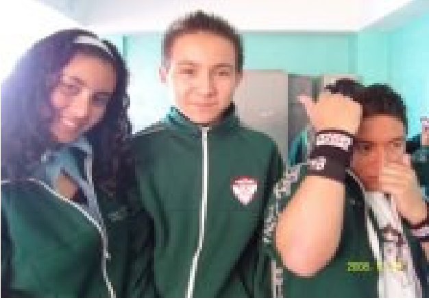
Foto de archivo, alumnos de secundaria.