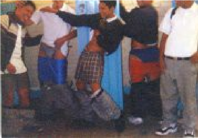
Grupo de amigos, foto proporcionada por un alumno de la secundaria diurna # 184.