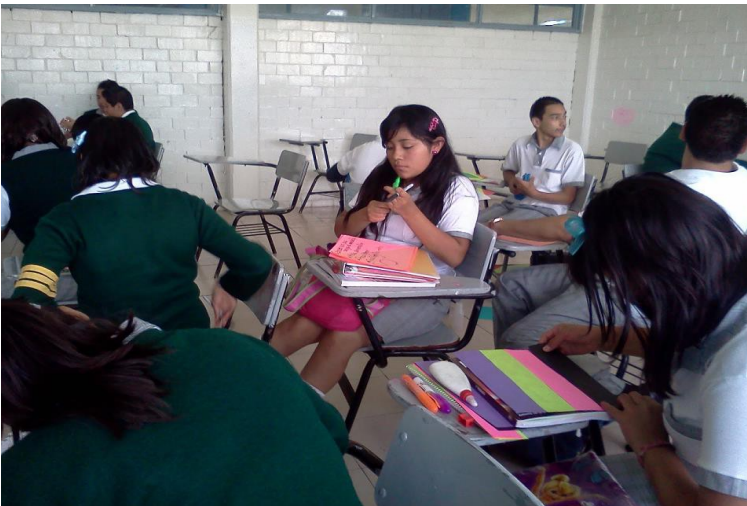
Actividades en el aula.