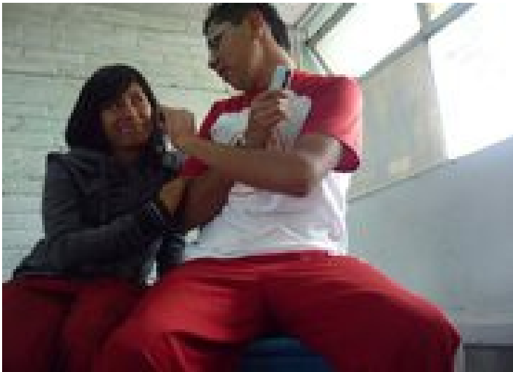
Amigos, estas dos fotos proporcionadas por un estudiante de la secundaria diurna # 184.