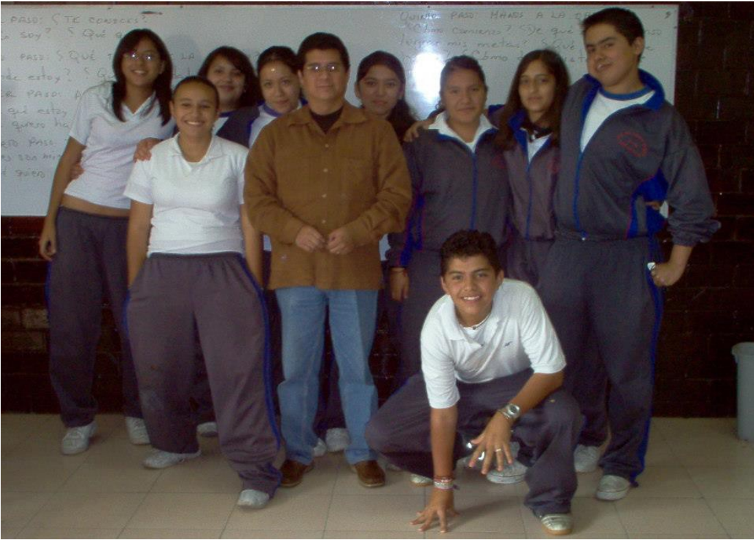
Grupo 2° "B", con el profe de Historia.