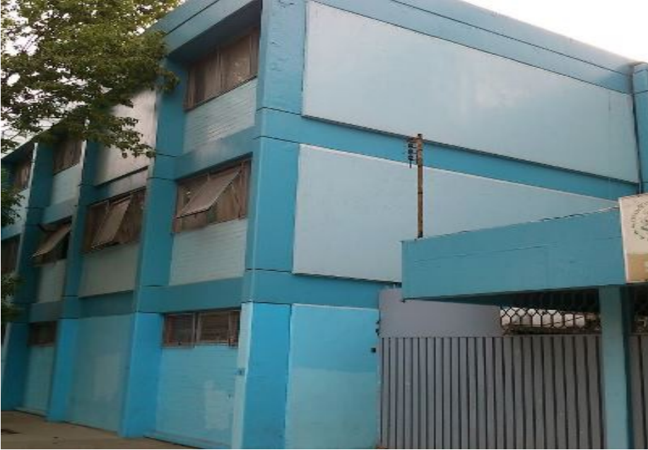
Exterior edificio de laboratorios de la secundaria diurna # 184.