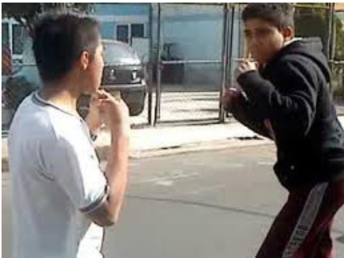
Pelea de estudiantes.