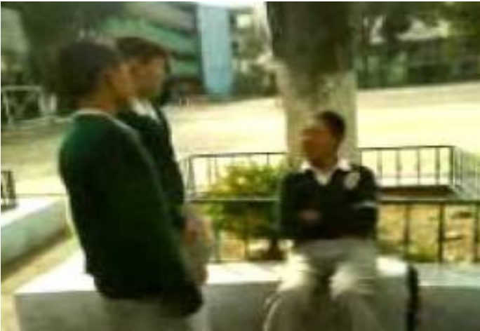
Taloneando a un débilucho.