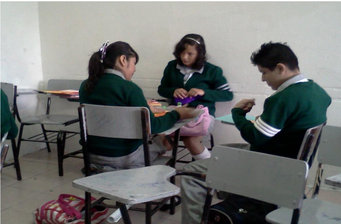
Intercambio de ideas, sin prácticas de bullying.