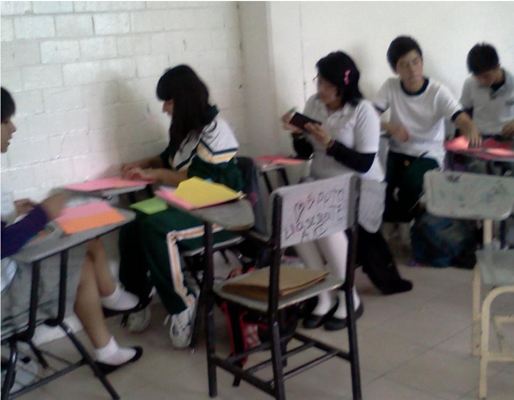
Un día Tranquilo en el aula, así lo desean.