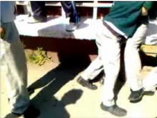
Agarrón de estudiantes dentro del plantel. Tomada el jueves 30 de agosto de 2012, desde un celular.