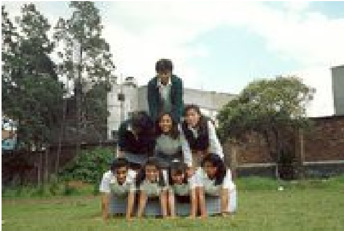
Pirámide, tomada con el celular.