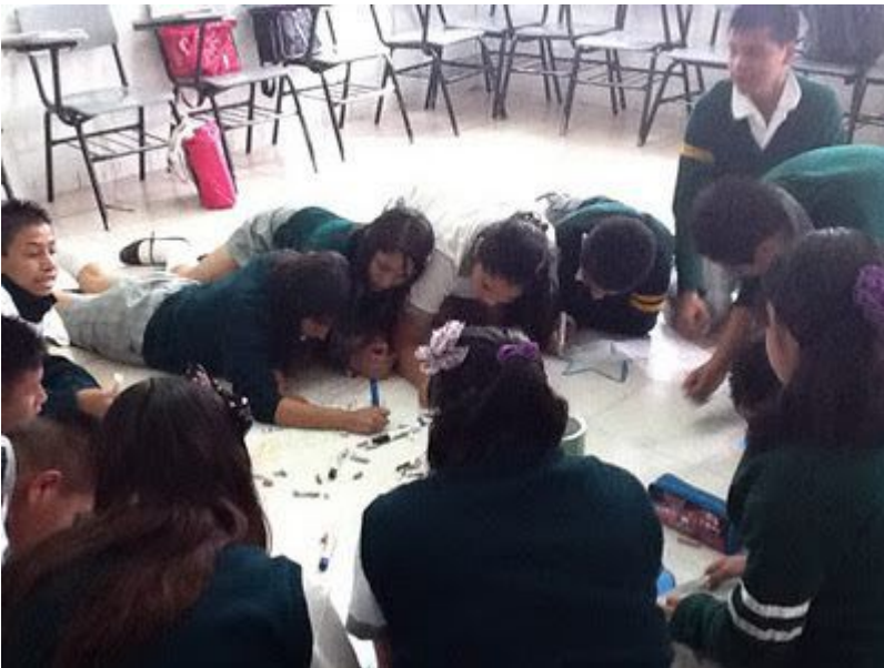
Trabajo en equipo, todos colaboran.