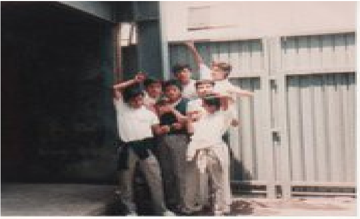
Grupo de amigos.