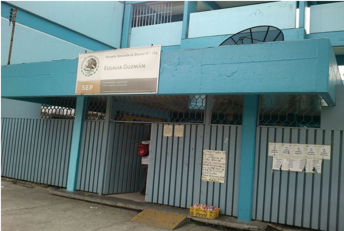
Exterior de la escuela secundaria diurna # 184, tomada el lunes 24 de septiembre de 2012. (3 fotos).