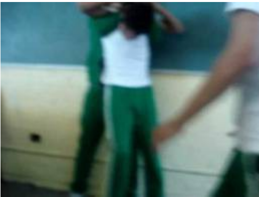
Foto tomada con el celular, compañeros agrediendo a un estudiante físicamente más pequeño.