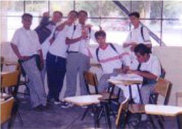
Grupo de alumnos del grupo 3° "D", tomada con celular.