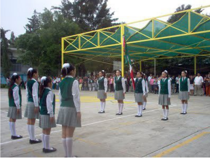
Honores a la bandera.