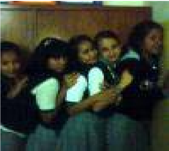
Mejores amigas, tomada con el celular.