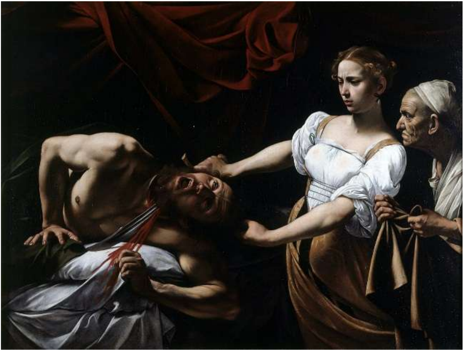
Imagen 2, Judith y Holofernes

Caravaggio 1599 Pintura al óleo Barroco, Tenebrismo 144 cm x 195 cm Galería Nacional de Arte Antigo Roma, Italia