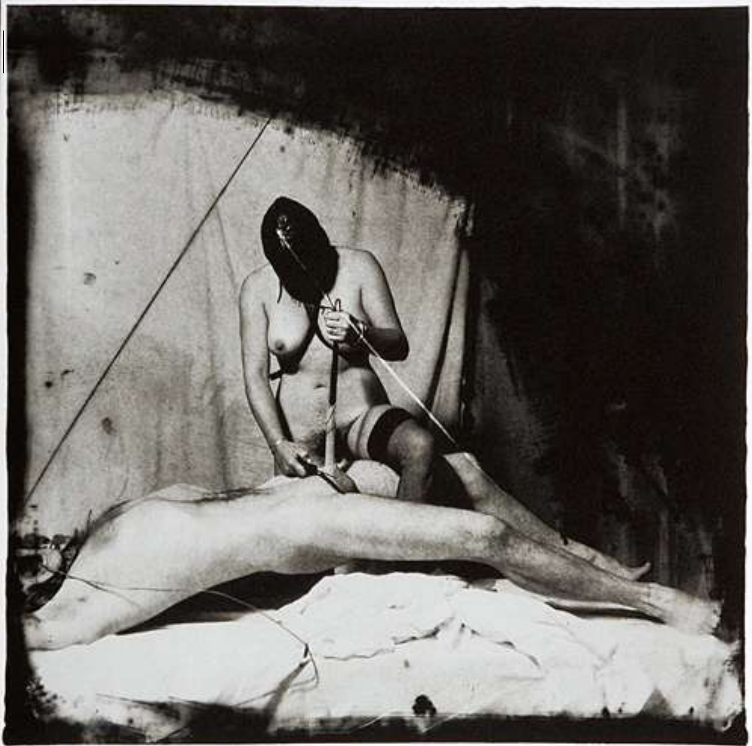
Mujer a punto de castrar a un hombre, NM, 1982, 90x90cm.