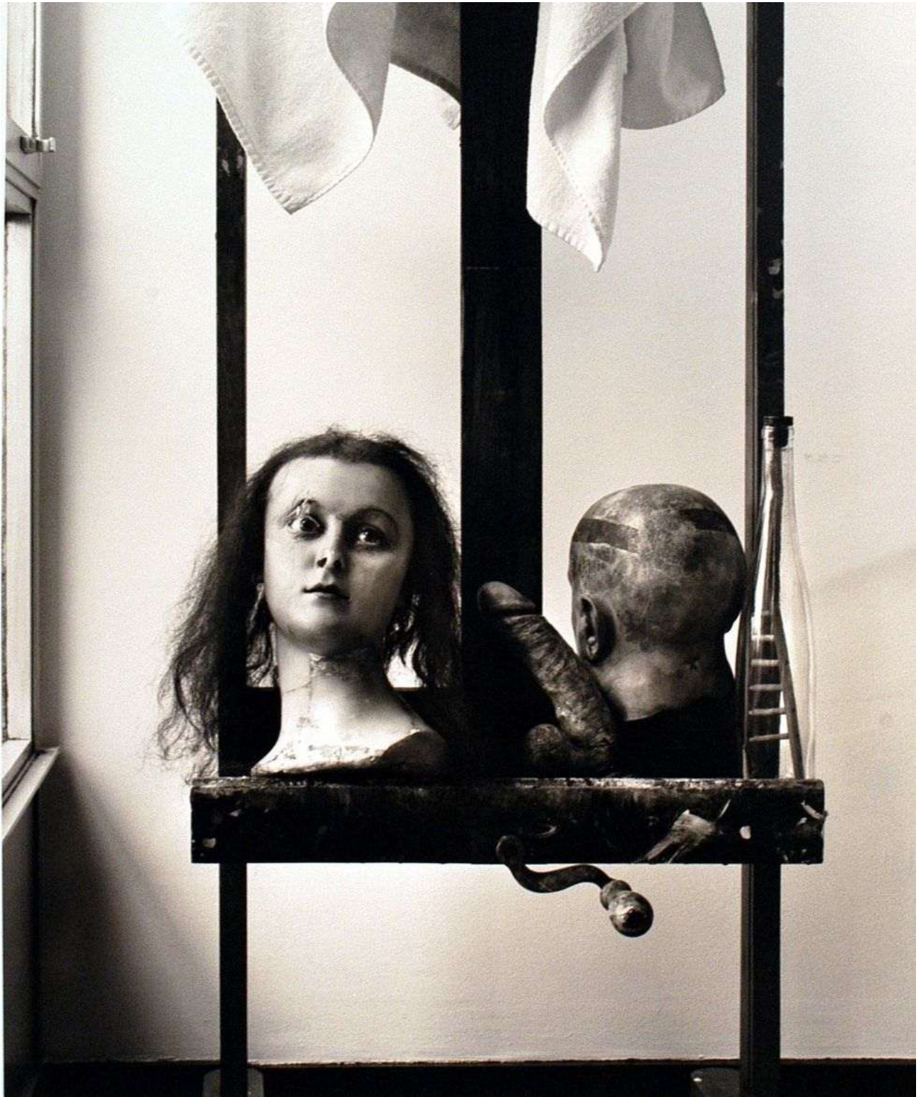
Objetos frente a la ventana , París, 2007, 90x70 cm.