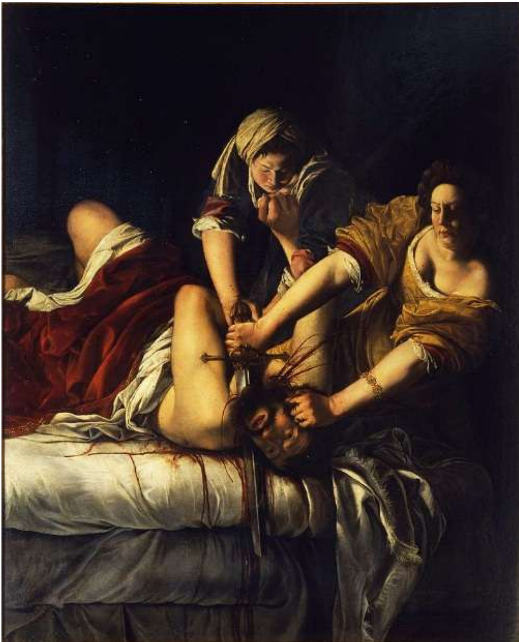
Imagen 1, Judith decapitando a Holofernes

versiones, siendo las más populares, las realizadas por Artemisa Gentileschi (imagen 1) y Caravaggio (imagen 2).