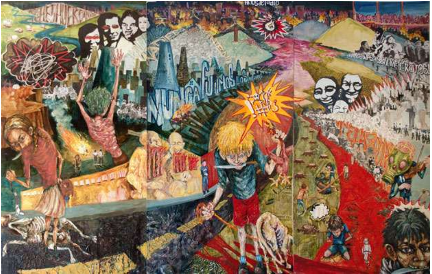
Lucía Vidales Lojero, La espada de Damocles , 2009, óleo, acrílico y collage sobre madera, 240 x 360 cm. Museo Picasso

De acuerdo con este autor, en cuanto a lo grotesco satírico, el artista mira su contexto de una forma escalofriante y cínica, la cual se asemeja a una obra de títeres, en tanto que está vacía y es absurda; por lo que para Kayser, lo grotesco es la vida contemporánea en sí, ya que baila entre el sin sentido de una sociedad ridícula y enmascarada.