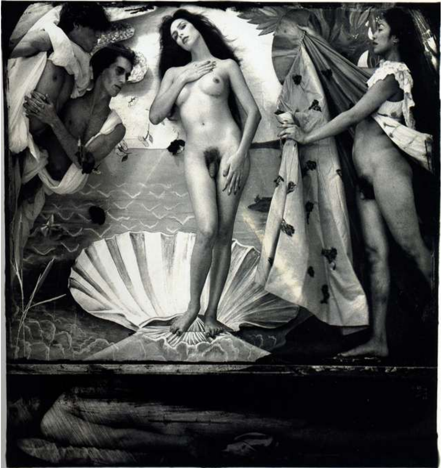
Dioses de la tierra y del cielo, 1988, 81.3 x 77.5 cm