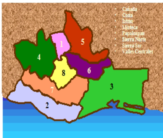
Mapa 1: regiones geográficas de Oaxaca

Fuente: http://images.google.com.mx/imgres?imgurl=http://www.eumed.net , consultado el 12 de junio del 2010.