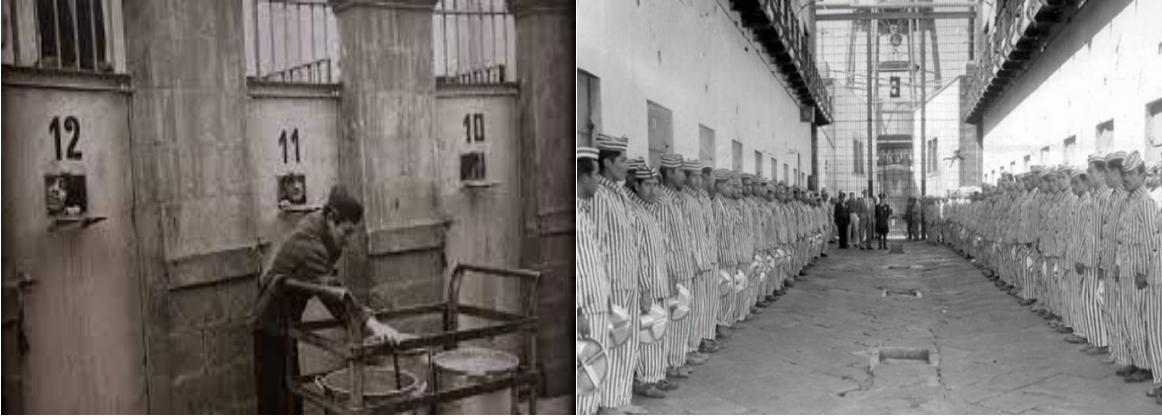
Imágenes 1.5 y 1.6.

maltratos, torturas, violaciones y asesinatos al interior de esa crujía, de tal manera que ese lugar era conocido con el sobrenombre de “palacio negro”, como se observa en las imágenes siguientes 1.5 y 1.6.