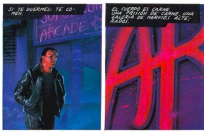
Figura 13. Fuente: Escaneo del libro ilustrado Neuromante (2012) de William

El autor –William Gibson–, como primer paso al comienzo de una era digital, inventó el concepto ciberespacio; término que utilizan pensadores interesados en la cibercultura; en segundo momento, el protagonista de la muy famosa obra, demuestra un desdén al cuerpo, apelando en un momento de la historia que el cuerpo es carne (fig.13), e incluso, en sus momentos de dualidad hace cuestiones como ¿Por qué molestarse por la operación cuando basta con llevar el aparatito en el bolsillo? O La operación no había servido. Él todavía estaba allí, todavía de carne.