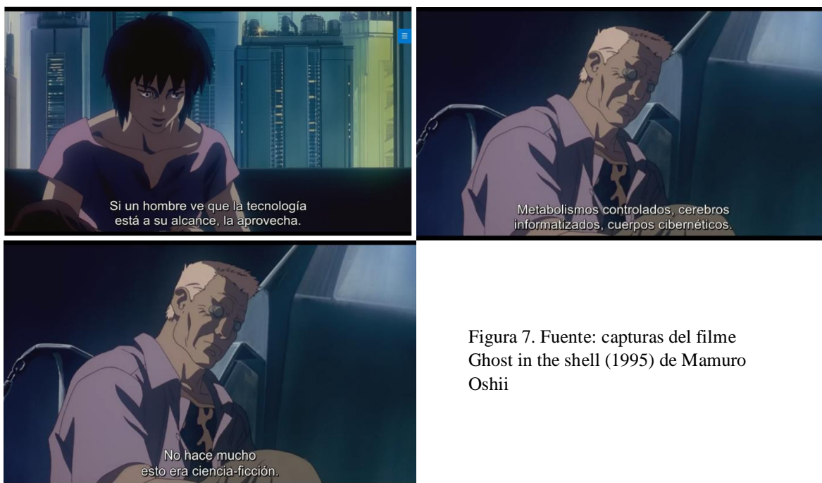
Figura 7.

La animación cinematográfica transporta a cuestionar sobre ¿Cómo nos relacionamos como seres humanos con la tecnología?; ¿Qué es lo que nos hace llamar humanos y qué a las máquinas? Y ¿Qué nos hace humanos si se vive bajo el dominio de los implantes tecnológicos? Por lo que artistas y pensadores contemporáneos, llevados por esa idea de Fernando Broncano (2009) del humano como un ser ciborg y “seres hechos de materiales orgánicos y productos técnicos como el barro, la escritura, el fuego” (Broncano, 2009; 20), han provocado mirar las prótesis como un abrazo al cambio y a una mejoría que enaltece la forma humana (fig.7). Gracias a las cintas como la de Ghost in the Shell es que se tiene una idea de lo que es un ciborg, pues de acuerdo con expertos del tema, se entiende de forma general de acuerdo con Igor Sádaba (2009), que ciborg es la integración hombre-máquina. En cambio, a lo largo de la historia del término se ha ido desarrollando a más profundidad.