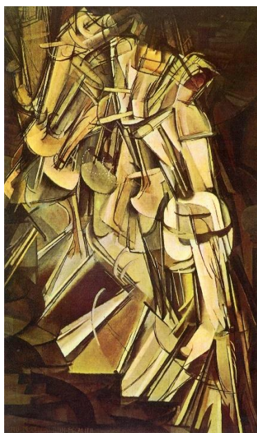
Figura 15. Fuente: Imagen de Desnudo bajando una escalera no. 2 de Marcel Duchamp, editado por xennex. (2017) de https://uploads5.wikiart.org/images/marcel-duchamp/nude-descending-a-staircase-no-2-1912.jpg!Large.jpg

Mientras que, el espectador, ir a los museos de arte contemporáneo y cuestionar “¡Pues vaya! ¿Y eso es arte?”, es una pregunta que Duchamp puso sobre la mesa, ya que ser un artista importante para la entrada del arte no como un producto visual, sino como una idea, es el responsable, de que hoy día, una obra se busque y se interprete por las ideas. Es decir, bien ya sabemos cuál es la búsqueda última de un marchante en el arte contemporáneo, pero ¿qué es lo que busca el espectador que entra a los museos con deseos de encontrar qué?, pues Duchamp, al ser pionero del arte contemporáneo, creó Desnudo bajando de una escalera de 1912 (fig.15) , en ella muestra la idea del movimiento no desde la retina -esto se sabe por la técnica inusual que utilizó en la obra- sino desde el cerebro, desde el pensamiento., y por ende, cuestiones comenzaron a abrirse sobre qué es belleza y cómo debe mirarse una obra de arte en la contemporaneidad, por lo tanto, ¿qué es lo que busca un espectador en el arte contemporáneo?, basándome en las opiniones de Duchamp, entonces puedo sustentar que buscan ideas que los lleven a preguntas y no a respuestas.