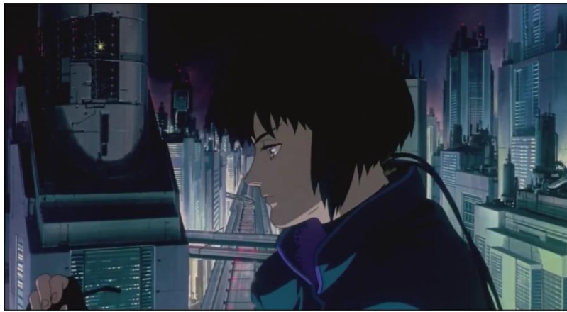
Figura 5. Fuente: captura del filme Ghost in the Shell (1995) de Mamoru Oshii

Ya explicado a grandes rasgos, lo qué trata y lo qué consiguió la cinta como una obra reconocida del cyberpunk, cabe cuestionar ¿Qué es lo que aporta Ghost in the Shell para ser conocida no como una obra popular del cyberpunk, sino como una obra que prevalece para mantener vivo el arte contemporáneo? Pues bien cabe aclarar que es una animación llamada en Japón como anime , el cual David Parada (2012), en su ensayo afirma de forma constante que es una expresión artística que ha sido conocida por los flujos de la Red (Parada, 2012). Se podría analizar desde un ámbito filosófico, ya sea desde un estudio dedicado a la ética, ontológico, o incluso estudiarlo desde el rizoma de Gilles Deleuze (1980) como lo hizo con el arte digital 11 la doctora Claudia Mosqueda, sin embargo, el estudio es meramente estético y por tanto la pregunta que nos hace David Parada: ¿El manga y el anime son artículos de consumo o una expresión artística? da paso a la investigación.