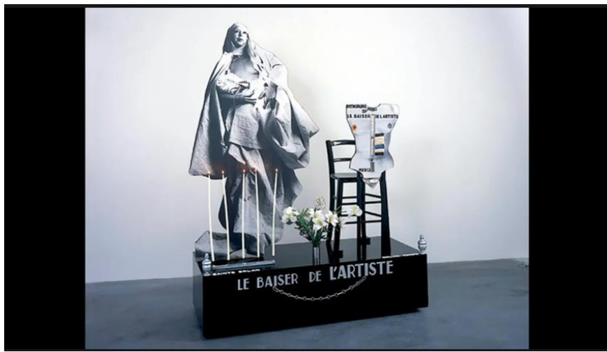
Figura 10.

Cuando Michaud Yves afirmó que hoy en día todo es bello a excepción del arte, no estaba tan equivocado. La artista se dio cuenta que esa percepción de belleza era creada por la configuración de los cosméticos, la moda, los perfumes, las cirugías plásticas que además reproducen la idea de belleza femenina y masculina con fines de una estética manipulada, logrando presionar a individuos de forma que la trasgresión a sus cuerpos se haga con la intención de encajar en un canon de belleza preestablecida por la sociedad, eso incluyendo la historia del arte.