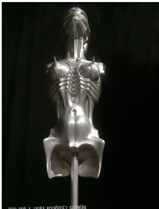
Figura 3. Exposición Solo con la noche HR. Giger