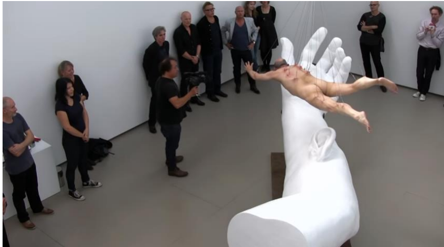
Figura 8. Fuente: Captura del performance Suspensions (2012) de Jonh Doggett-Williams

atravesaba la piel del artista provocando que su cuerpo quedara suspendido en el aire, con eso cumplió su cometido: agotar físicamente al cuerpo y presentarlo como un objeto para así evidenciar su obsolescencia.