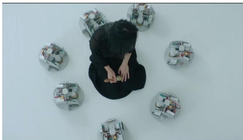
Figura 14.

El cyberpunk, dice María Salvador Cabrerizo (2011) que expone una serie de medios, posibilidades, e incluso preguntas de carácter a un público masificado que apenas es consciente de las ideas que está absorbiendo en el visionado de la que tal vez, solo se trate de su película favorita. (Cabrerizo, 2011; 464) curiosamente, lo que comenzó como un género que mostraba cómo la alta tecnología podía ser subvertida en manos de oportunistas, ya sea por dinero o simplemente por diversión, pasó en 1987 a ser un género cliché, e irónicamente, opina Mark Dery (1998) que mientras el término pierde su significado, para algunos, –para nosotros–, aun se difunde como un virus en la cultura dominante, donde aún sigue extendiéndose. (Dery, 1998; 79-80).