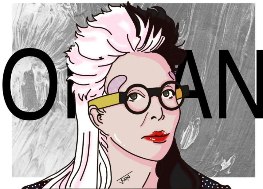
Figura 11. Ilustración por jjinxlustrax de Orlan. (2020)

ideal de belleza, por lo tanto terminó por mostrarnos que la obsesión de una cultura por mantener un canon estético al final solo provoca producir monstruos.