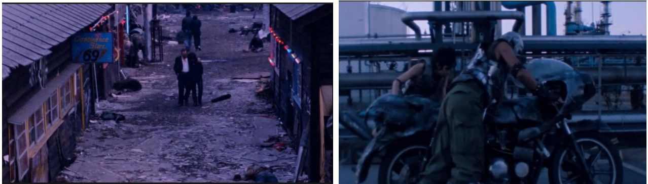
Figura 4.

Es necesario aclarar que las ideas cyberpunk fueron incrustadas en el occidente por medio de la literatura, mientras que en Japón nació por medio de la música. Durante finales de los setenta y principios de los ochenta Tokyo estaba disfrutando de una vibrante aura underground 9 de música punk, un ethos que luego se diversifica en el arte y en el cine, gracias a Sogo Ishii, quien dirigió después de varios éxitos Burst city (1982), en donde encapsula y resume lo que fue el movimiento Punk y muestra una estética clave del cyberpunk de Japón: entornos industriales, almacenes abandonados y decadentes salas de calderas con un escenario distópico. (fig.4)