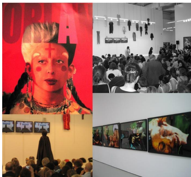
Figura 12. de expo Orlan à Saint-Etienne (2007)