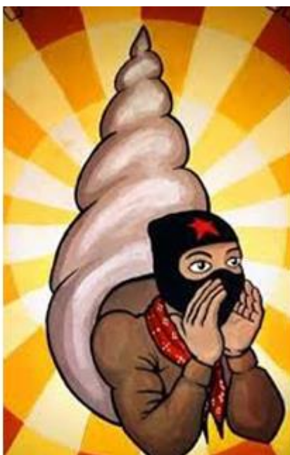
Imagen 2. Caracol neozapatista haciendo un llamado al pueblo

También está asociado con el conocimiento que entra en el corazón de los hombres verdaderos, según la concepción de los dioses primeros; pero no solamente el caracol representa el conocimiento, sino también la vida y por ende salir al mundo para desarrollarse y comunicarse. Pero no nada más tiene este atributo del conocimiento y vida, sino tiene la virtud de ayudar a escuchar la palabra aunque esta proceda de un lugar muy lejano, es decir, puede ayudar a escuchar lo que los demás no quieren o no pueden escuchar.