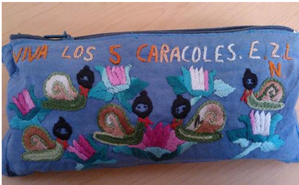
Bordado 2. Imagen de los cinco caracoles neozapatistas

También se puede ver la estrella roja con las siglas del Ejército Zapatista de Liberación Nacional. Algo muy significativo es el camino que ha recorrido la mujer neozapatista, es decir, hay que recordar que el viejo Antonio, decía” el camino no está hecho, hay que hacerlo” y como se ve en el bordado la mujer neozapatista está haciendo el camino con el objetivo de crear un mundo mejor y alternativo. 191