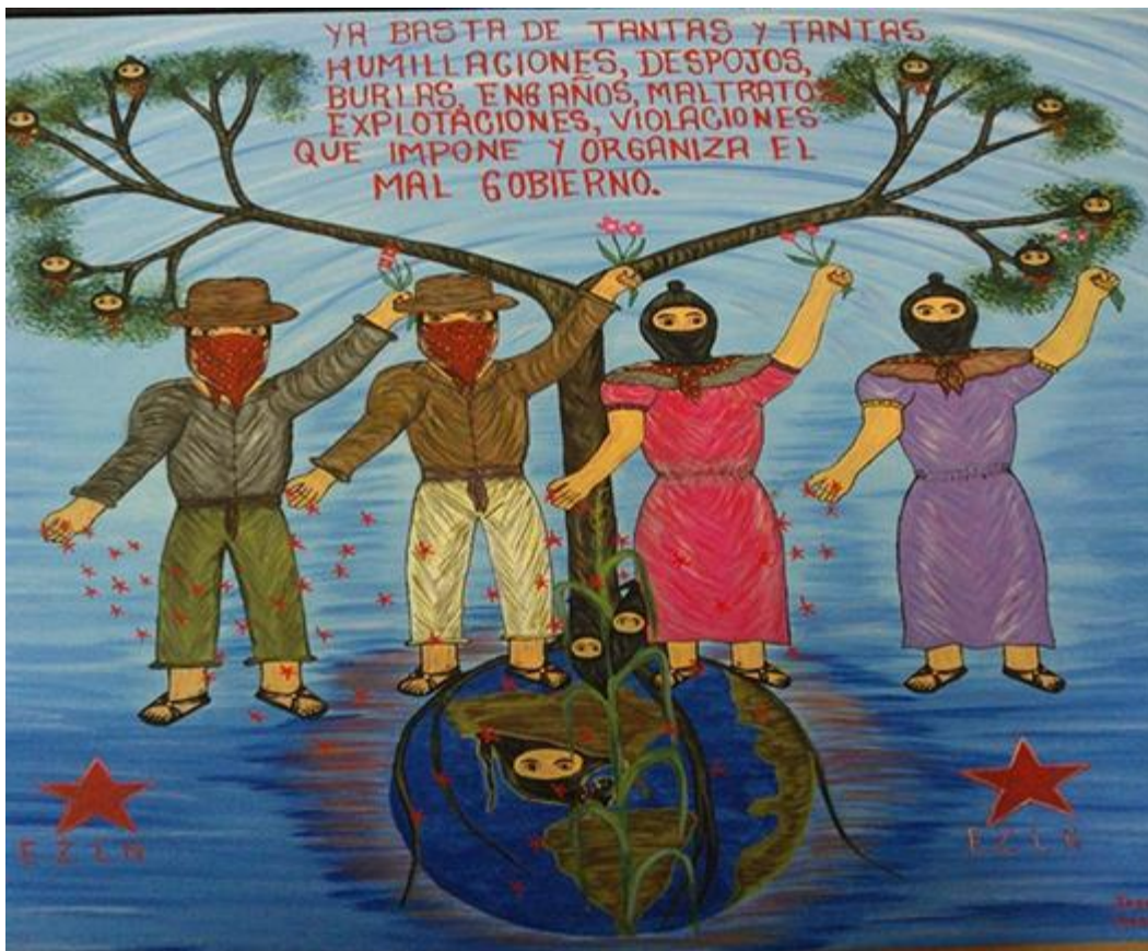
Cuadro 2. Pintura elaborada por José Luis, en uno de los talleres de pintura de los caracoles neozapatistas

En la cuadro número dos que se muestra arriba, se puede observar en primer plano el fondo, este esta totalmente iluminado de color azul, este color puede simbolizar la lealtad y la paz, en relación con lo que quieren los neozapatistas. En segundo término aparecen dos mujeres neozapatistas y dos hombres igualmente neozapatistas.