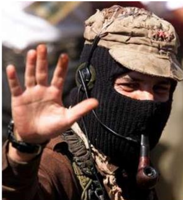
Imagen 11. Subcomandante Insurgente Marcos, ahora Subcomandante Galeano

Tal vez la elección del pasamontañas y el color del mismo se dieron de manera ortodoxa, pero resulta fundamental en el tejido de símbolos que crea el neozapatismo, además el pasamontañas de ser un símbolo de criminalidad será convertido en un “símbolo de rebeldía”, porque se acaba o se pierde el miedo.