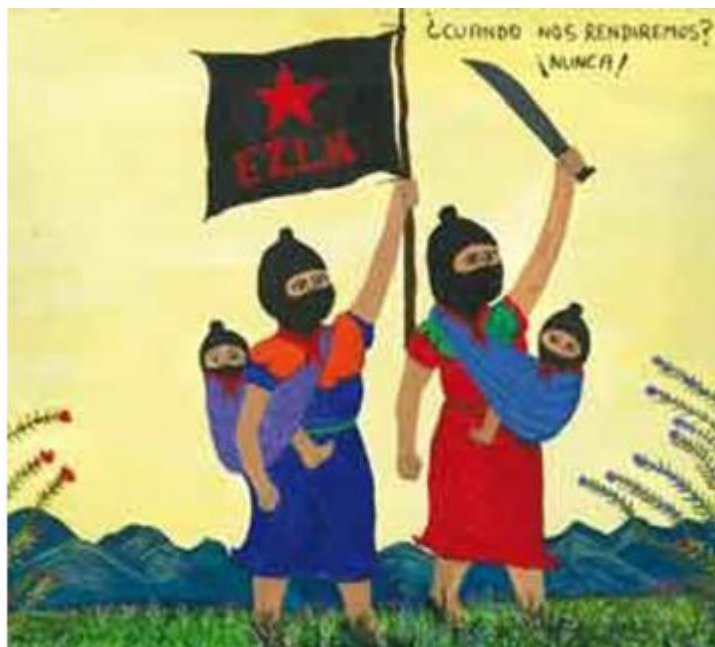
Imagen 16. Mujeres neozapatistas con la consigna “¿Cuándo nos rendiremos? Nunca”

El movimiento neozapatista como el FPDT, tienen un objetivo en común la “defensa de la tierra”, ya que si bien el neozapatismo no enfunda un machete en forma visible, aunque en el inicio algunos de los combatientes portaba un machete, en la actualidad ya no se porta y solamente es utilizado en el campo, es decir, en las actividades agrícolas, no deja de ser un símbolo o referente dentro del movimiento.