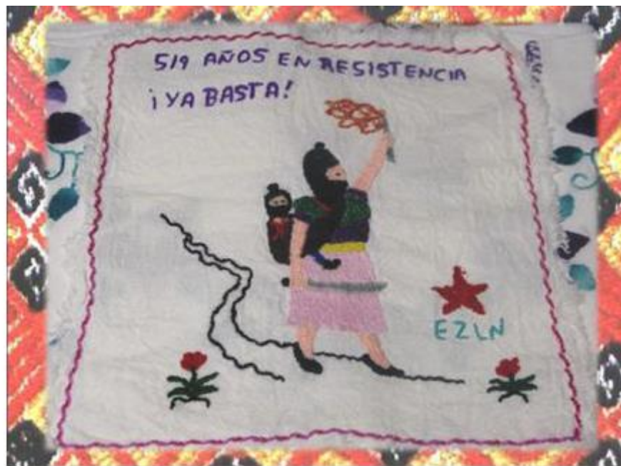
Bordado 1. Confección que hace mención a los 519 años de resistencia de los neozapatistas

Las comunidades indígenas también se encargan de hacer bordados, principalmente las mujeres rebeldes, ya que estos pueden ser vendidos y con ello contar con un poco de dinero que les ayude en los gastos. En los bordados expresan sus sentimientos y con ello crean arte con estos bordados. A continuación se muestran dos imágenes de bordados que realizan las mujeres neozapatistas.