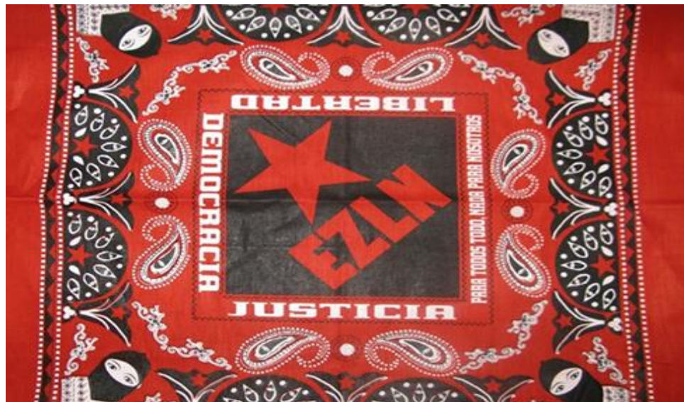
Imagen 13. Paliacate con las tres demandas del EZLN: “Libertad, Democracia y Justicia”

Como se puede observar en la cita anterior los colores que tiene el paliacate que es usado por los neozapatistas se asocian mucho con el significado que en ellos tiene la concepción del mundo indígena; por ejemplo, el color amarillo es muy importante porque significa el color del maíz, y cuántas veces se ha escuchado decir a los neozapatistas que ellos son los hombres de maíz, es decir, el hombre y el maíz están estrechamente relacionados porque son los hombres verdaderos, esto es porque ellos se consideran los herederos de los pueblos originarios. Además de ser el alimento fundamental de América, ya que en Europa el trigo es la base de su alimentación, mientras tanto el arroz es el alimento básico de Asia. 148