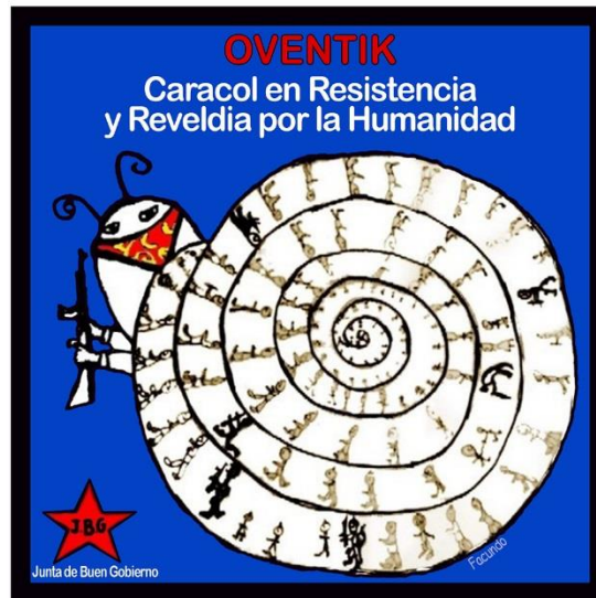
Imagen 6. Representación del caracol de Oventik