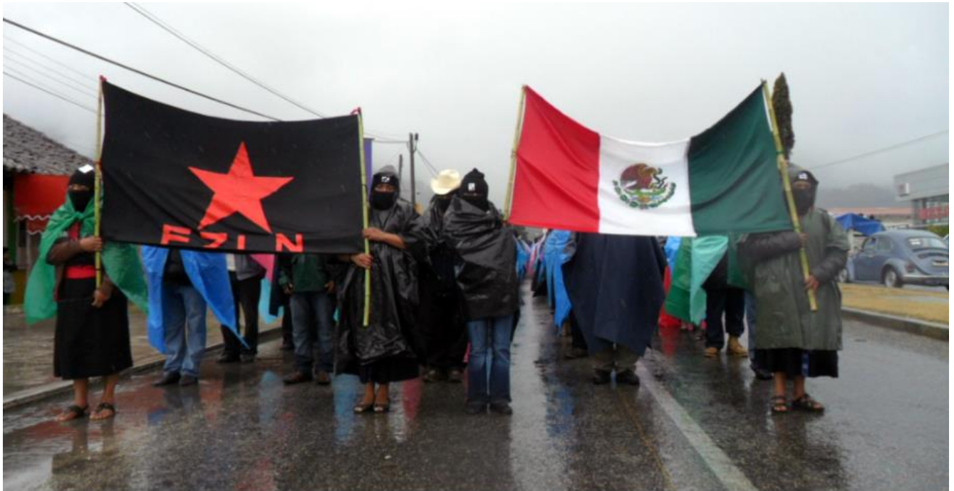
Imagen 1. Movilización neozapatista, 21 de diciembre de 2012.

A continuación se muestra la bandera neozapatista.