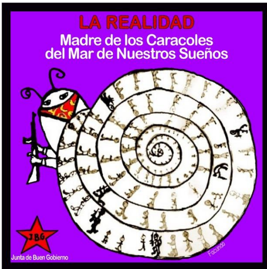
Imagen 4. Representación del caracol de La realidad