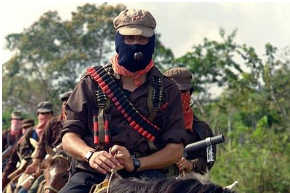
Imagen 14. Subcomandante Insurgente Marcos a caballo

Pero hay otro significado del paliacate respecto del color rojo, pues este símbolo se recodifica como lo menciona Carlos Alberto Ríos Gordillo: “el paliacate, símbolo de los campesinos, es ahora un símbolo de la sangre de los compañeros caídos, decía el Votan Mateo”. 149 Con ello, el paliacate es el reflejo de la sangre de aquellos neozapatistas que murieron, el uso del paliacate es como una especie de recuerdo de aquellos combatientes neozapatistas y que siempre los llevan en su memoria. Un ejemplo, es el paliacate que usa el Subcomandante Insurgente Marcos, porque la prenda perteneció al Subcomandante Pedro quien falleció en combate aquel 1 de enero de 1994, como se puede observar en la imagen 13.