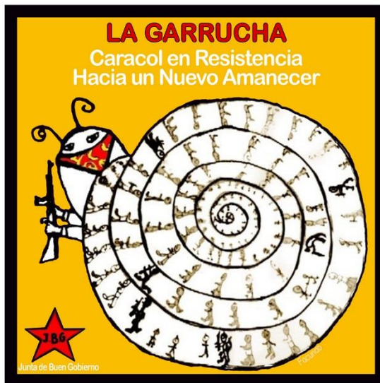
Imagen 7. Representación del caracol de La Garrucha