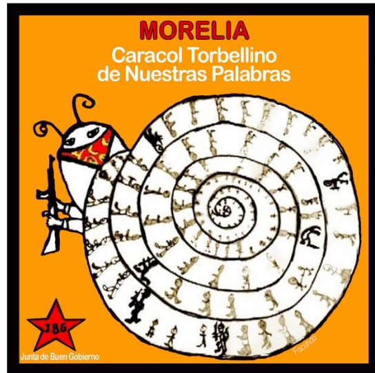
Imagen 5. Representación del caracol de Morelia