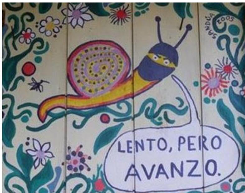
Imagen 9. Pintura de un caracol con la leyenda "Lento, pero avanzo"

Con todo lo anterior, el caracol es un símbolo de gran importancia en la concepción de los neozapatistas, porque no solamente es el animalito en sí, sino también el nombre del caracol y el significado que ha tomado porque es parte indispensable del accionar del movimiento neozapatista, ya que este animalito es lento y paciente.