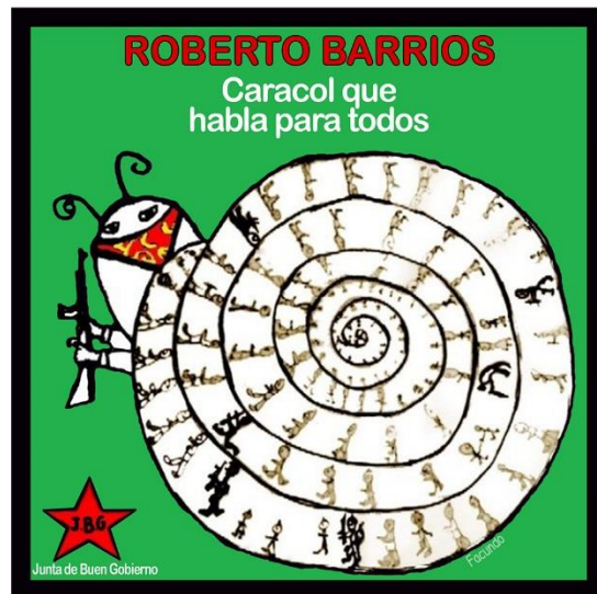
Imagen 8. Representación del caracol de Roberto Barrios