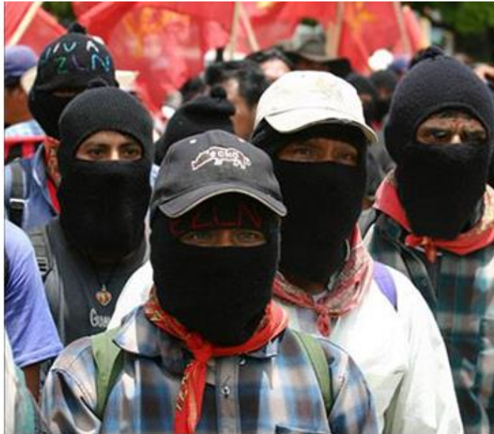
Imagen 12. Hombres neozapatistas en la marcha de 21 de diciembre de 2012

Si el pasamontañas es un símbolo de rebeldía dentro del movimiento neozapatista, el paliacate también es un símbolo resignificado y por ende relevante dentro del movimiento neozapatista. Cuántas veces hemos visto que los integrantes del neozapatismo portan un paliacate con mucho orgullo, como se muestra en la imagen 12.