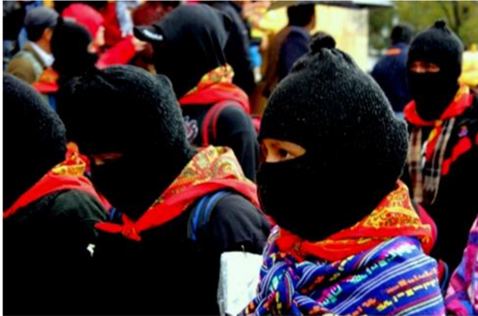
Imagen 15. Bases de apoyo neozapatistas con el paliacate y pasamontañas, 21 de diciembre de 2012

Pero también en las pinturas, imágenes y murales se observa a los neozapatistas con su paliacate rojo atado al cuello o cubriendo su rostro.