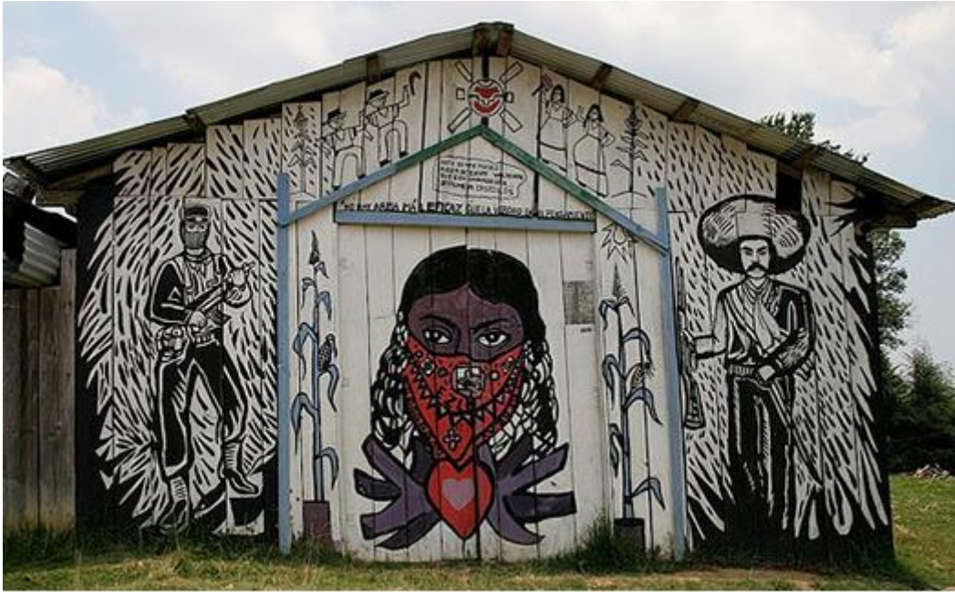
Mural 2. Fachada del Auditorio de Oventik, Chiapas

En el segundo mural que se puede observar arriba se pueden observar tres imágenes en el mismo mural. Al centro del mural se plasma el rostro de un mujer indígena, el color del rostro de la mujer es de ‘color de la tierra’, como dicen los neozapatistas; además, tiene el rostro cubierto con un paliacate rojo que significa la identidad y un arma de lucha. Debajo del rostro de la mujer se puede mirar un corazón rojo que significa la vida y la fortaleza; a lado del rostro están dos matas de milpa, el maíz es un símbolo de las comunidades indígenas, porque ellos son los hombres de maíz.