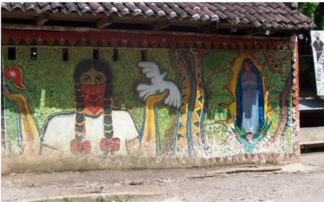
Mural 1. Iglesia de San Pedro Polhó, Chiapas

A continuación se analizaran algunos de los murales que existen en las comunidades rebeldes.