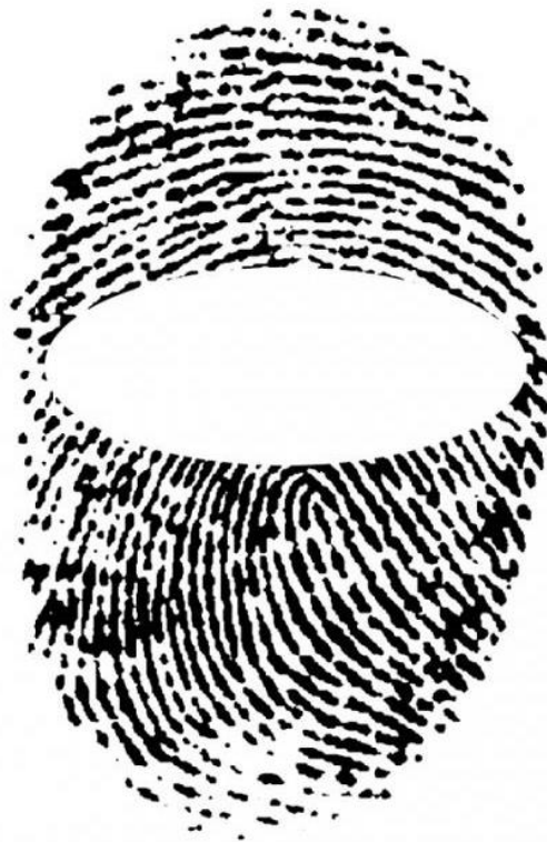
Imagen 10. Huella digital haciendo alusión al pasamontañas

Antes del alzamiento del movimiento neozapatista el pasamontañas era considerado como una prenda o símbolo que se encontraba asociado con el terrorismo, con asaltantes o criminales, debido a que estos cubren el rostro para mantener el anonimato de su identidad y con ello esconderse de las autoridades. Pero esta percepción del pasamontañas cambiará con la irrupción del neozapatismo.