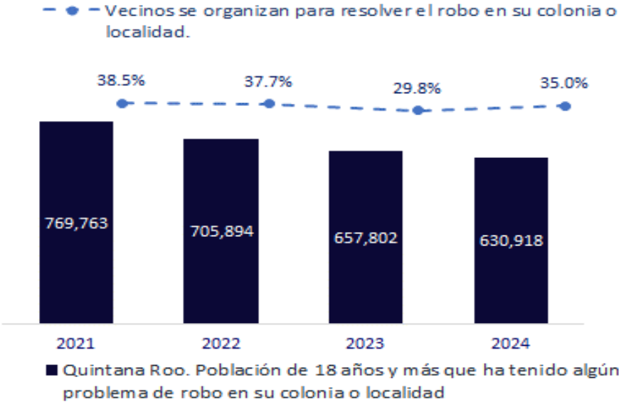
(Gráfica 2: Registro de víctimas de robo en Quintana Roo de 2012-2024)

Fuente: Elaboración propia con datos de la Encuesta Nacional de Victimización y Percepción sobre Seguridad Pública (ENVIPE) 2024.