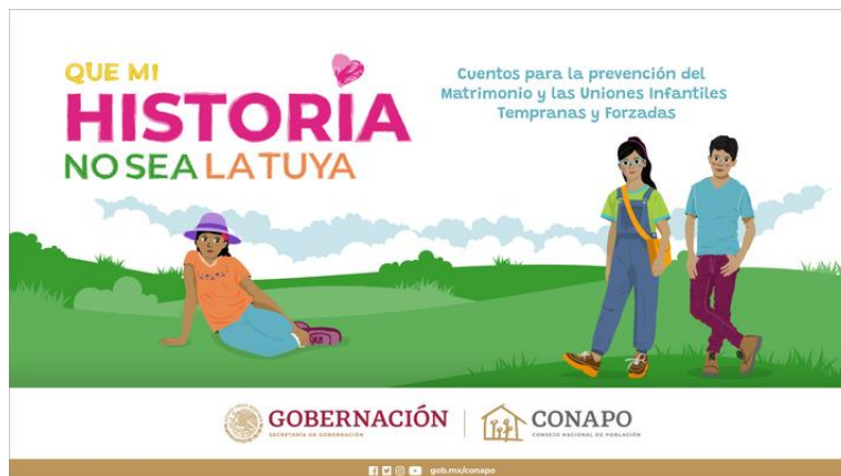
Fig. 4Arte Cartel Que Mi Historia No sea la Tuya CONAPO,2023.

La liga para entrar al libro digital ilustrado se encuentra aún vigente en la página de la CONAPO con este cartel