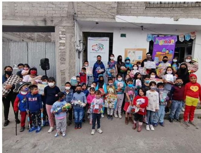
Fig. 6 Niños Milpaltenses celebración día de Reyes, 7 enero 2022, A.C. Cultura Arte Tradición y Tecnología