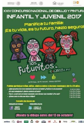
Fig. 3Arte del Cartel de difusión sobre el XXIV Concurso de dibujo y pintura infantil y juvenil 2017 de la UNFPA, CONAPO, 2017.

Otro de los proyectos organizado por la CONAPO fue para el 2023 pero la propuesta fue a nivel estatal, con la finalidad de apoyar la reducción de embarazos en adolescentes de 15 a 19 años y erradicarlo en niñas de 10 a 14 años; esta lleva por título “Que mi Historia No sea la tuya. Cuentos para la prevención del Matrimonio y las Uniones Infantiles Forzadas y Tempranas” 11