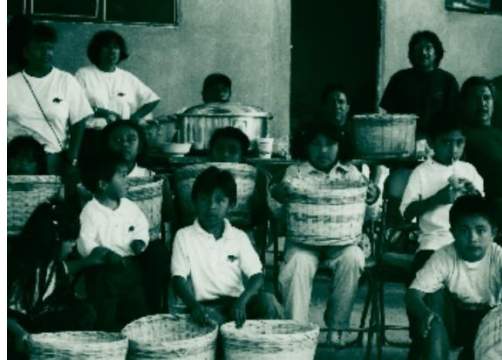
Fig.5 Niños Milpaltenses en la fiesta del 6 de enero, que se celebra en Chalma fotografía Rodolfo Palma Rojo, 2003. Acervo personal. Foto encontrada en libro Nahuas de Milpa alta de la autora Wachter Rodarte Met (Wachter,2006:9)