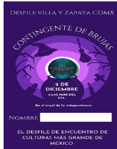
Imágenes 9 y 10

El desfile no fue muy grande, pero visibilizo y unió a las brujas, y puedo decir que en el tiempo que llevo en este sendero de la brujería, nunca había escuchado de un desfile de brujas, que no tuviera que ver con la celebración de Halloween o de día de muertos, estos eventos ayudan mucho a reivindicar a las brujas y sus prácticas, porque se dejan ver como lo que son, mujeres empoderadas y libres, por que escogieron creer en lo que ellas querían y no en lo que se les impuso, pues el elegir el camino de la brujería, debe ser una elección propia, porque toda mujer que entra al sendero de la brujería debe estudiar y debe estar bien informada de las prácticas de la brujería. Me atrevo a indicar, que, si algo es cierto, es que la brujería puede llegar a dañar, así como puede curar o atraer la abundancia, así puede traer infortunios, como bien se muestra en la siguiente imagen.