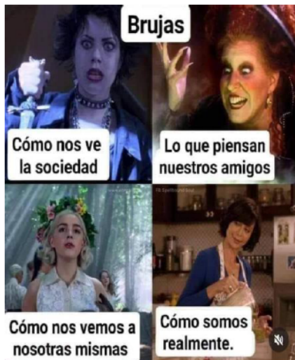
Imágenes 7 y 8