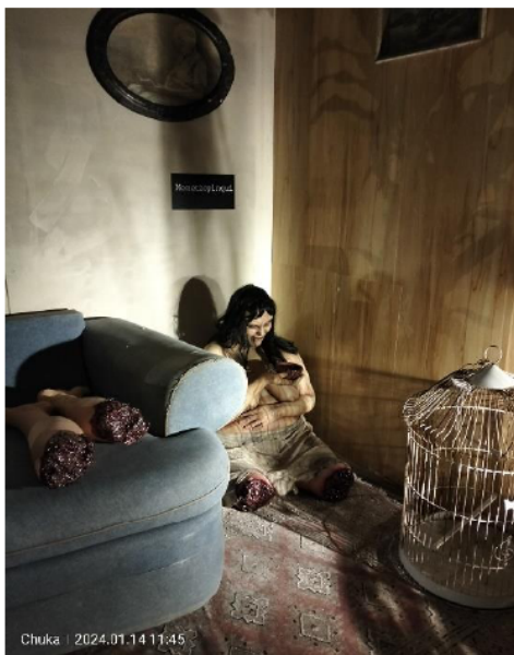
Imagen 3 y 4