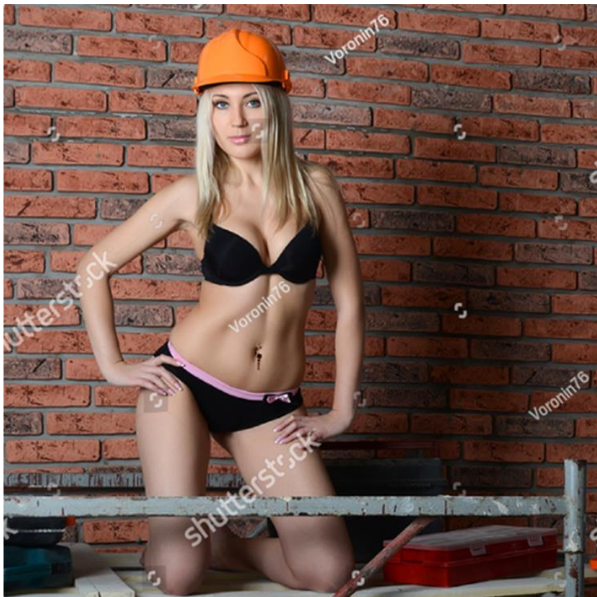
Imagen de referencia 1.1

Descripción sitio web: La mujer en ropa interior con casco. ID 140686948.