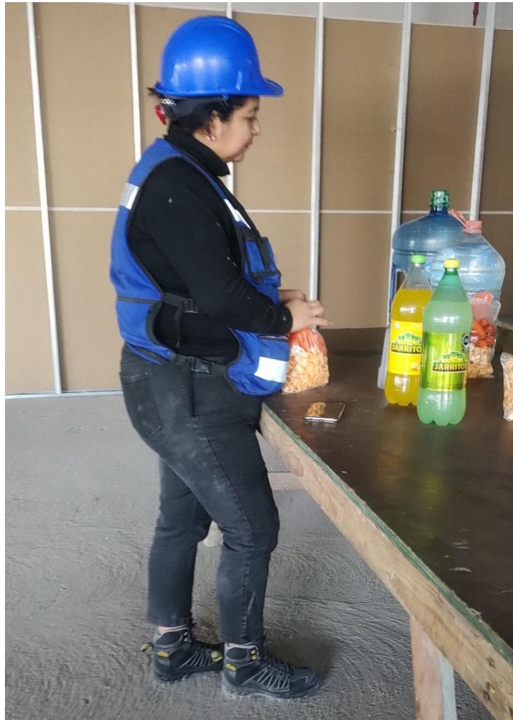
Fotografía archivo documental 1.11