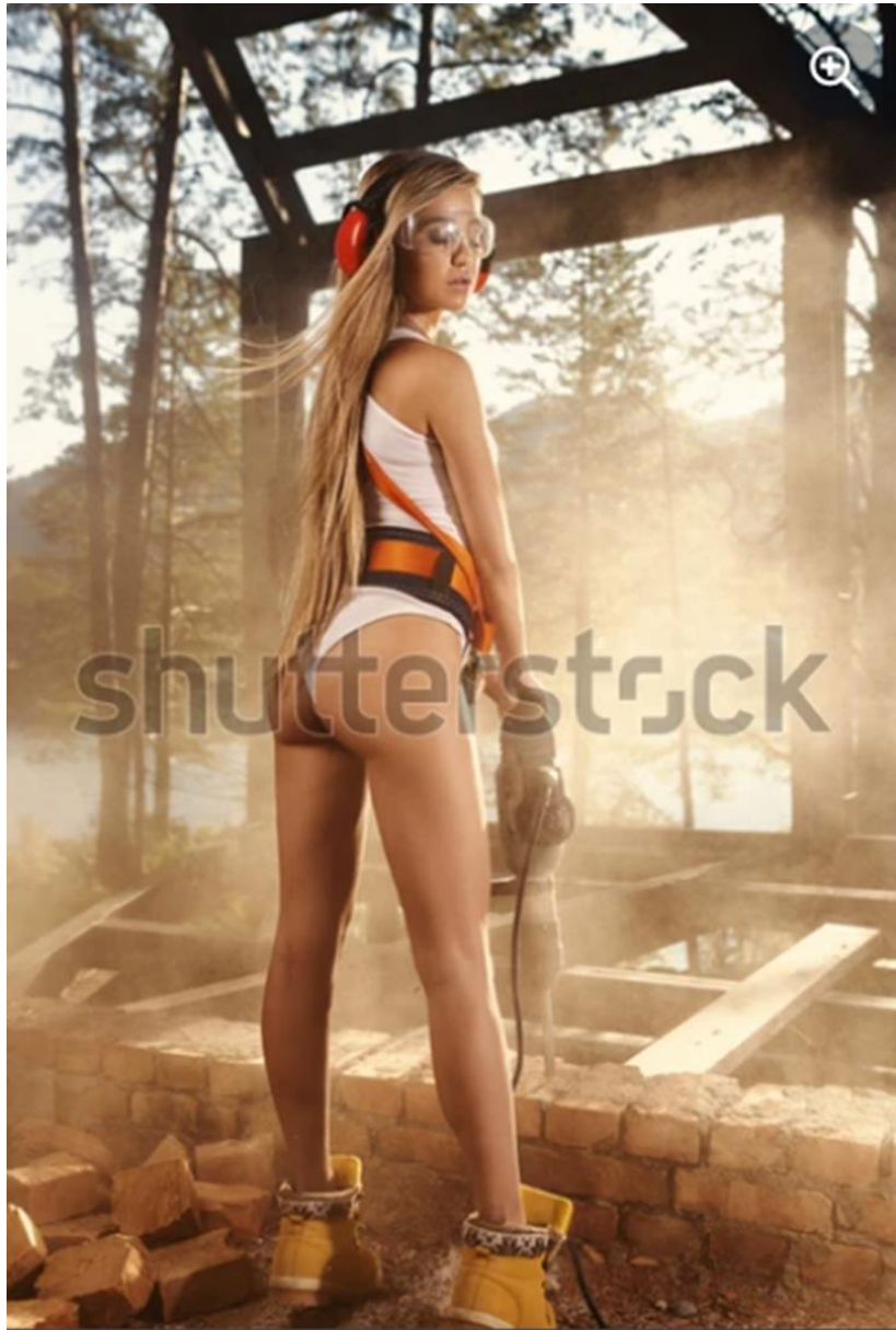
Imagen de referencia 1.2

Descripción sitio web: Vista posterior: La mujer sexy con uniforme de construcción, lentes y protectores auditivos sostiene una perforadora profesional sobre una base de ladrillos y cemento al aire libre. ID 1420179497