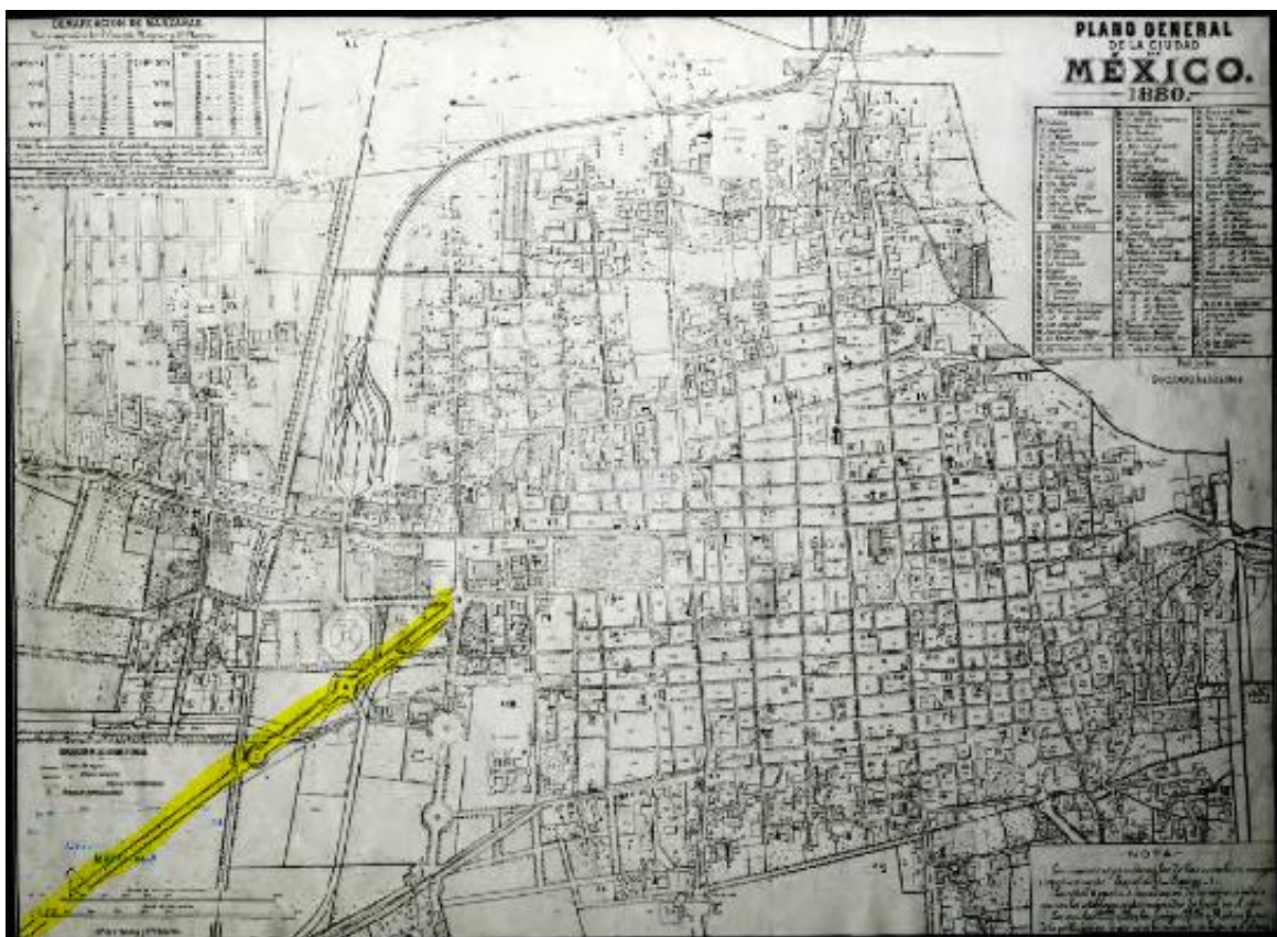
Plano General de la Ciudad de México