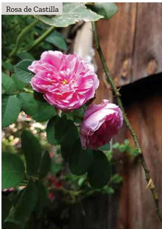
Rosa de Castilla