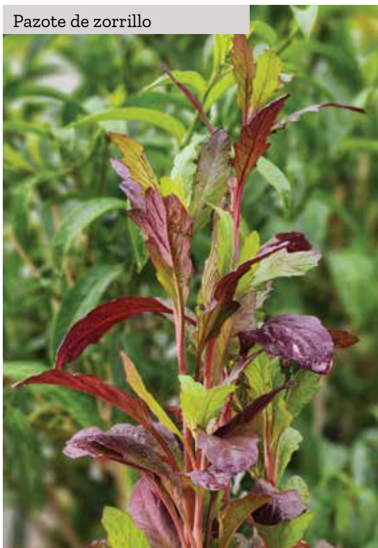
Pazote de zorrillo