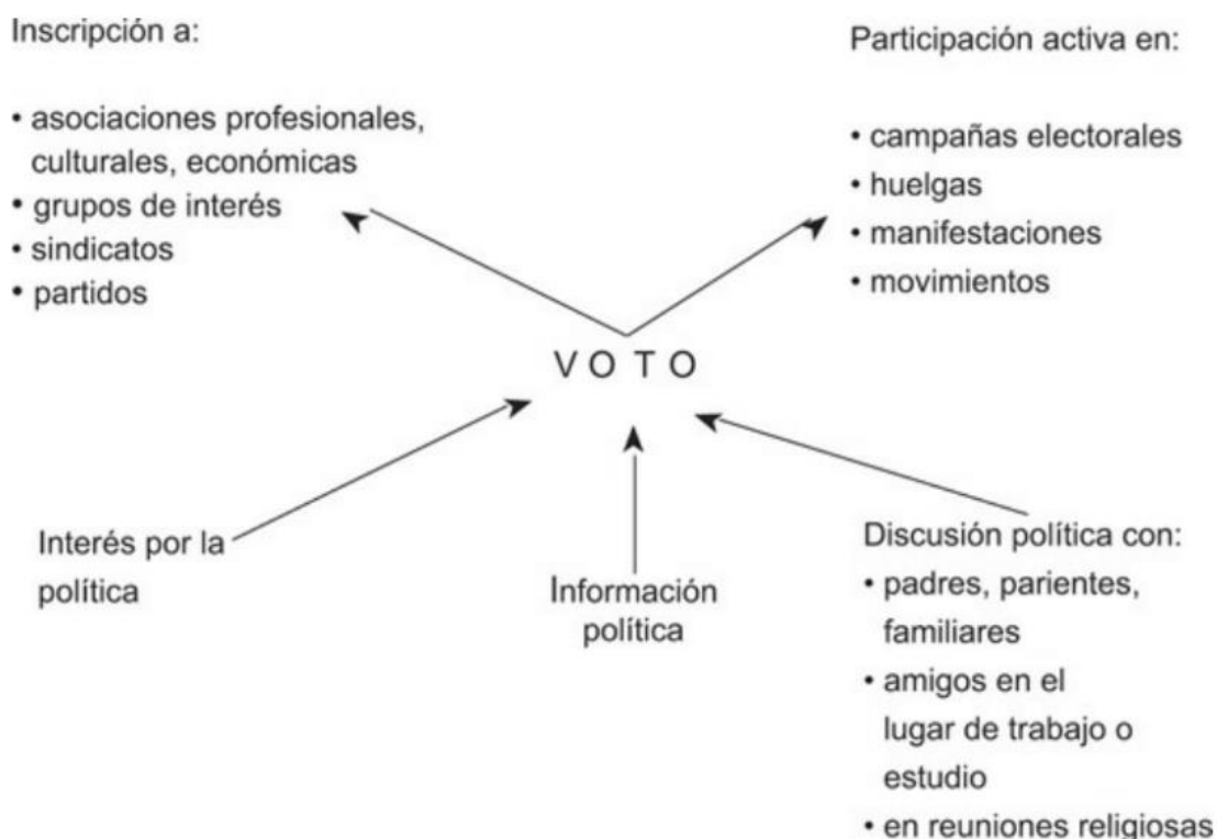
“FIGURAI.2. Motivaciones de la participación política.” (Pasquino, 2011, p. 82)

Y con el siguiente cuadro, se explica cómo puede ser una causa en el interés hacia la vida política.