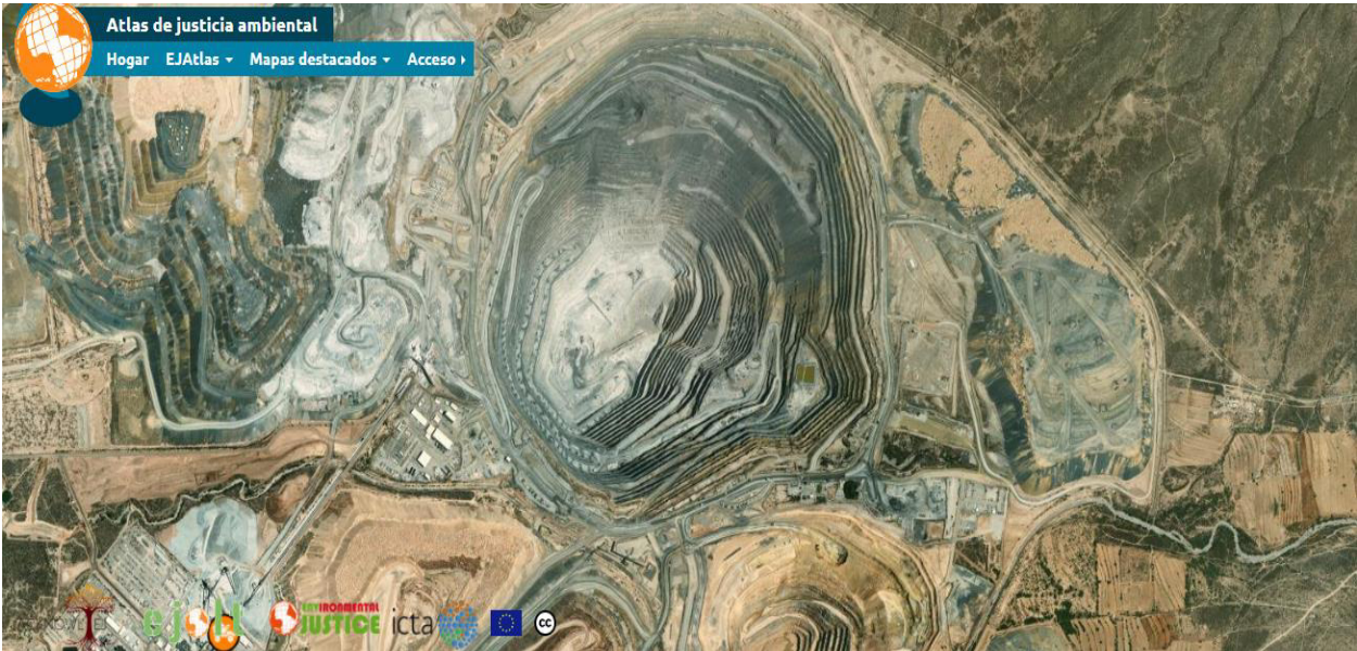
*Fotografías tomadas de la página digital EJ.Atlas https://ejatlas.org/conflict/penasquito