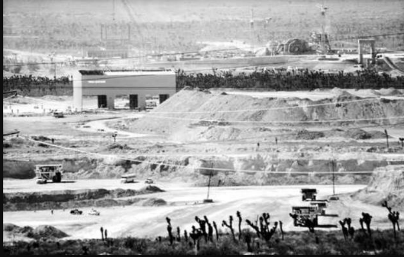
Mina Peñasquito antes de la llegada de Goldcorp