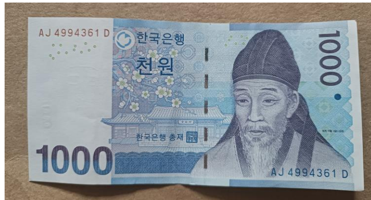
Imágenes de autor

efecto envolvente, para posteriormente mezclarlo con un sonido de ambiente de centro comercial, todo eso para crear la sensación de estar físicamente en la tienda.