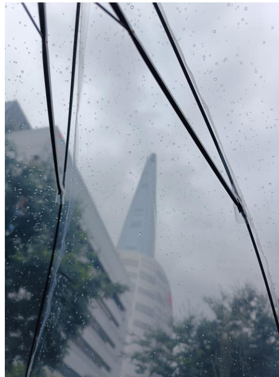
Imagen de autor