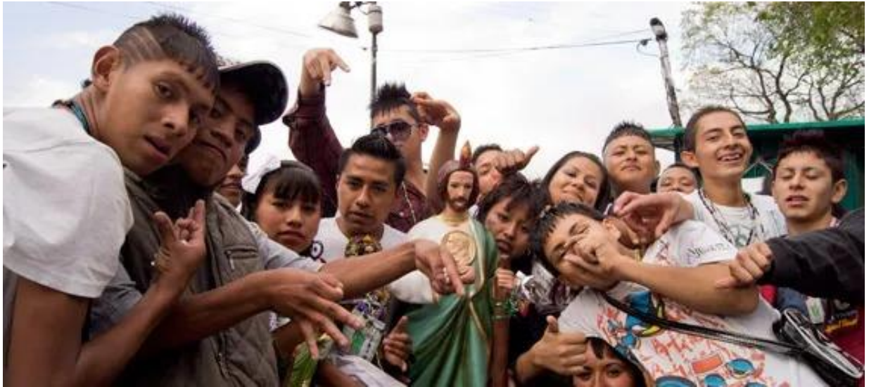
Vice México, 2016. Combos reguetoneros.