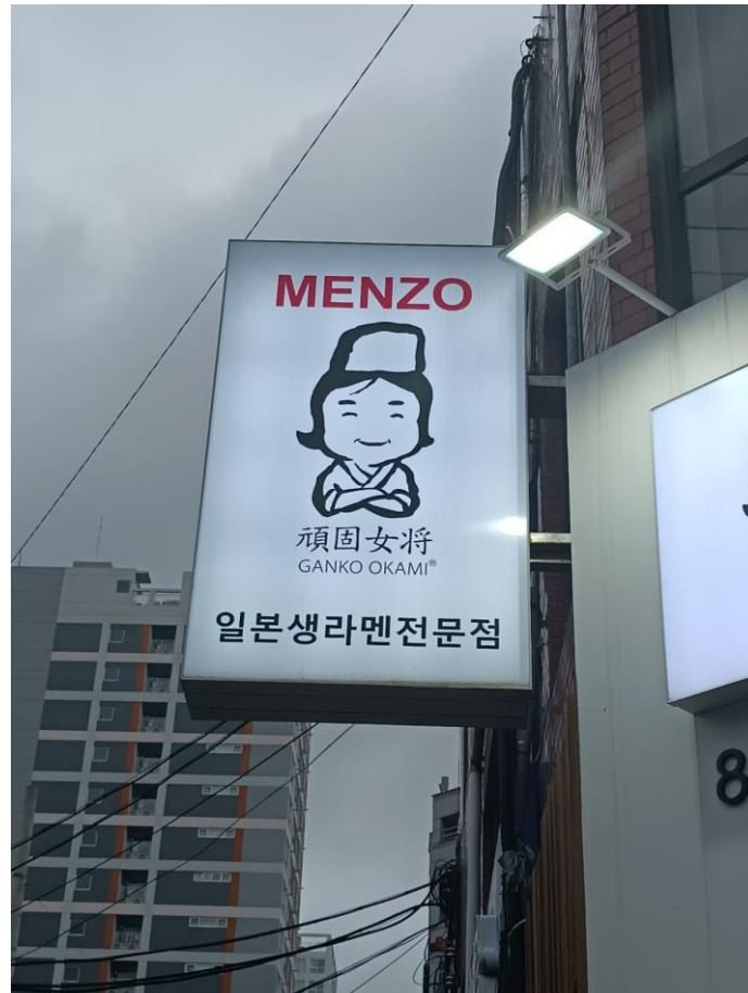
Imagen de autor