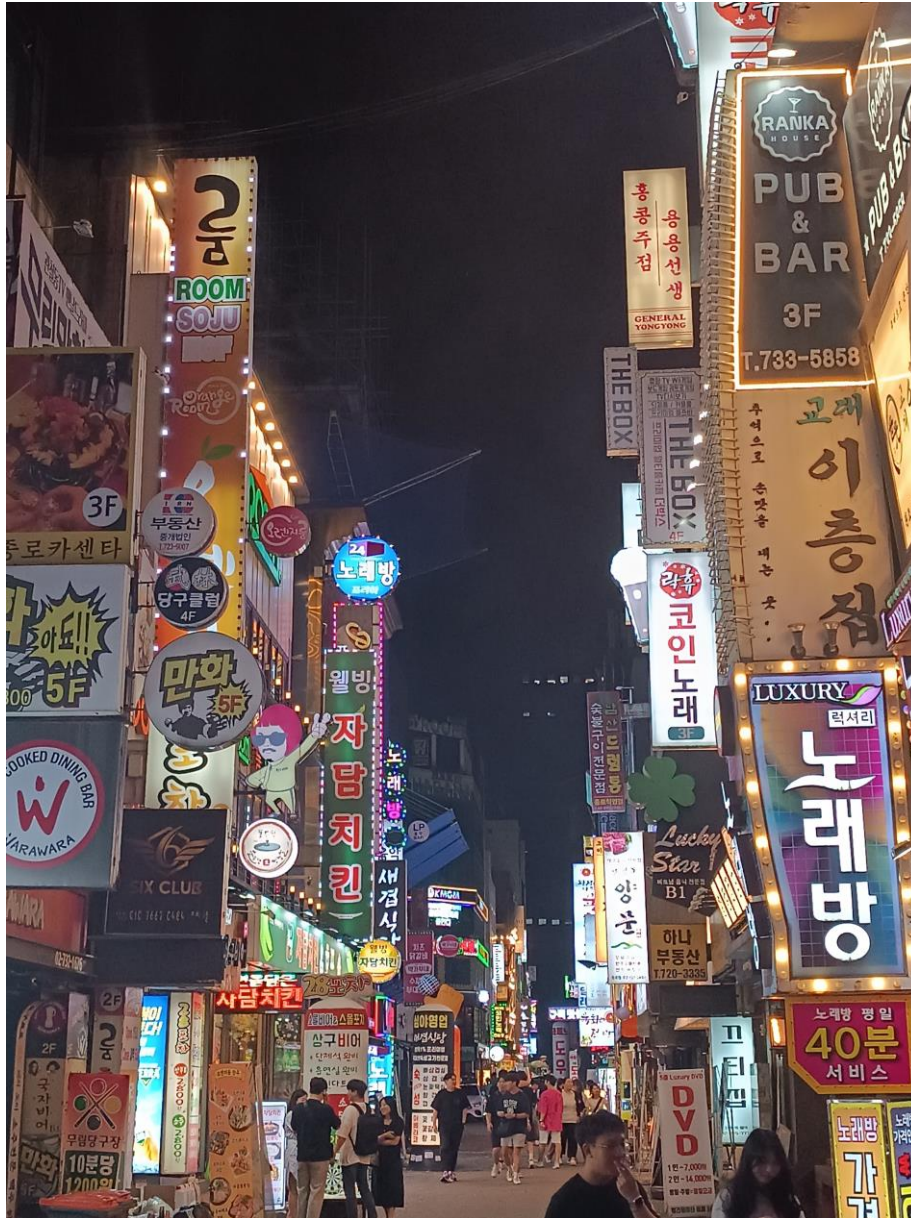
Imagen de autor