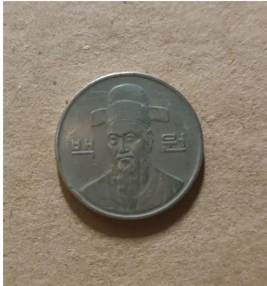
Imagen de autor