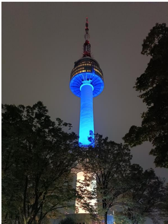
Imagen de autor

Para la producción de la cápsula en la locución utilicé un tono aún más sarcástico, en ocasiones cómico y tratando de sonar sorprendido en cada reseña de los lugares mencionados, para el fondeo de la cápsula utilicé los audios fail más virales que encontré disponibles a la fecha de elaboración de la misma, para resaltar aún más la sensación expectativa realidad que pasé mientras recorría los puntos que más me emocionaba conocer.