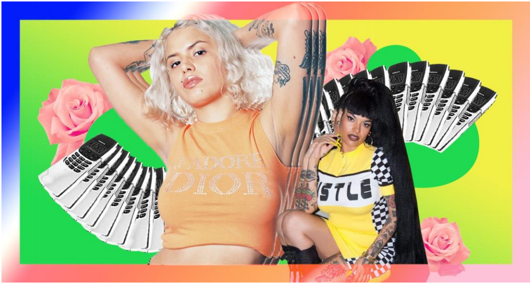
Remezcla, 2018. Neoperreo.