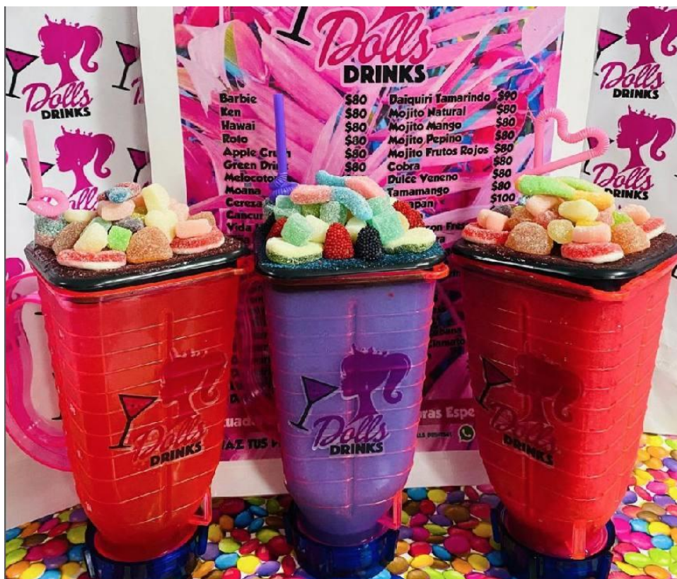
Imagen de autor

En la producción de este penúltimo episodio, ocupé nuevamente un tono casual, cómico y sarcástico en ocasiones para la locución, en esta ocasión para el fondo utilicé varias pistas musicales a volumen bajo para ejemplificar mejor las variantes de las que hablé durante este capítulo, lo mismo al momento de seleccionar las tres pistas que se escucharon durante esta emisión.