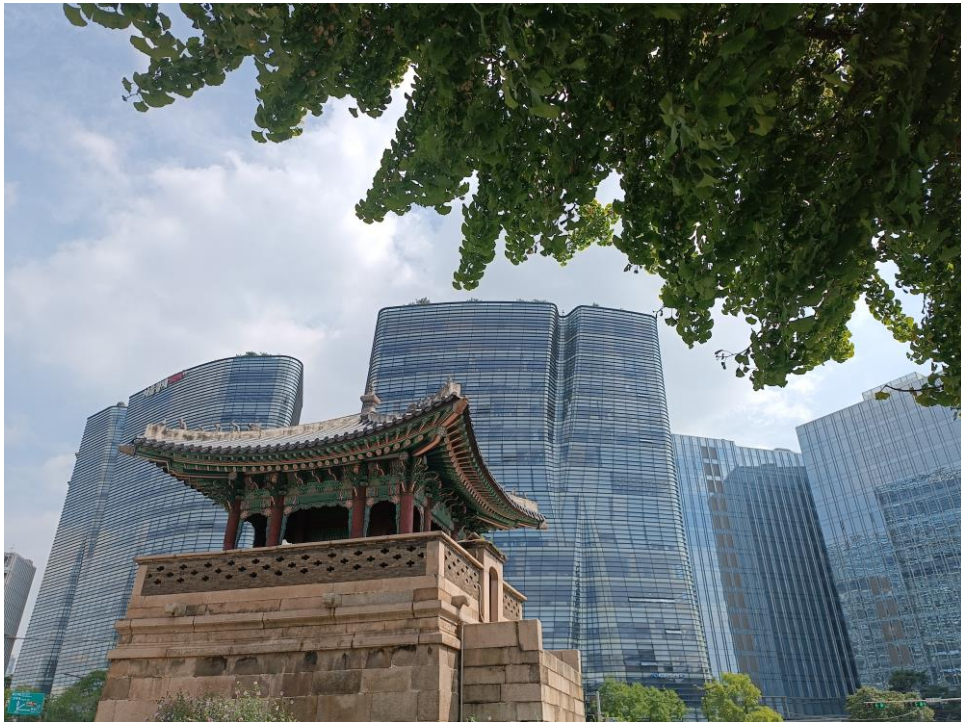
Imagen de autor