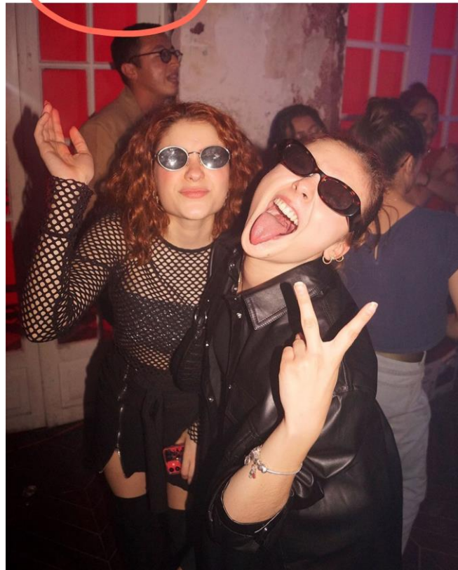
Salón Perreo Instagram, 2022.