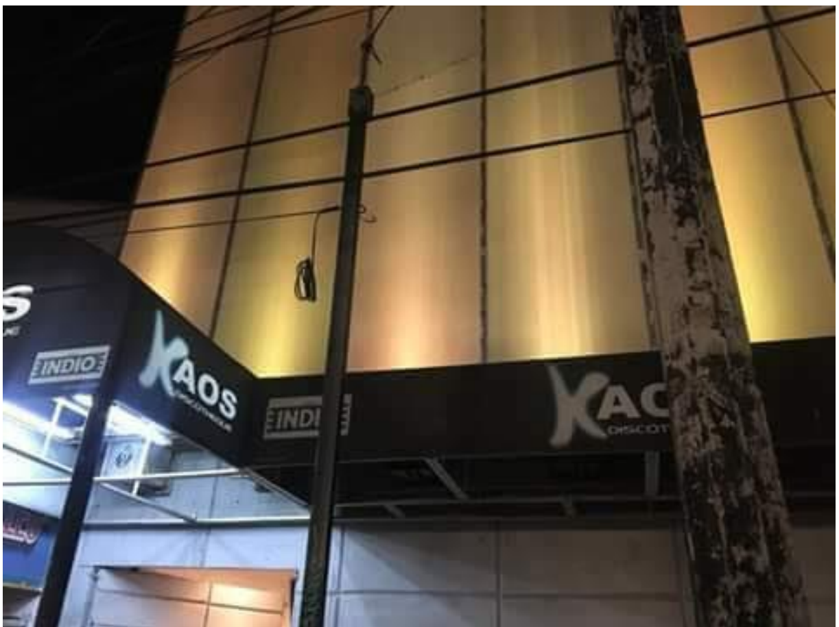
Imagen de autor