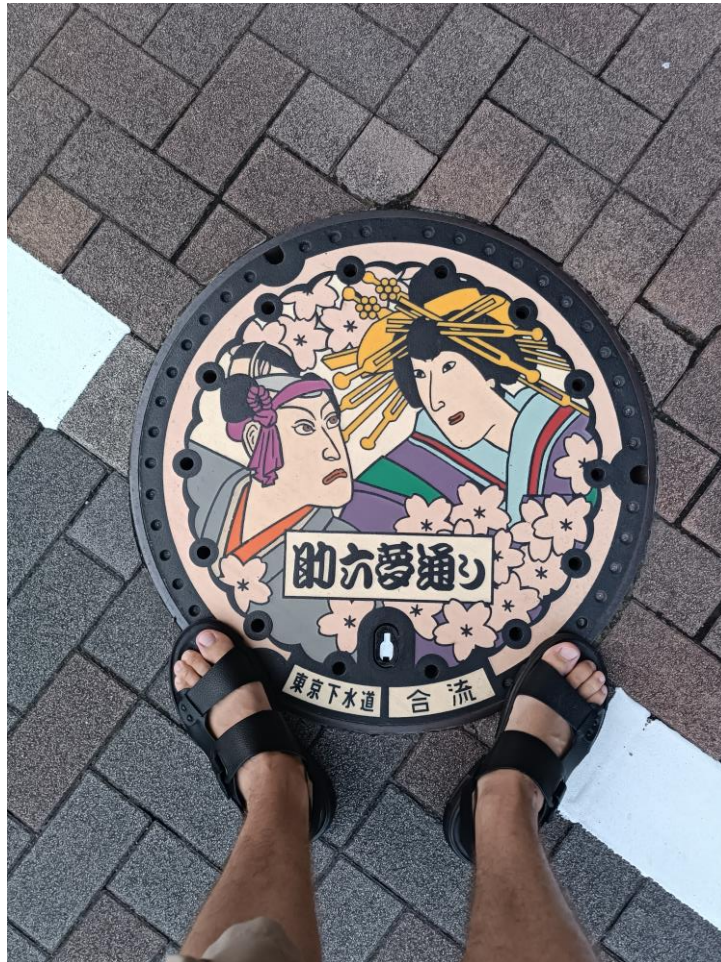
Imagen de autor