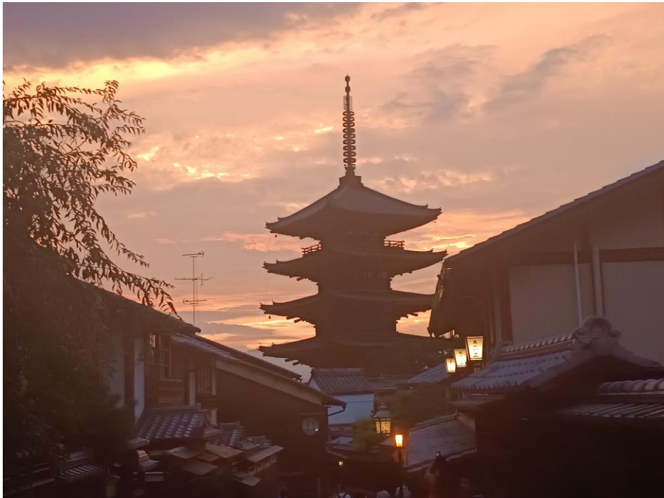
Imagen de autor