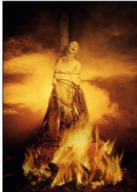
1893 Margarita Porete y 1898

solo a la palabra del ser supremo, sino del mismo hombre. En consecuencia, los procesos colonizadores, de Europa y posteriormente de América, el proceso de civilización del Nuevo Mundo, trajo al continente americano estas creencias y conductas, con la transmisión de esas prácticas del cristianismo y la idea de la sumisión de la mujer. Sin dejar de lado, la importancia que tuvo la Inquisición de París quemando a la mística Margarita Porete 19 en la hoguera, encendiendo “los primeros fuegos de un incendio que calcinaría toda la Europa de las brujas”, y con las dos imágenes –la de la virgen, la pura, la madre y compasiva frente a la de la bruja, la sexual, la escandalosa y libertina- que se construyó la profunda dicotomía en la mentalidad medieval sobre las mujeres y fue esta la herencia que llegaría hasta el “Nuevo Mundo” cuando se da el choque entre las dos civilizaciones que dan origen a la cultura mexicana.