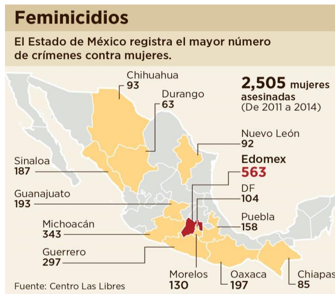
Tabla que retoma la información de la Asociación Civil “Las Libres”