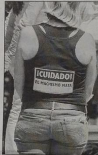
Una participante durante la marcha contra la violencia hacia las mujeres y el feminicidio en Chiapas, ayer en San Cristóbal de las Casas

“¿Qué sigue?, ¿a diario robos y asaltos?”, comentaron los vecinos. “Vivimos atracos a mano armada, robo de llantas, de autos; en las combis, seguido se suben a robar, ya de plano, con pistola en mano, se cometen delitos a plena luz del día”, relató una vecina, quien agregó que es tan