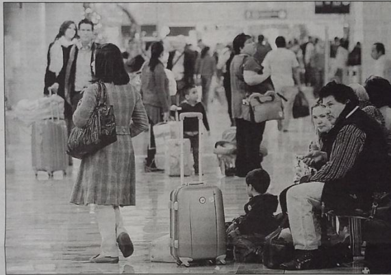
Pasajeros esperan abordar vuelos en el aeropuerto de la ciudad de México

De esta manera, el saldo de la balanza turística fue superavitario para México con 4 mil 765.7 millones de dólares, un aumento de 11 por ciento en comparación con 2012.