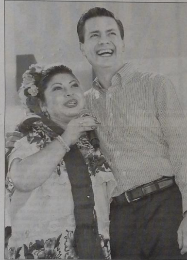
En la inauguración del Centro de Justicia para las Mujeres en Mérida, Yucatán, el presidente Enrique Peña Nieto aseguró que el gobierno de la República trabaja para formar una nueva cultura de la sociedad mexicana hacia la mujer, y en acciones y programas que realmente le ayuden y le beneficien

Como "mi esposa bien lo dijo: creo en la mujer, en su carácter, su decisión, su firmeza, en