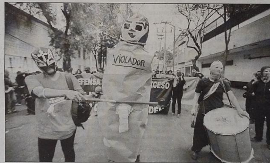
Unas cien personas participaron en la marcha en apoyo a la mujer violentada.

Según integrantes del Comité Ciudadano por la Liberación de Yakiri, ésta pidió ayuda al encargado del hotel y aun cuando estaba sangrando y sin ropa, no recibió apoyo.