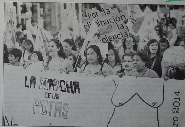
Aspecto de la marcha convocada por la red de mujeres feministas, en la que protestaron por la violencia que sufren las mujeres

Esa expresión ocasionó la indignación y miles de personas salieron a las calles para expresar su