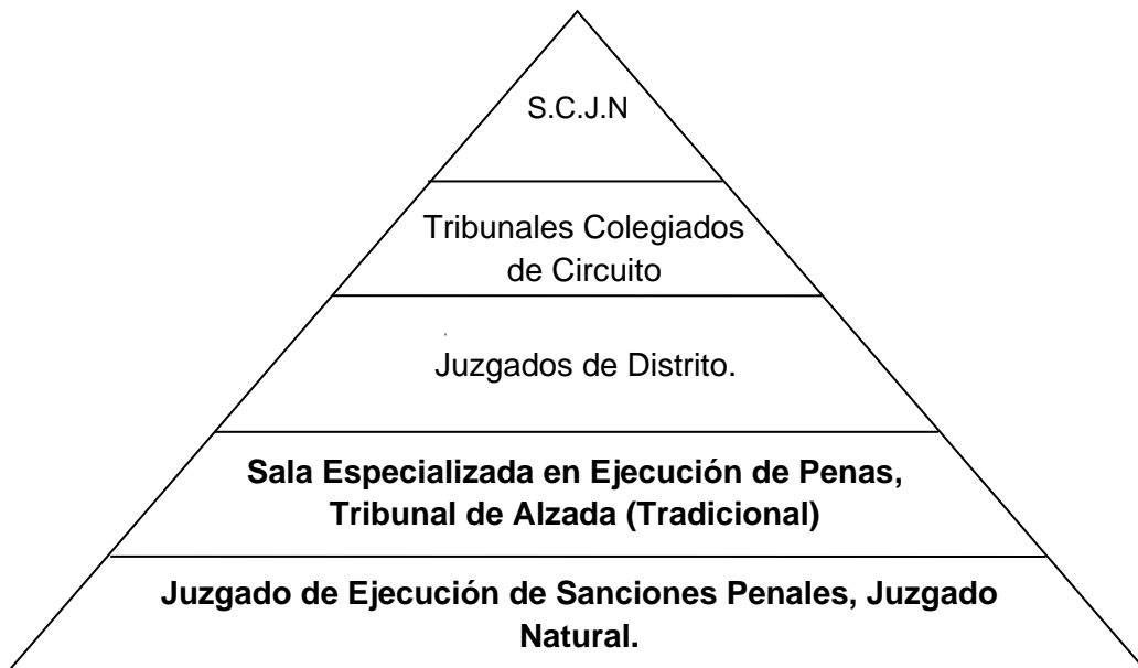
CUADRO 4. ESQUEMA DE JERARQUÍAS REFERENTE AL FUERO COMÚN

promociones las hace por propio derecho y ni hablar de abogado particular ya que por promoción causaría honorarios que se traduce en dinero en moneda nacional, por lo que sería muy difícil acceder a los recursos por los costos que implica, por lo que de acuerdo a la jerarquía de los Órganos jurisdiccionales, tomando en referencia la promoción hecha ante Juez de Primera Instancia, el gobernado tiene que ascender de tres a cuatro Órganos jurisdiccionales para poder acceder a una respuesta favorable a la controversia judicial planteada sobre traslación y adecuación de la pena, ya que los juzgadores adscritos al Tribunal Superior de Justicia de la Ciudad de México son omisos en el desempeño de sus funciones y facultades que la ley les confiere al momento de impartir justicia a los sentenciados, e incluso éstos gobernados pueden llegar hasta el quinto Órgano jurisdiccional que sin duda es nuestro más Alto Tribunal (S.C.J.N.), para que se le aplique un derecho a este ser humano el cual está protegido Constitucionalmente “el derecho a beneficiarse de la imposición de una pena más leve por disposición legal posterior”, para una mayor comprensión robustezco lo dicho con el siguiente esquema: