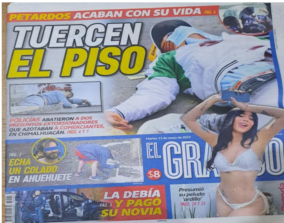
Imagen 1. Dos varones atacados por policas.