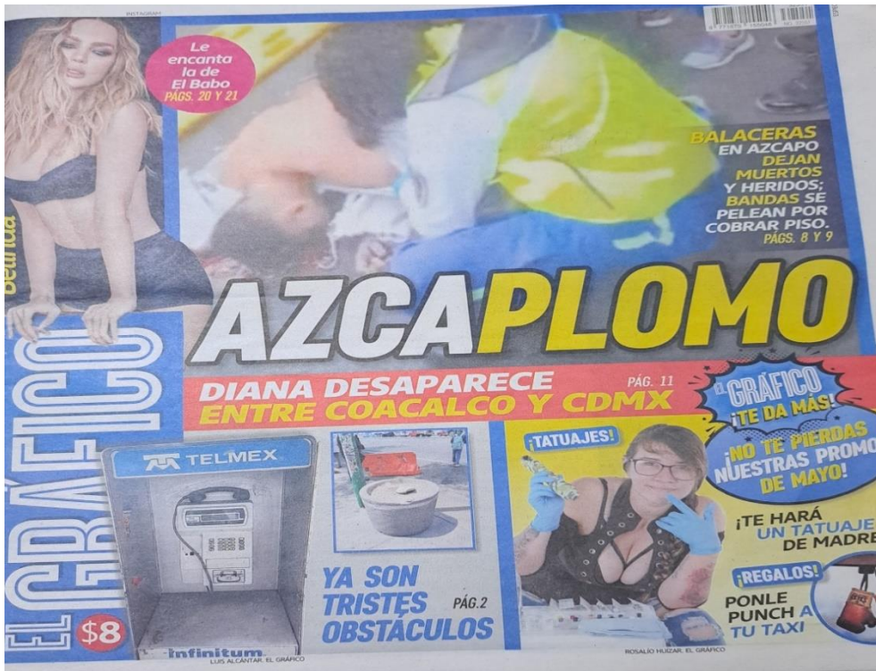
Imagen 2. Asesinado por cobradores de piso.