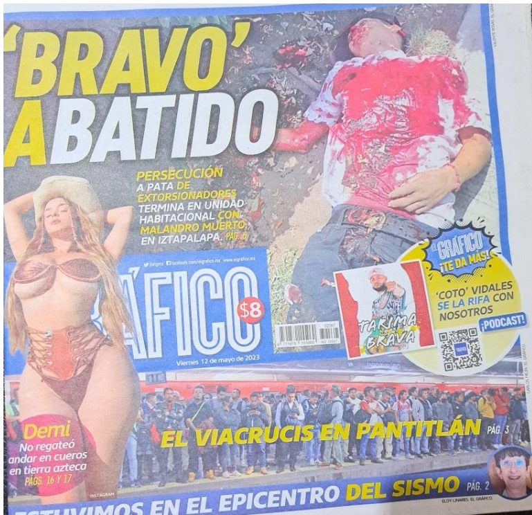
Imagen 3. Violencia en barrios populares de CDMX.