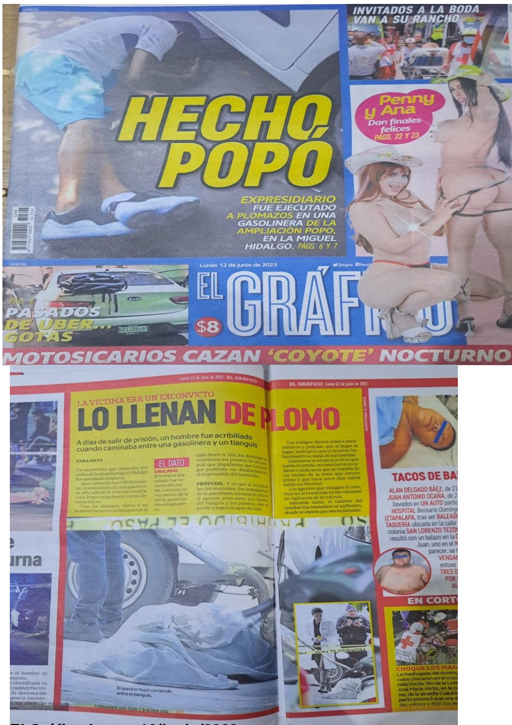
El Gráfico Lunes 12/junio/2023