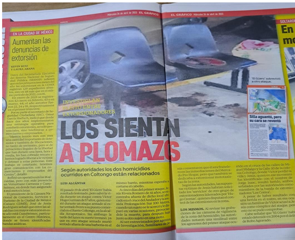
Miércoles 26 de abril 2023.