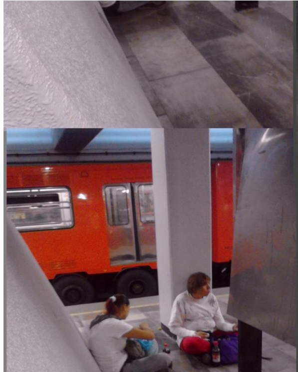
(Fotografía 9: “Un refrigerio”. Pasillos de línea uno. Autor: Ana Karen Martínez Rojas.)

Otra de las prácticas fue haber encontrado a una señora con su hija comiendo en el pasillo.