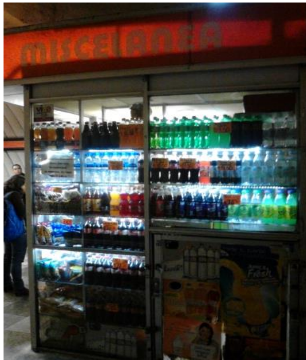
(Fotografía 24: “Colores , sabores”. Línea A. Autor: Ana Karen martínez Rojas )

Los usuarios circulan en diferentes direcciones pero también se detienen ya sea a comer en los puestos de tacos, en las tiendas de pan o en las tiendas de abarrotes que podemos ver en los pasillos de la estación Tacubaya y en otras más.