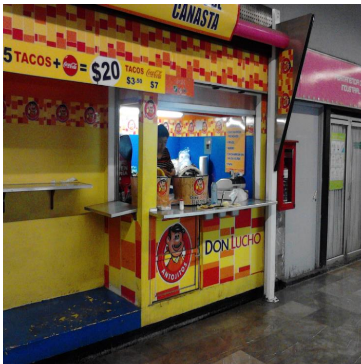
(Fotografía 10: “Comida rápida”. Estación Balderas línea 1. Autor: Ana Karen Martínez Rojas )