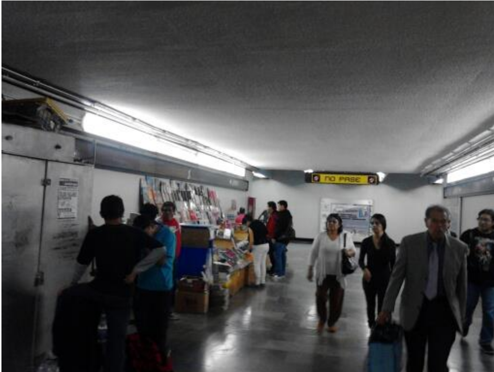
(Fotografía 3: “Adentrate en la lectura”. Pasillos de la estación Pantitlán. Autor: Ana Karen Martínez Rojas.

En los pasillos que día con día recorren los usuarios que se dirigen a esta línea, siempre escuchan el grito de vendedores, los cuales están fuera de las instalaciones del Metro pero están en las rejas que pertenecen al Metro y algunos gritos son de los que venden agua o donas colocan su agua embotellada dentro de los huecos de las rejas, cuando uno pasa se oye gritos como “Lleve su dona a 3 pesos” o desayunos a 10 pesos, “Aguas de a cinco pesos” “Tortas de 10” Mujeres y señores se detienen para comprar alguno de los productos.