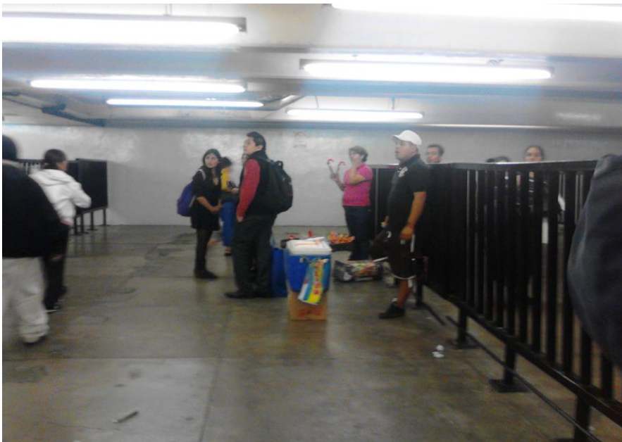
(Fotografía 2: “Refrescate con una congelada”. Pasillos de la estación Pantitlán.)

Para llegar a la línea 1, terminal Pantitlán, se transborda de la línea A y la línea 5, un aspecto relevante es que en esta Terminal se encuentra un paradero, por consiguiente suben más usuarios del estado de México, porque muchos de los pasajeros que vienen en el Mexibús entran al metro.