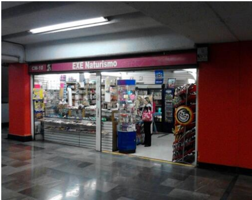
(Fotografía 14: “Sabores y olores”. Pasillo de línea café.

Línea 1, hora de inicio de la observación es a las 4:00 PM, me encuentro en el andén estoy en la estación Pantitlán no hay muchas personas en el andén por lo tanto subo inmediatamente al vagón. En seguida suben un vendedor ambulante en la estación Gómez Farias, subió una mujer, vendiendo 100 pastillas de listerine a 10 pesos La estación siguiente es Zaragoza sube una señora con su hija y trae a un bebé cargando, las mujeres y su hija tiene pintada la cara de payaso y una se ponen de un lado del vagón y las otra del otro así empiezan a gritar para contar chistes al termino de su presentación piden una ayuda económica. Después sube una persona invidente ofertaba discos musicales que eran canciones románticas y él lo título “Sólo para enamorados” él subió acompañado de un señora y ella era la que traía los discos y los entregaba a los usuarios que le compraban.