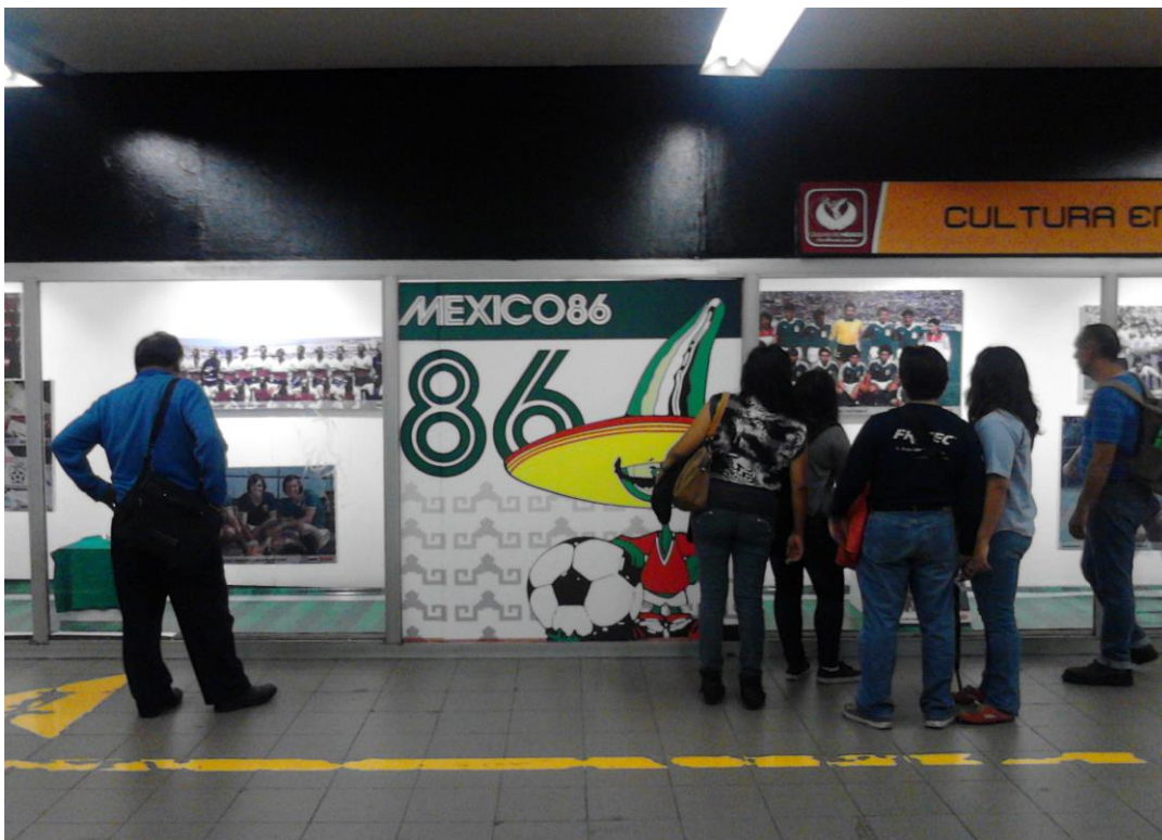
(Fotografía 15: “El mundial en México”. Pasillo de la estación Balderas.)

Con motivo del mundial, en las vitrinas que están en éste pasillo, están presentando toda una revelación del fútbol , de todas la edades se detienen a ver las fotografías que se presentan.