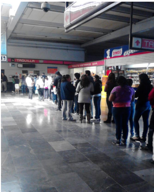
(Fotografía 4: “Fíla de boletos, debes esperar”. Estación Pantitlán. )

También se puede observar un Bimbo o un expendio de pan ahí pasan jóvenes a comprar pan y se lo llevan comiendo, por la tardes son señoras las que pasan y se llevan varios productos.