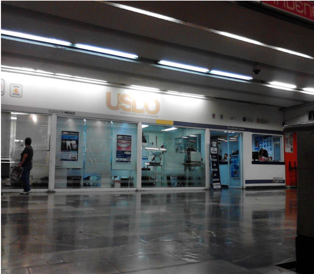
(Fotografía 13: “Salud y bienestar a los usuarios”. Pasillo línea café. Autor: Ana Karen Martínez Rojas)

En otros de los pasillo que va hacia la línea rosa esta una Unidad Médica y aun lado una Francia estos doctor hacen examen de la vista y se colocan en lo pasillos que van hacia la dirección rosa