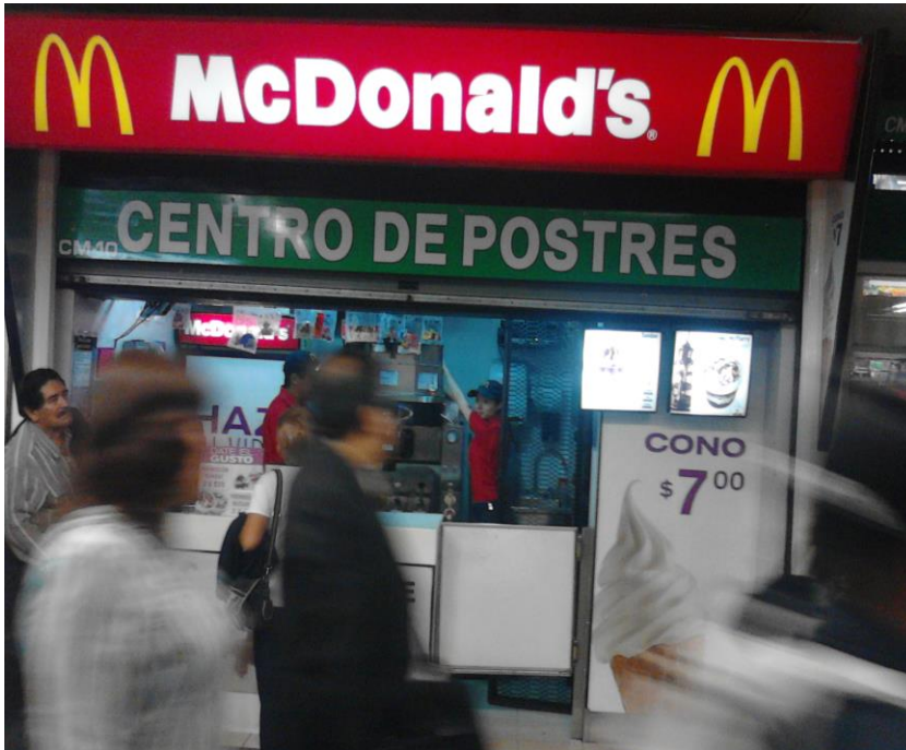
(Fotografía 12: "Helados McDonalds". Pasillos de estación Balderas. Autor : Ana Karen Martínez Rojas)

Siguiendo en los pasillos para la Línea café se sigue observando negocios de Telcel de igual forma de Productos naturista de libros, tiendas de botas y zapatos, de artículos para el hogar y de dulces productos de 3.50 como pasadores, ligas, donas par cabello etcétera.