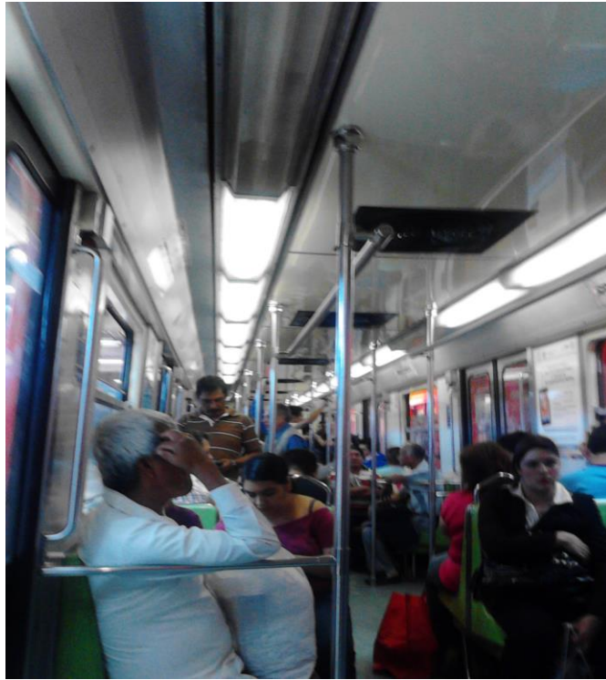
(Fotografía 23: “Pasividad”. Dentro del vagón línea café.).

Los usuarios conocen los horarios, los tiempos, los espacios, las personas, cada una de las diferentes situaciones que se enfrentan cuando usan el Sistema de Transporte desde los que saben donde colocarse para no ser molestado o no recibir empujones hasta los que se ven muy diferentes en su forma de vestir o actuar . En el Metro se observan diferentes usuarios de diferentes sexos, edades, personas solas, en pareja o en grupos, que desarrollan actividades diversas, dinámicas y pasivas.