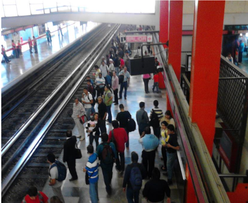
(Fotografía 22: “La gran espera”. Estación Observatorio. Autor : Ana Karen Martínez Rojas).

Por las mañanas y tardes son los momentos del día en que se concentra los tumultos esto implica la utilización de espacios donde se producen encuentros entre usuarios y actividades, siendo el metro un lugar de uso intenso donde los usuarios llenan todos los espacios en el metro, generando diferentes sensaciones visuales, olfativas, específicamente en las horas pico, la aglomeración de usuarios en los andenes y al interior de los vagones se transforma en molesta por el problema de incomodidad, por tal motivo varios usuarios implementan varias estrategias como caminar hacia los pasillos del vagón, es decir cada usuario intenta encontrar o buscar un lugar para evitar el contacto con lo otros.