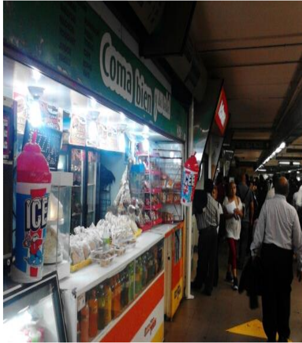
(Fotografía 23: “Antojos”. Pasillo estación Balderas. Autor: Ana Karen Martínez Rojas)

Los usuarios circulan en diferentes direcciones pero también se detienen ya sea a comer en los puestos de tacos, en las tiendas de pan o en las tiendas de abarrotes que podemos ver en los pasillos de la estación Tacubaya y en otras más.