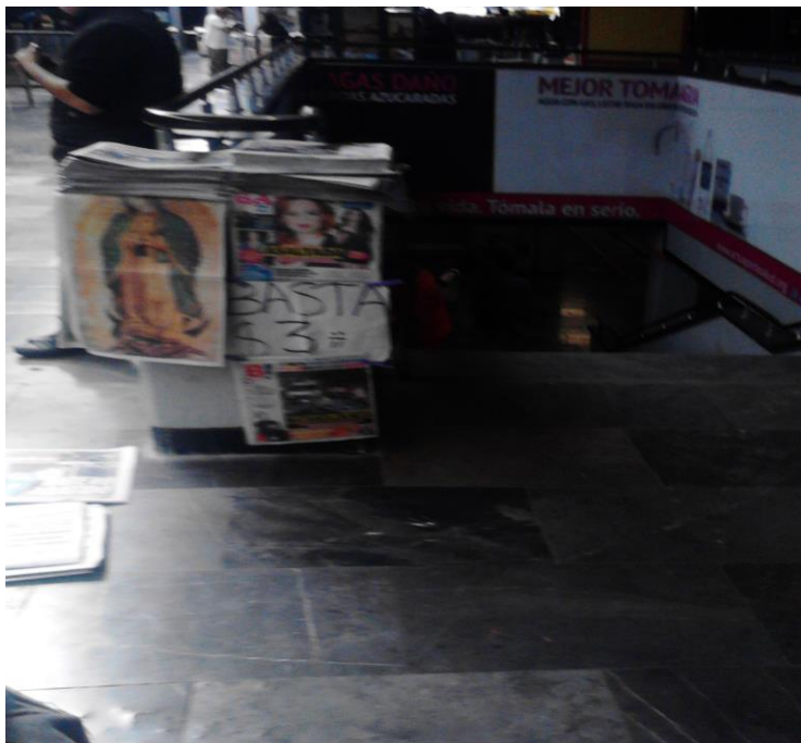
(Fotografía 18: “Periódico Basta”. Terminal Pantitlán. Autor : Ana Karen Martínez Rojas).

La siguiente estación es Observatorio, es la terminal poniente de esta línea, localizada en la delegación Álvaro Obregón.