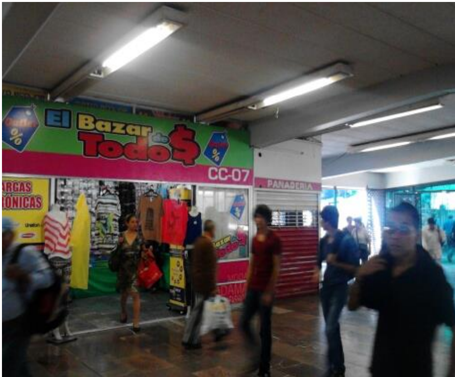
(Fotografía 1: “Ropa para toda la familia”. Estación observatorio. )

Los usuarios en cuanto suben las escaleras, se encuentran un pasillo que va hacia las diferentes direcciones como la línea 9,1 y 5. En el pasillo se encuentra un tumulto de personas comprando pan de Pan titlán, se oye “qué le voy a dar ¡ un café! Un dona qué va a lleva” En el cruce que se hace de la línea A, la rosa, se ve mucha gente parada porque están entrando a los baños se escucha una alarma que es la que te permite el acceso. Gente esperando o consiguiendo cambio para poder entrar a los sanitarios.