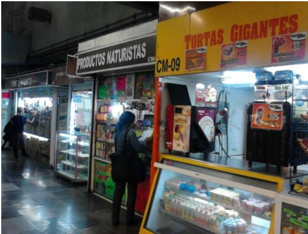
(Fotografía 19: “Delicias y gustos”. Pasillo estación Balderas. Autor: Ana Karen Martínez Rojas).

Los comercios formales que se observa en esta línea se encuentra un Expendio de Bimbo y uno de Productos Naturista.