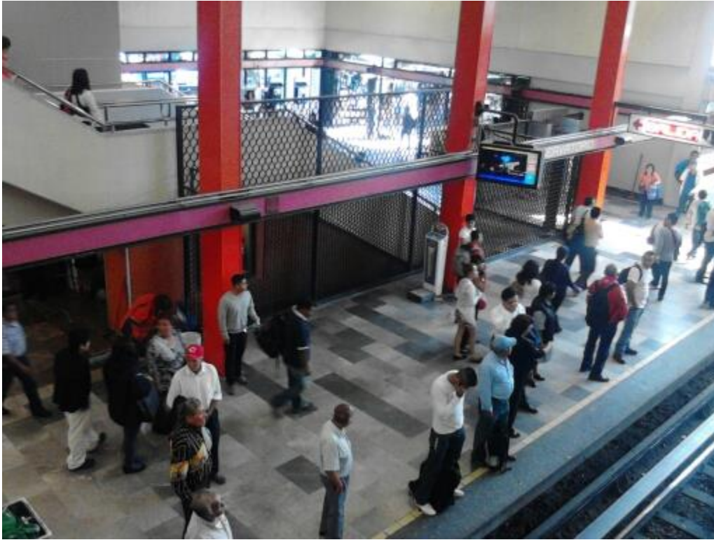
(Fotografía 7: “Esperando el tren”. Estación observatorio.)

Otras señoras que van de vestir o también que van de ropa casual son las que se ponen en la entrada de la puerta del Metro para poder ganar un asiento, en cuanto llega el Metro, las señoras con tal de ganar un asiento abren las puertas y se empiezan a meter hay algunos usuarios que se quedan dormidos y es cuando los policías los despiertan o las misma gente los mueven y estos usuarios salen corriendo antes de que se cierren las puertas.