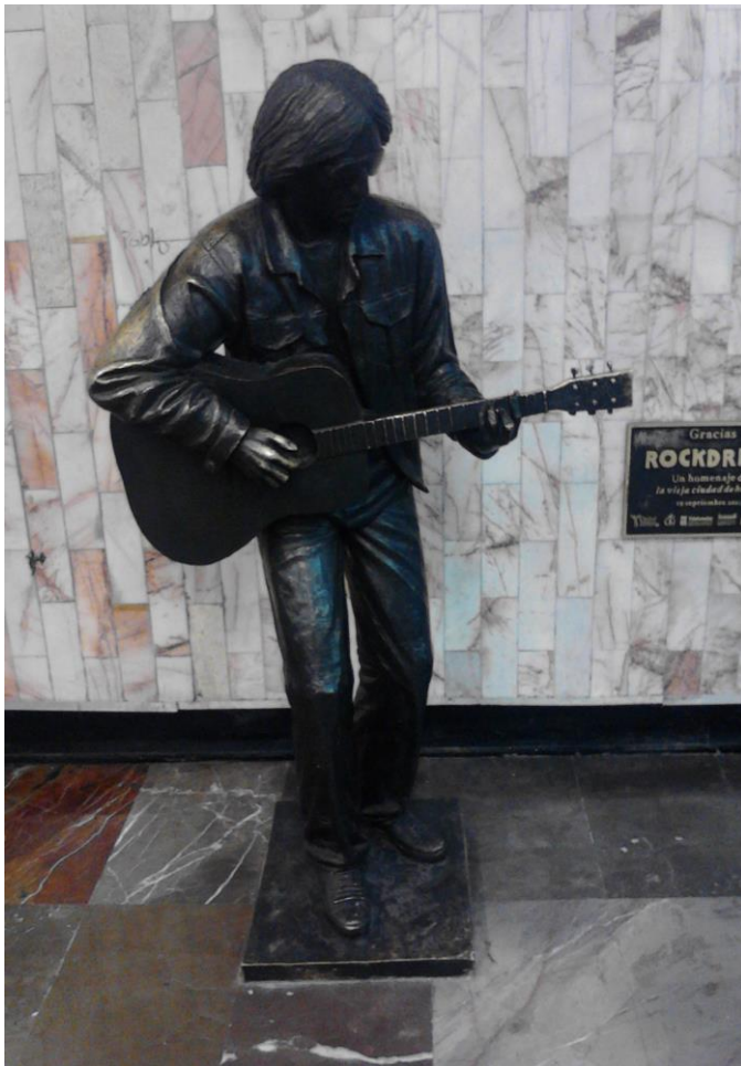
( Fotografía 16: “Rock en el Metro”. Pasillo estación Balderas.)