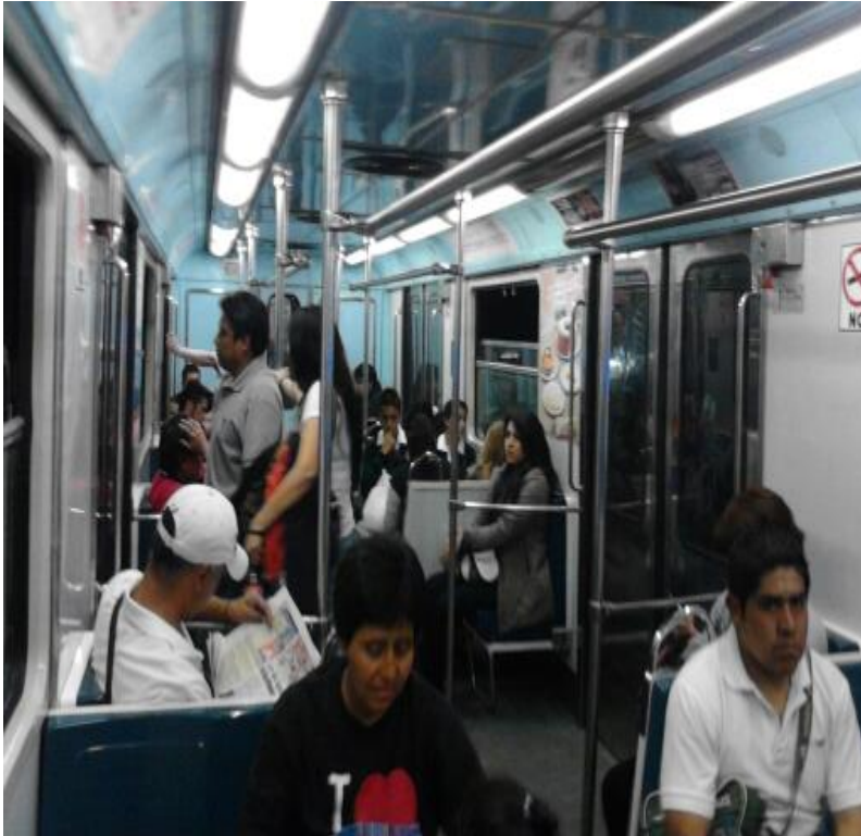
(Fotografía 11: “Paciencia en tu recorrido”. Dentro del vagón línea 1. Autor Ana Karen Martínez Rojas.)

En el metro, los vagones constituyen uno de los espacios sociales, porque es el lugar ideal para observar el cúmulo de usos, valores culturales, expresiones colectivas y fenómenos sociales, interacciones en mayor o menor medida con diferentes personas, para determinar los tipos de usuarios; por tal motivo se hace una observación de la línea 9, línea 1 y línea A de todas las estaciones que corresponde a cada una de éstas permaneciendo en un vagón desde el inicio y final de la estación.