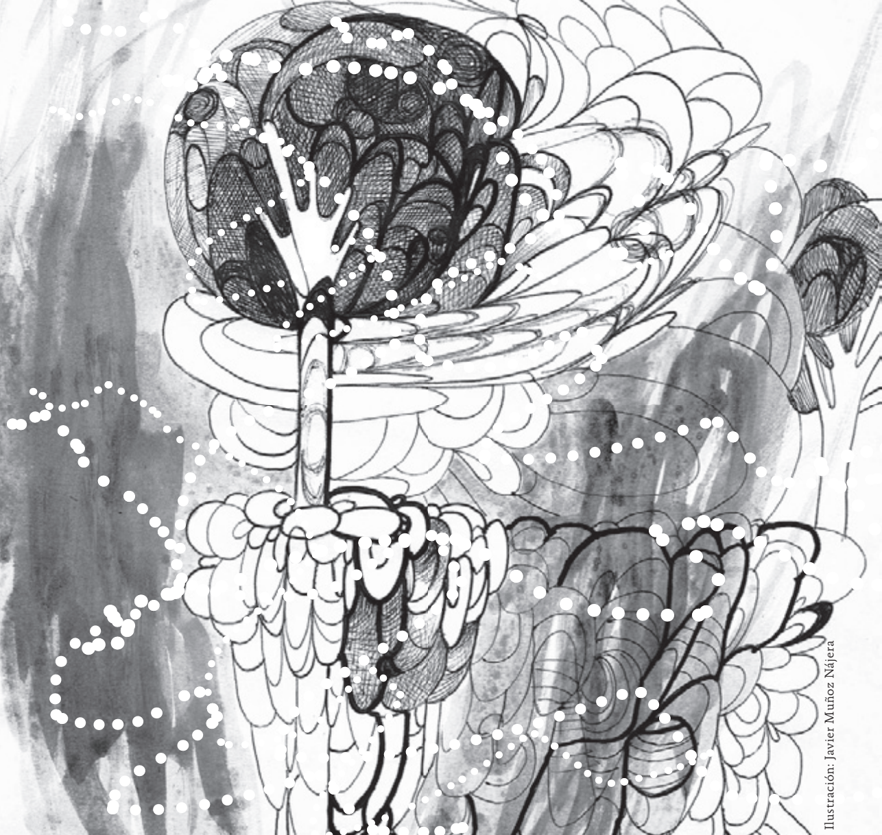
Ilustración: Javier Muñoz Nájera