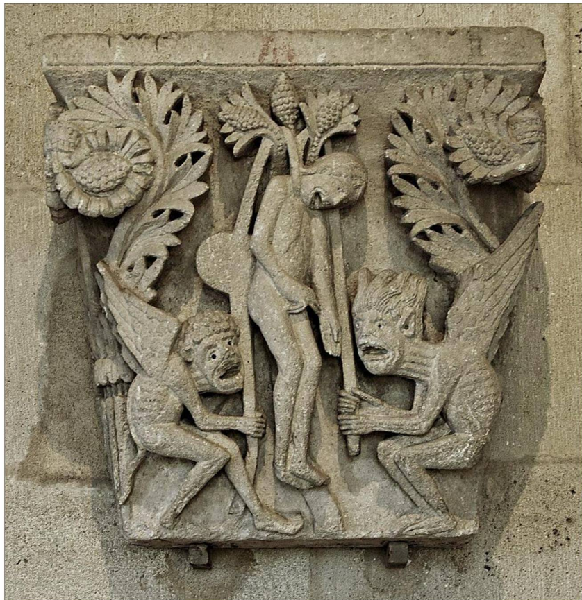
El ahorcamiento de Judas. Relieve en piedra. Año 1120. Catedral de San Lázaro. Francia.