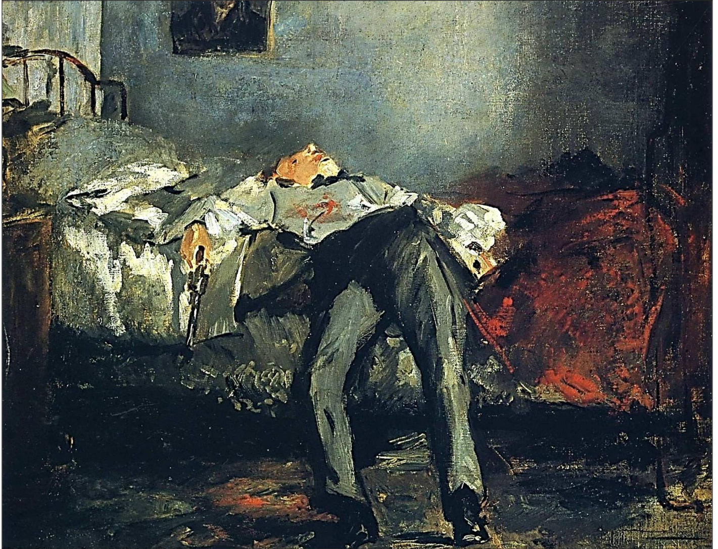
Édouard Manet. Le suicidé . 1877.