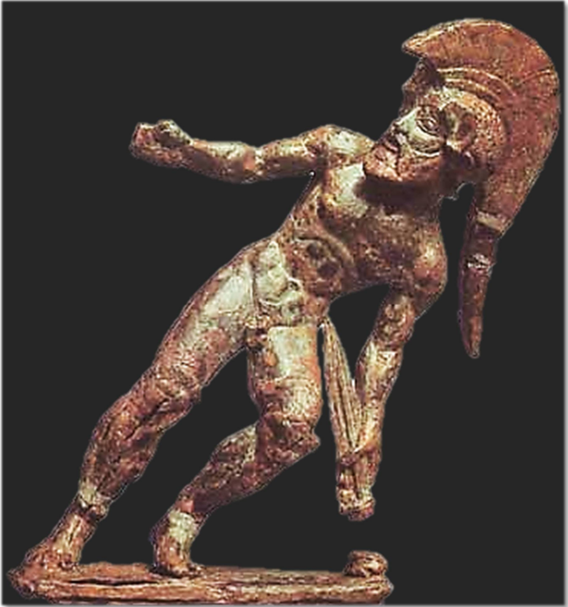
Ájax. Estatuilla en bronce. Siglo V. a.C. Museo arqueológico. Florencia.