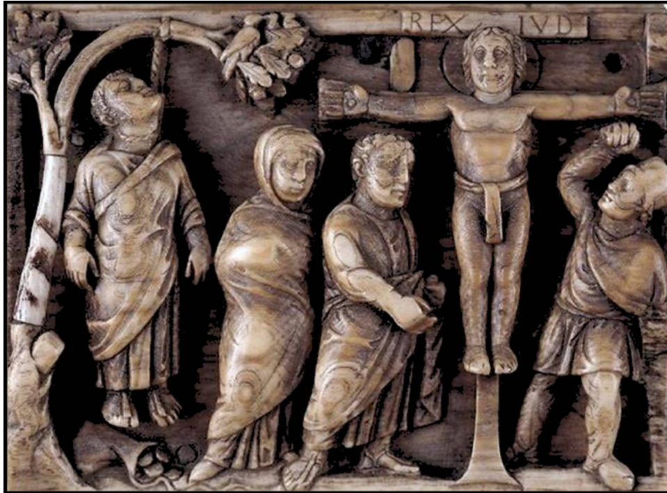
La muerte de Judas y Jesús. Detalle en marfil. Inicios del siglo V. d.C. British Museum. Londres.