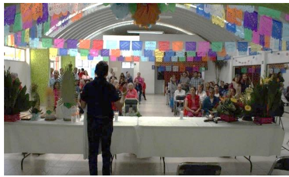
Imagen 8 Salón de usos múltiples, Aniversario, 2019

En la foto de abajo se muestra el salón de usos múltiples desde afuera. Con el paso de los años ha ido cambiando, por ejemplo, se hizo una extensión del salón entre los años dos mil cinco y dos mil diez, la cual es la parte pintada de anaranjado empezando desde la puerta blanca de lado derecho de la foto. Y justo en la extensión es donde tomaron las fotos de arriba, adentro del salón.