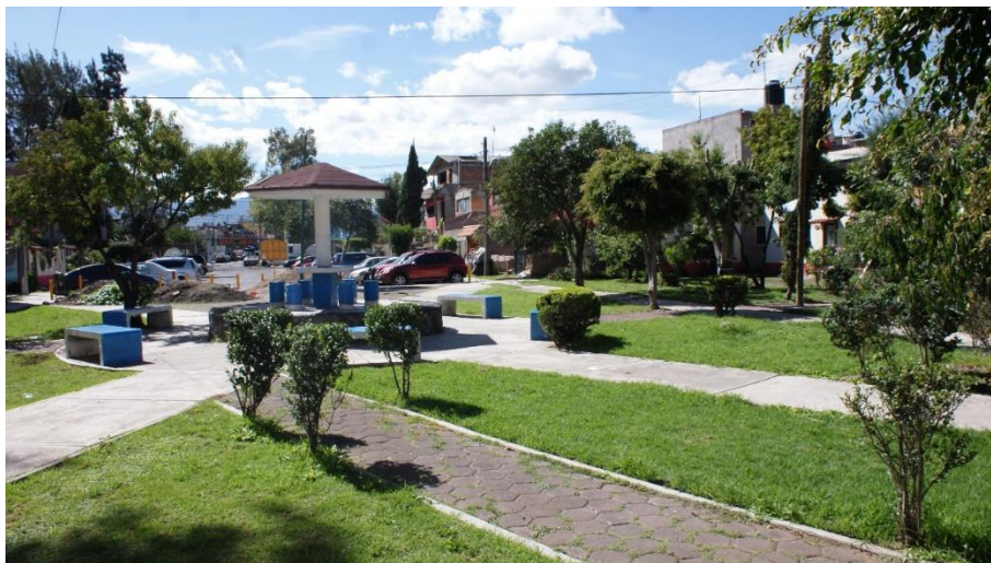
Imagen 14 Quiosco bloque A, Archivo personal, 2018.

La foto de arriba (Imagen 13) está tomada desde encima de la resbaladilla del bloque C, aquí se observa el quiosco, unos columpios, aros metálicos para escalar, en la palapa de forma de sombrilla se sientan las personas si es que hay junta o se sientan solo para pasar un rato agradable. La foto de abajo es del quiosco del bloque A. Se puede observar la misma estructura de sombrilla del quiosco del bloque C, y en esta foto se pueden ver caminos de cemento por los cuales se atraviesa el quiosco.