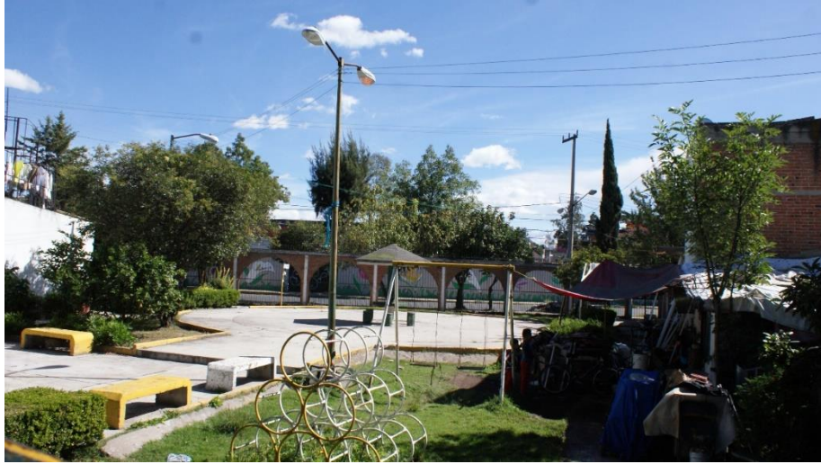
Imagen 13 Quiosco, 2018

La foto de arriba (Imagen 13) está tomada desde encima de la resbaladilla del bloque C, aquí se observa el quiosco, unos columpios, aros metálicos para escalar, en la palapa de forma de sombrilla se sientan las personas si es que hay junta o se sientan solo para pasar un rato agradable. La foto de abajo es del quiosco del bloque A. Se puede observar la misma estructura de sombrilla del quiosco del bloque C, y en esta foto se pueden ver caminos de cemento por los cuales se atraviesa el quiosco.