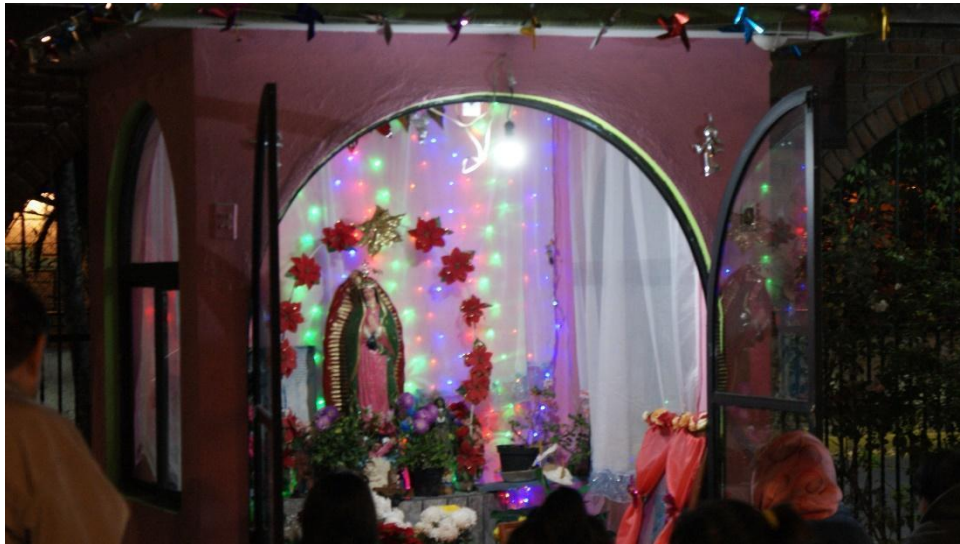
Imagen 5 Virgen del Bloque C, 2019

El 12 de diciembre no está organizado por el consejo Administrativo, la gente se organiza en cada bloque y se le festeja a la virgencita, ni siquiera las representantes del bloque intervienen para organizar. En el festejo dan tamales y café, se le reza a la virgen 9 u 8 días antes y el 11 se vuelve a rezar; se comparte comida, se avientan cohetes, y se le cantan las mañanitas a las 12 de la noche. Años pasados se contrataba un sonido y a veces venían los chinelos (gente con traje y máscaras que bailan) a ofrecer espectáculo. Luego vienen, luego no. En las imágenes de abajo se muestra la capilla de la virgen, la cual se abre el 12 de diciembre, para darle rezos. 129