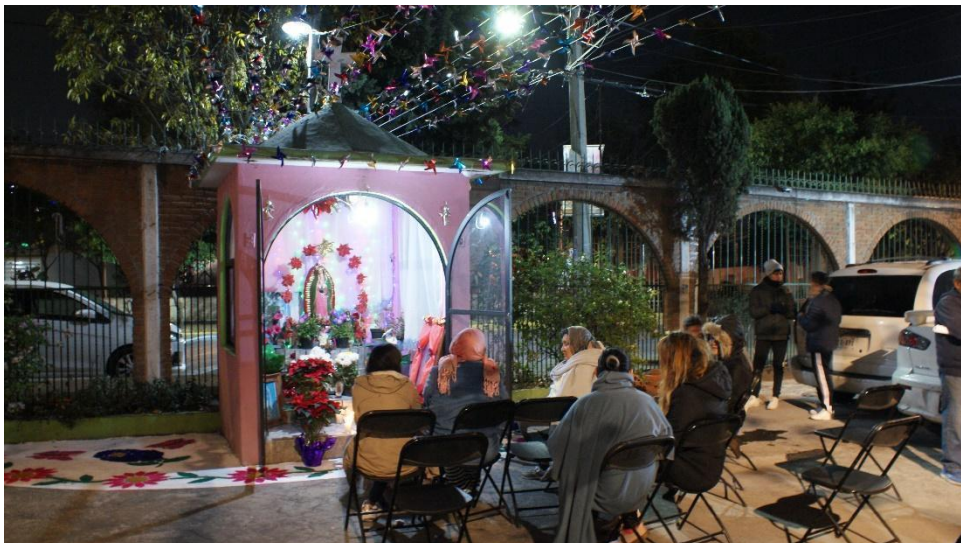
Imagen 6 Virgen del Bloque C, Archivo Personal, 2019