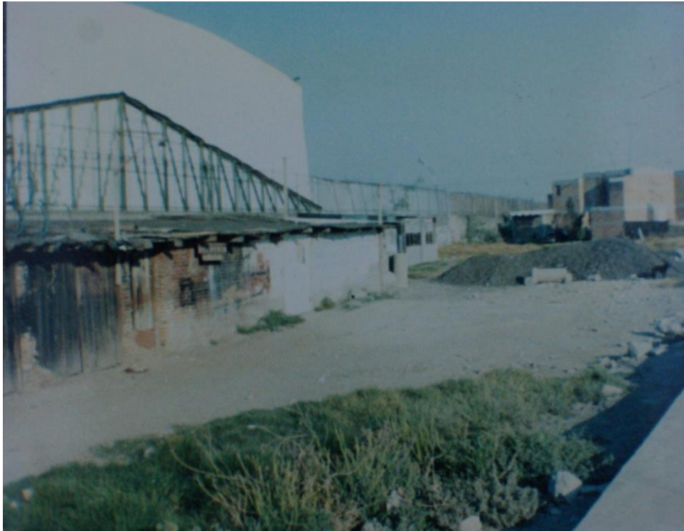
Imagen 1 Extraída del archivo de Daniel Mejía S/F.

observan esos cuartos. El lugar de la foto es el mismo que se mostrara más adelante en otras fotos cuando se hable del salón de usos múltiples, ya que estos cuartos se usaban como oficinas y como se dijo arriba como dormitorio de los albañiles al inicio de la cooperativa. En la foto todavía no estaba construido el salón de usos múltiples, El salón se empezó a construir en los años noventa del siglo pasado.