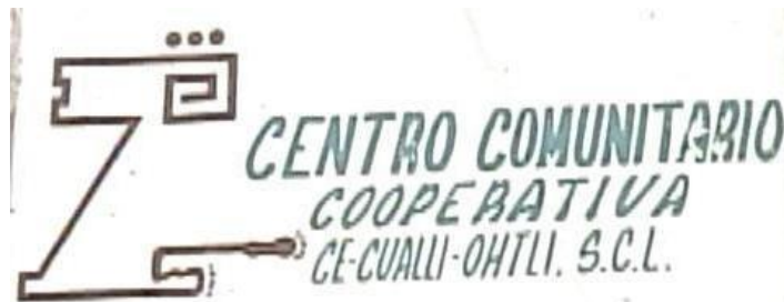
Imagen 9

Enciso); entonces ahí empezó el problema porque el FONHAPO solicitó que este grupo se constituyera. Primero se llamaba “La comuna de Santo Domingo”, así se nombraba a este grupo de solicitantes de vivienda. Así se nombra en un principio, entonces éramos de Santo Domingo, pero cuando el FONHAPO solicitó que este grupo se debía constituir, ya sea, en asociación civil o Cooperativa. Y entonces la mayoría o los que estaban pues dijimos, sin conocimiento de nada, ¿qué es una cooperativa? ¿qué nos conviene? o sea nada (no sabíamos), queríamos un terreno y no nos importaba cómo. Sin ningún conocimiento de nada, decidimos que fuera cooperativa. Pero se necesitaban tres nombres para solicitarla ante relaciones exteriores. Y se sacaron tres, el primero fue CE Cualli Ohtli y se mandaron otros dos, y el que quedó fue Ce Cualli Ohtli. Es náhuatl, según significa “un buen camino”... entonces Relaciones aceptó esos tres nombres, los tres eran náhuatl.” 44