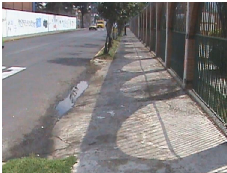
Imagen 3 barda y rejas perimetrales.

Atrás y al lado izquierdo cuenta con una barda perimetral de piedra volcánica, de aproximadamente dos metros y medio de altura, la cual carga con una rejas y mallas de fierro con un aproximado de dos metros de altura, con que separa los límites del centro gallego y Ce Cualli Ohtli. 26