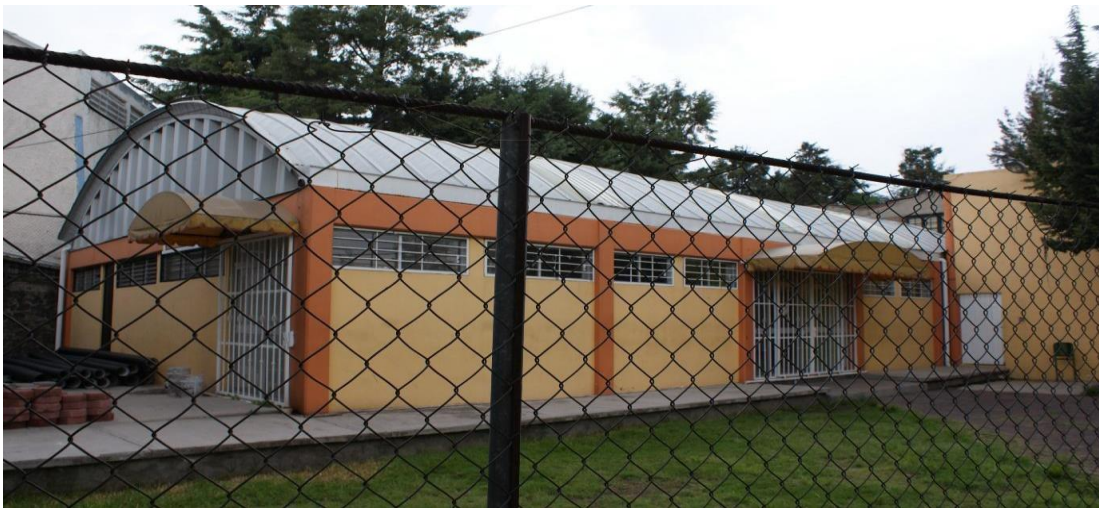
Imagen 9 Salón de usos múltiples, Aniversario, Archivo personal, 2019

En la foto de abajo se muestra el salón de usos múltiples desde afuera. Con el paso de los años ha ido cambiando, por ejemplo, se hizo una extensión del salón entre los años dos mil cinco y dos mil diez, la cual es la parte pintada de anaranjado empezando desde la puerta blanca de lado derecho de la foto. Y justo en la extensión es donde tomaron las fotos de arriba, adentro del salón.