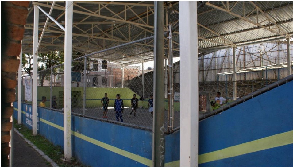
Imagen 12 Cancha Multifuncional, Archivo Propio, 2019.

Es así que el lugar ha ido cambiando a través del tiempo, se ido modificando y resignificando, lo que antes significaba empleo, ahora significa deporte y actividad. Y se ha ido construyendo a lo largo del tiempo. No deja de construirse pues la misma gente resignifica los espacios. Como ahora es deporte mañana puede ser comercio u oficinas.