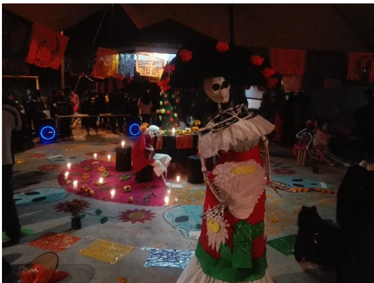
Imagen 4, Ofrenda, 2018

Otra festividad que se celebra es el Día de muertos, que se organiza de igual forma que el día de niño. El consejo Administrativo hace propuestas, se organiza, señala el día, da un presupuesto y las representantes de bloques dan la información a los vecinos del Bloque. Los del Bloque se organizan y dan su aportación. En algunos casos se ponen de acuerdo con otras organizaciones como Cananea o USCOVI para dar un recorrido por las unidades visitando las ofrendas que se hicieron en las organizaciones.