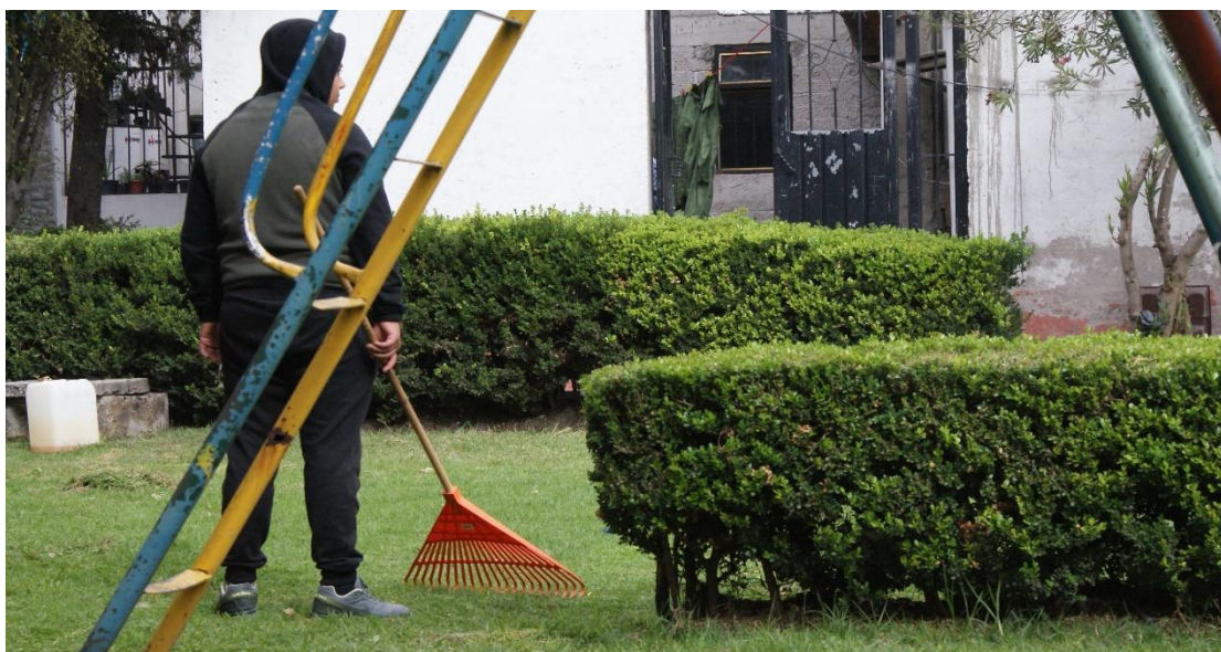
Imagen 2 Faena, Archivo Propio, 2019