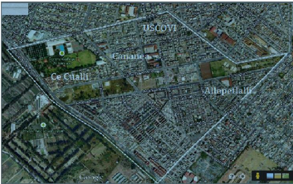
Imagen 1 Mapa elaborado por Fermiza, M. P. (29-30 de noviembre de 2007). Presentación El Molino . México.

“también conocida como San Nicolás Buenavista, antes de ser fraccionada en lotes urbanos y ranchos lecheros, era una de las más antiguas del país. Fue creada en 1662 y llegó a contar en 1908 con 2659 hectáreas. Alrededor de 1910 fue vendida a una compañía deslindadora que vendió diversas acciones en las que se crearon ranchos lecheros y cerealeros que, por tener extensiones inferiores a 250 hectáreas, resultaron inafectables una vez promulgada la reforma agraria”. 24