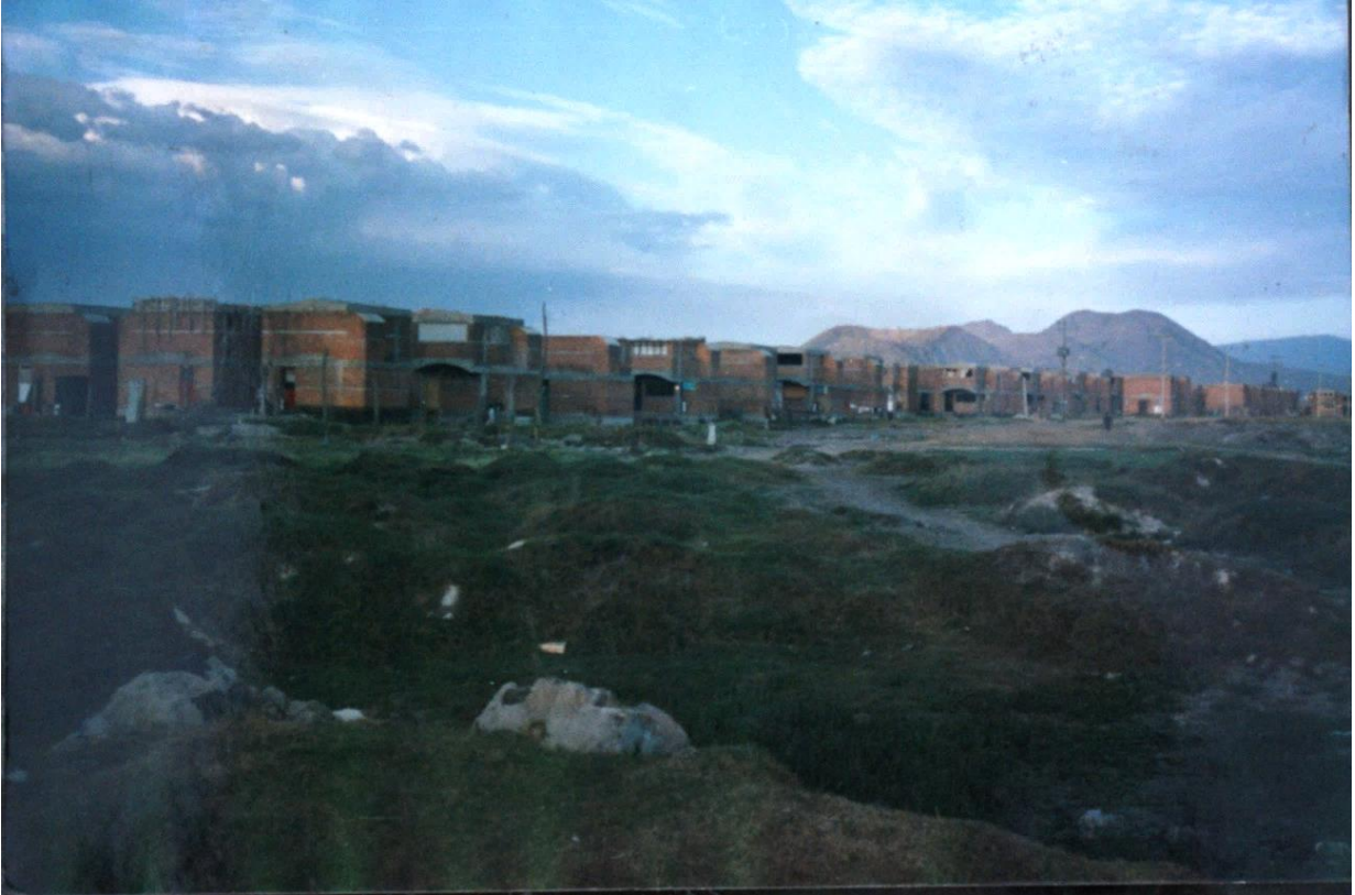
Imagen 4 Imagen recuperada del archivo de Daniel Mejía. S/F.

“Los Panchos” hicieron huelga para que dejaran ese espacio como una escuela. Entonces surgió la primaria Centauro del Norte, la cual se ubica en la calle Macahuite enfrente de Ce Cualli Ohtli.