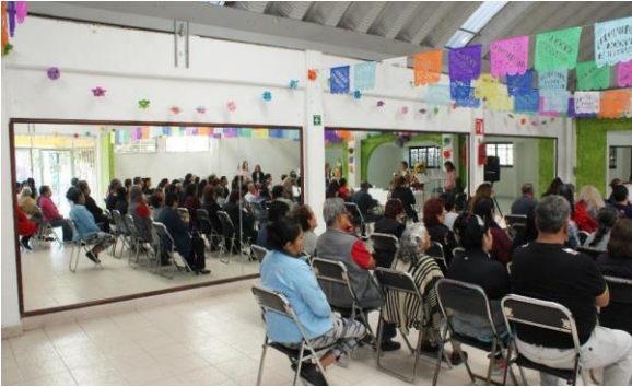
Imagen 7 Salón de usos múltiples, Aniversario, Archivo personal, 2019

A continuación, unas imágenes del espacio. En las imágenes se observa la misa del aniversario de noviembre de 2019.