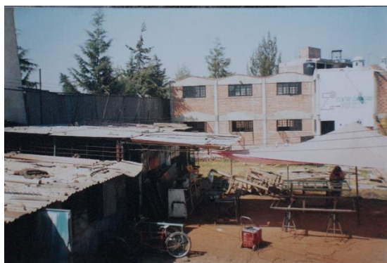
Imagen 11 Salón de usos múltiples, Archivo de Daniel Mejía s/f