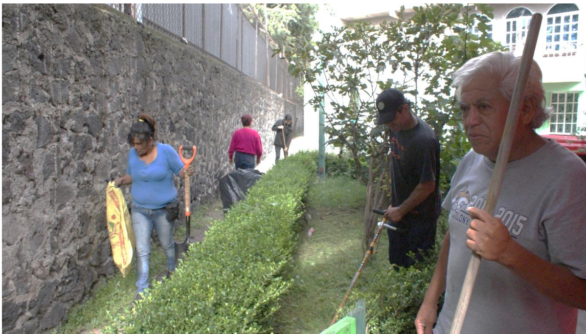
Imagen 3, Faena, 2019

la cooperativa que se mantiene hasta hoy, ahora enfocada en el mantenimiento de los espacios comunes de la cooperativa. 118