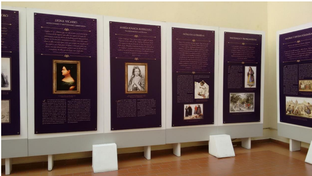
Secretaría de Educación Pública (SEP) (2)