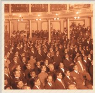
Himno al Centenario de la Constitución 5 DE FEBRERO DE 2017