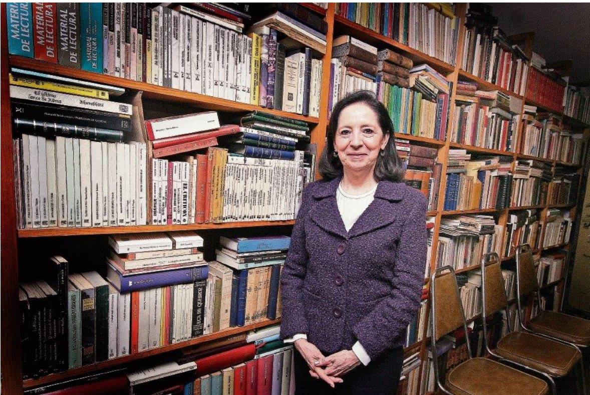
Patricia Galeana, directora general del Instituto Nacional de Estudios Históricos de las Revoluciones de México NACIÓN 26/11/2016 02:02. Astrid Rivera.

En el marco del Centenario de la Carta Magna, destacan el libro del fundador de EL UNIVERSAL, como fuente de información sobre la promulgación del documento