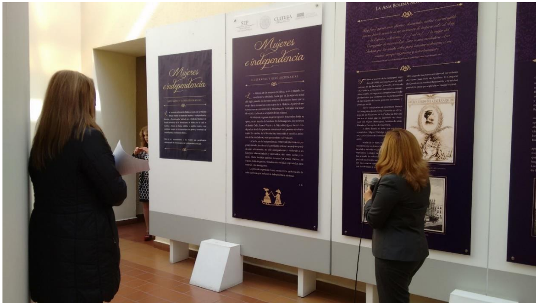
Secretaría de Educación Pública (SEP)