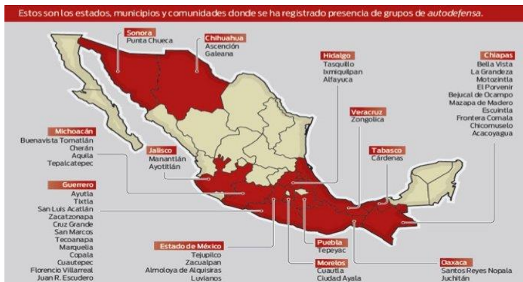
Mapa 3: Grupos de autodefensa en el territorio mexicano