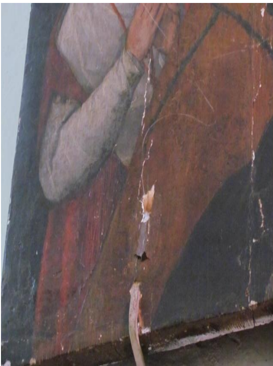
Fotografía 7. Lado inferior izquierdo del lienzo de la virgen del Rosario que denota el mal estado de conservación en el que se encuentra. Tláhuac, México, 2018.