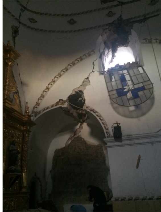
Fotografía 5. Daños severos en iglesias catalogadas como monumentos históricos, derivado del sismo de 8.2 grados. Istmo de Tehuantepec, Oaxaca, México. Septiembre, 2017.