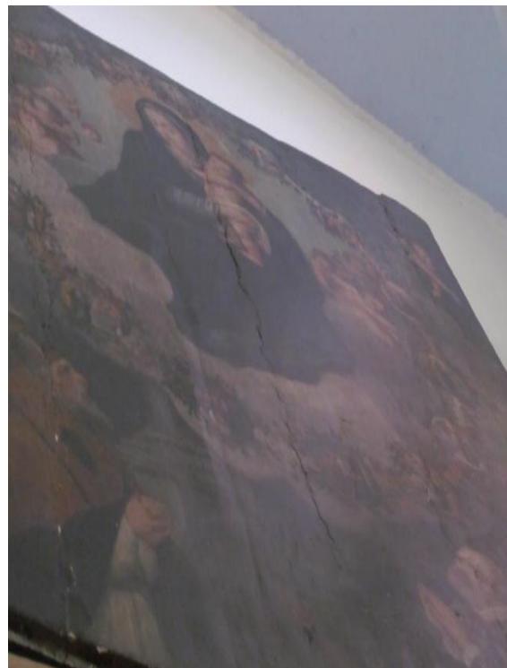
Fotografía 8. Totalidad del lienzo de la virgen del Rosario que denota el mal estado de conservación en el que se encuentra. Tláhuac, México, 2018.