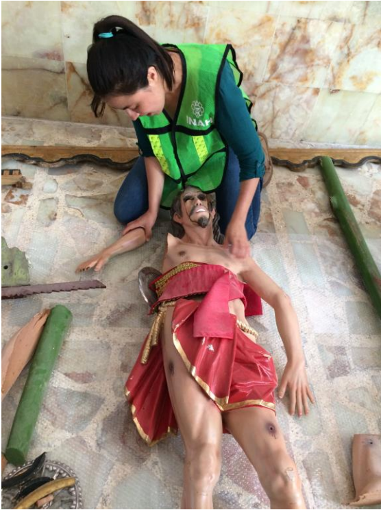
Fotografía 4. Especialista del INAH realiza peritaje en bienes culturales por daños derivados del sismo de 8.2 grados. Istmo de Tehuantepec, Oaxaca, México. Septiembre, 2017.