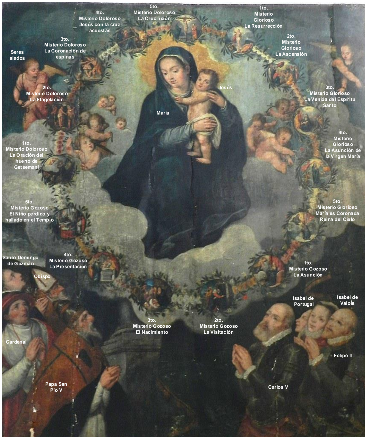
Imagen 3. La virgen del Rosario de la iglesia de San Pedro Apóstol