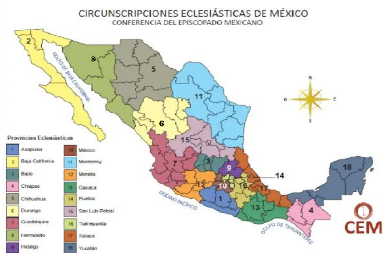
Imagen 2. Mapa de identificación de las provincias eclesiásticas por regiones