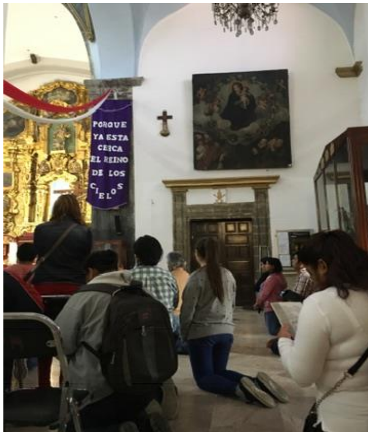
Fotografía 6. Yañez Moreno, Adriana. "Santoral de la virgen del Rosario, octubre 2018".