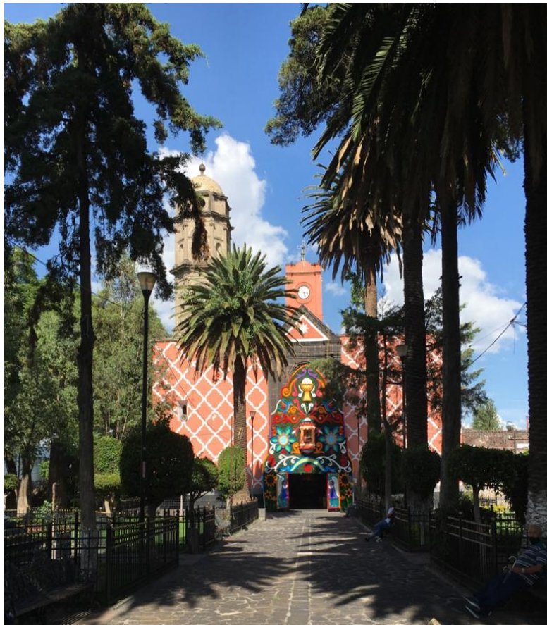
Fotografía 1. Yañez Moreno, Adriana. “Iglesia de San Pedro Apóstol, julio 2020”.