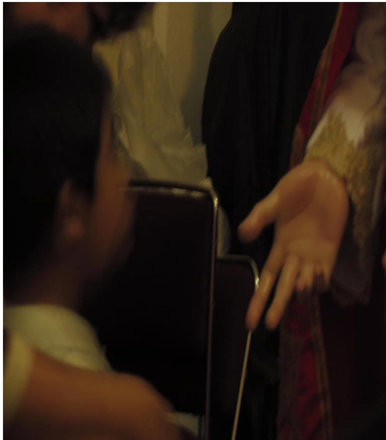
Fotografía 3. Yañez Moreno, Adriana. “De la mano con nuestro patrimonio, junio 2017”.