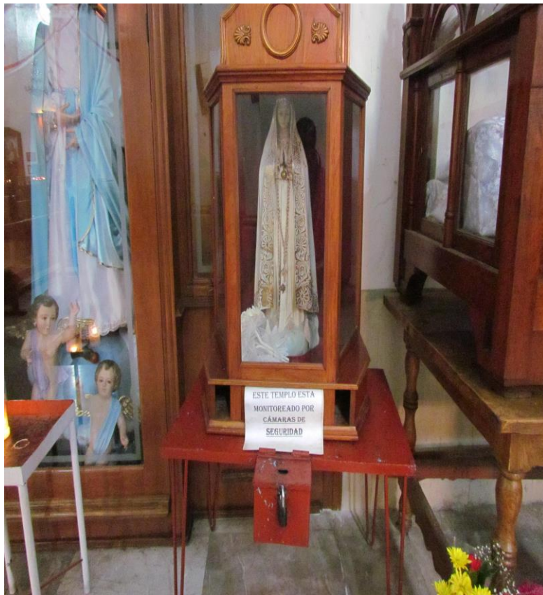
Fotografía 2. Yañez Moreno, Adriana. "Medidas de prevención, junio 2017".