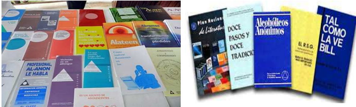
Literatura y folletería utilizada en los diferentes grupos.

Para lograr ese cambio de mentalidad se requiere del conocimiento de todo lo que el alcoholismo provoca en el familiar o en los familiares de los alcohólicos. Los grupos cuentan con una gran diversidad de literatura y folletos que hablan sobre el tema y que se utilizan en cada sesión de estudio.