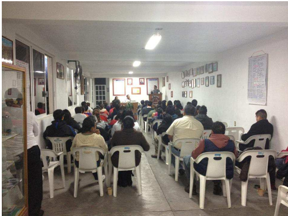
Reunión de Aniversario 4° y 5° pasos Grupo "El Sembrador" Iztapalapa.

Al cabo de unos 30 minutos, todos empezaron a despedirse y a retirarse.