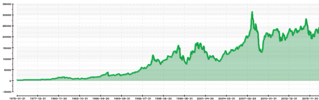
HANG SENG INDEX - Bolsa de valores : China - Hong Kong

Los Mercados bursátiles desde que comenzó la guerra comercial, solo a modo de comparación, el índice neoyorkino Dow Jones industrial cayó en casi un 6% en 2018, pero ya ha subido un 11% en 2020.