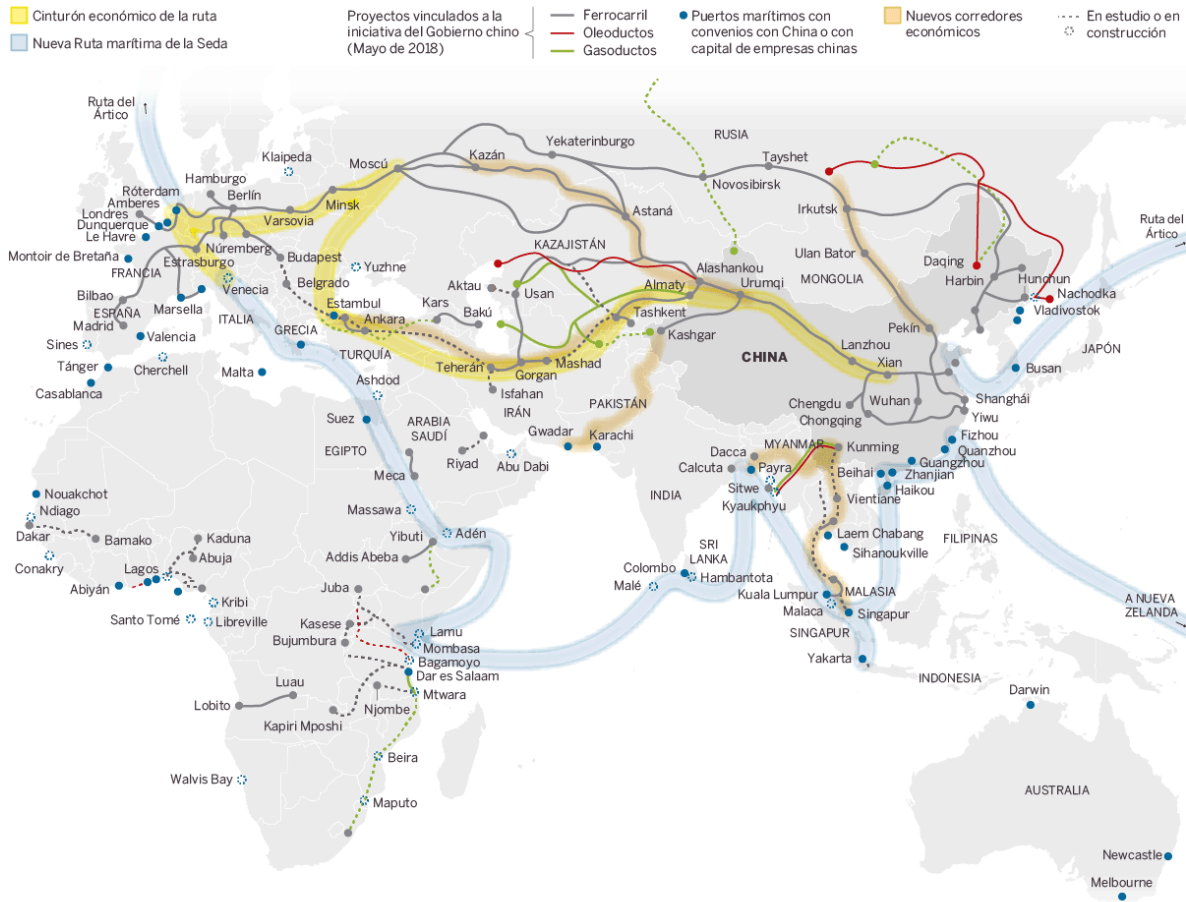
Imagen tomada de: Diario El País, Fuente: MERICS (Instituto Mercator para estudios sobre China). N. CATALÁN. (2018)

La imagen muestra el trayecto en red que toma la Nueva Ruta de la Seda, repartida por los cinco continentes, siendo esto un plan estratégico de ramificaciones geopolíticas y económicas, visto como una planeación de dominación mundial, debido a que apoya al desarrollo de regiones que se encontraban en olvido total.