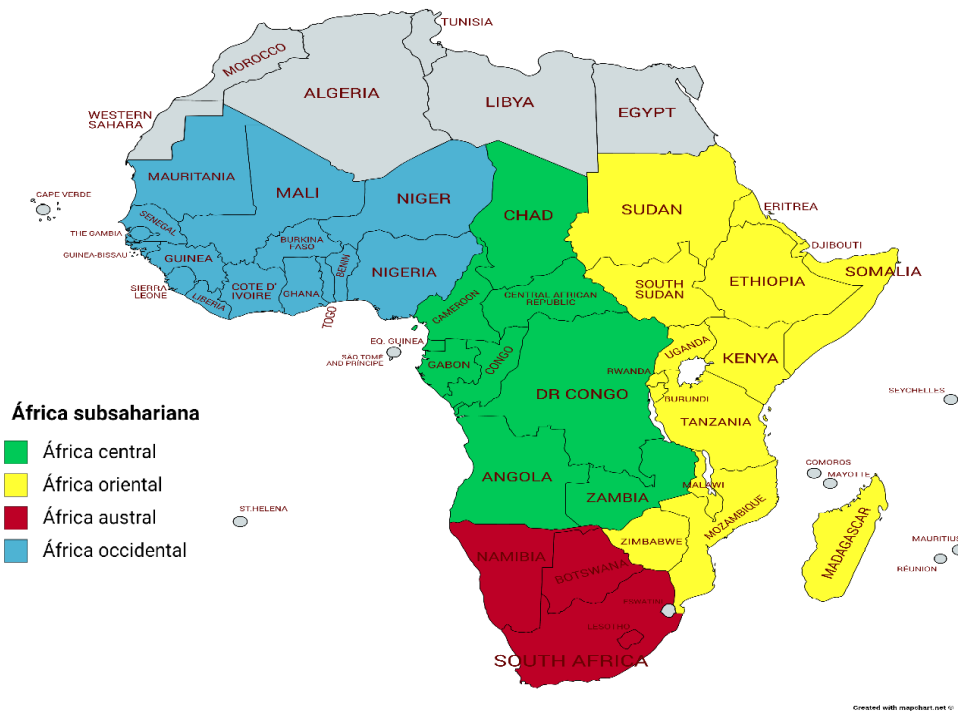
Imagen 1: Mapa del África subsahariana y sus regiones.

Elaboración propia con base en http://mapchart.net/africa.html , última consulta 13/10/19.