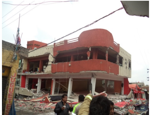
Tienda Neto.

No sólo casas fueron afectadas, sino que también muchos de los negocios y puestos sufrieron daños, razón por la cual la economía del pueblo se vio seriamente afectada al paso de los meses.