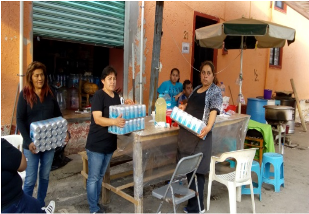
Campamentos ubicados en la calle Insurgentes.