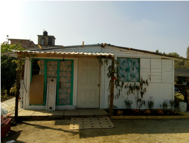
Casa de Aurora San Juan Moyotepec.