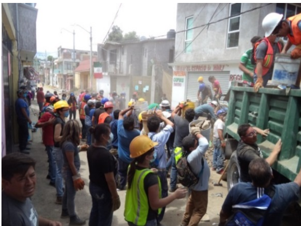
Voluntarios retirando escombros en el centro de San Gregorio Atlapulco.

El documental busca relatar lo que el grupo de voluntarias “Construyendo Sueños” realizó para buscar cubrir un hueco en la ayuda hacia la gente de esta zona tan devastada.