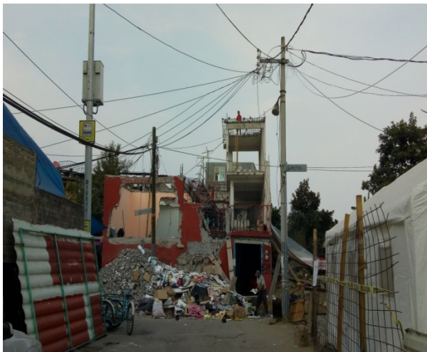
Calle Insurgentes.