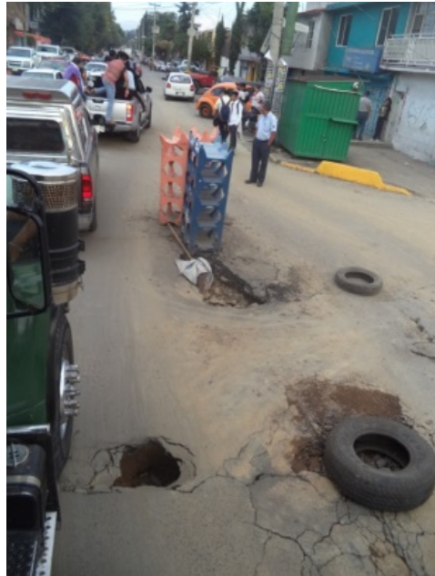
Pequeños socavones en Av. Chapultepec.

la gente de otros pueblos se vieron en la necesidad de caminar o en todo caso pedir ride a los automóviles que pasaban por ahí.