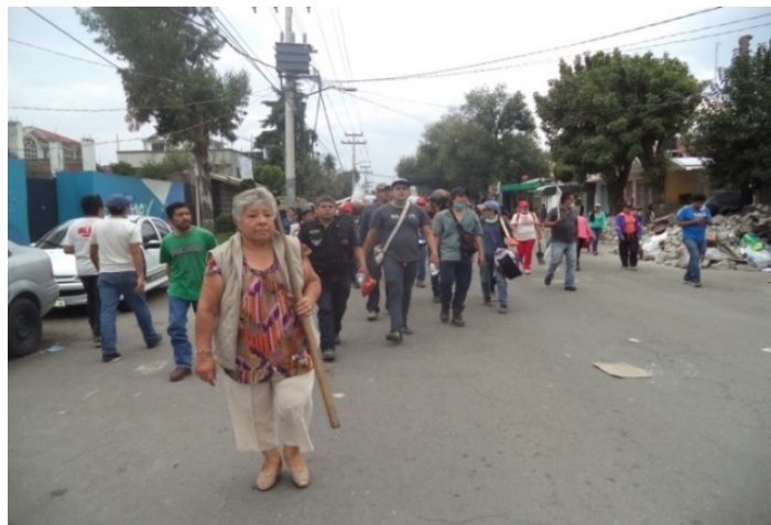
Voluntarios en Av. Chapultepec.

Al siguiente día pude observar la manera en que llagaba el apoyo de diferentes lados de la Ciudad, había gente que llegaba con comida hecha, con despensas, ropa y cobijas, había quienes traían herramienta o quienes prestaban sus carros para sacar escombros o trasladar a personas y/o muebles.