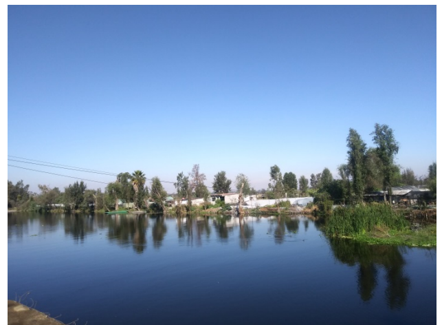
Embarcadero puente de Urrutia, San Gregorio Atlapulco.