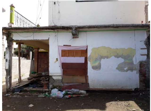
Casa de Perla. Calle Insurgentes, San Gregorio Atlapulco.