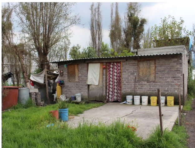
Casa de la Señora Ángeles. Paraje Tlilac.

Para la realización de este documental se utilizaron gran variedad de locaciones, los escenarios principales son las casas de las personas damnificadas, lugar donde se realizaron las entrevistas, otro de los escenarios fue la oficina del Jefe de Unidad Departamental de Regularización Territorial de la Tenencia de la tierra. Otros de los escenarios que se podrán apreciar son diferentes áreas de la zona chinampera y diferentes calles del centro de san Gregorio Atlapulco, en donde se grabaron tomas para los inserts.