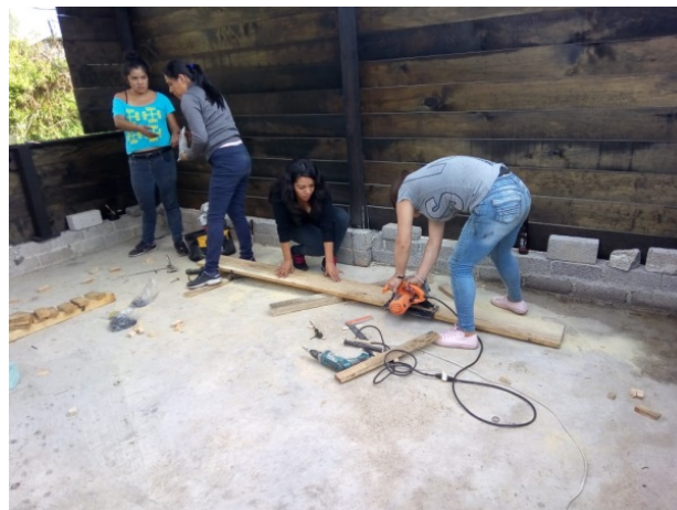
Integrantes y voluntarias de “Construyendo Sueños”.