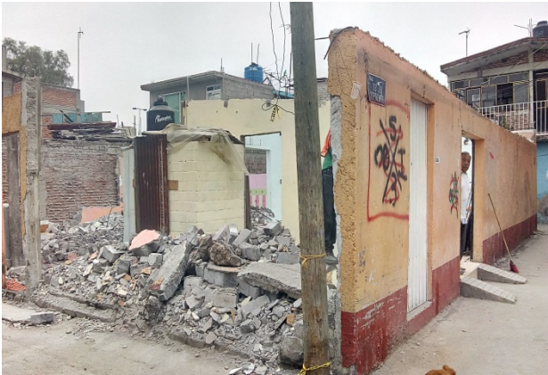
Terreno en ruinas.