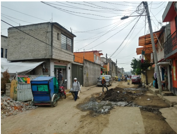
Calle 21 de Marzo, San Gregorio Atlapulco.