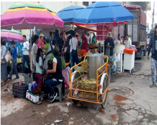
Puestos del mercado.

No sólo casas fueron afectadas, sino que también muchos de los negocios y puestos sufrieron daños, razón por la cual la economía del pueblo se vio seriamente afectada al paso de los meses.