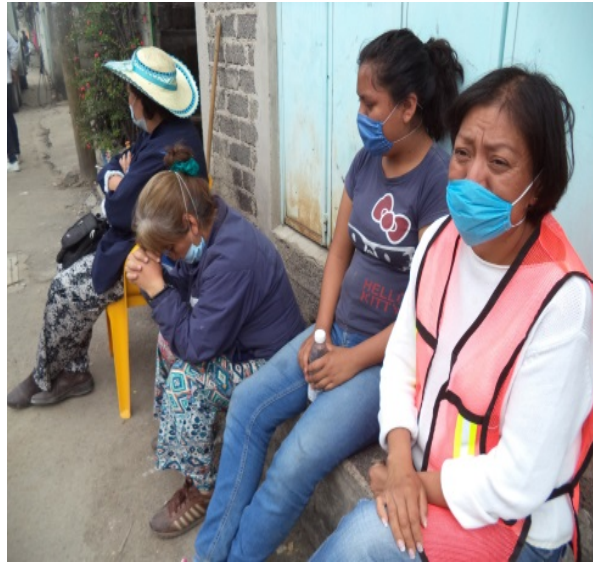
Señoras viendo cómo los voluntarios retiran escombros de sus casas. Calle Insurgentes. Autoría propia.

bardas caídas, otros caminaban con lágrimas en los ojos, algunos otros trabajan en reparar los daños en sus negocios o casas, llegando a la iglesia había mucha gente tratando de quitar las piedras de las bardas que habían caído, otros buscaban a personas entre paredes o techos caídos.