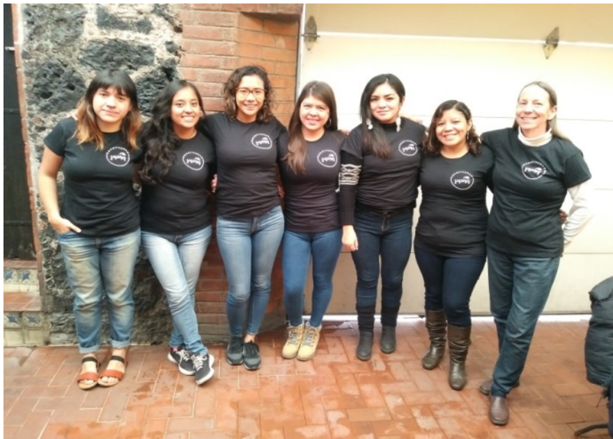
Algunas de las integrantes de Construyendo sueños.

Al paso de los meses se fueron integrando más voluntarias, no es un grupo que tenga una cuestión de género, sino que hemos sido las más interesadas en querer apoyar. Ninguna de nosotras sabía utilizar sierras, pijadoras, cortadoras o algún tipo de herramientas de construcción, sin embargo al ver el desamparo que viven las personas damnificadas de la zona chinampera por parte del gobierno prevalecía el interés de aprender a usarlas para poder ayudar. No todas las integrantes estuvimos presentes en el proceso de construcción, o al momento de tomar alguna decisión, pues algunas de ellas apoyaron a distancia por no estar en la Ciudad.