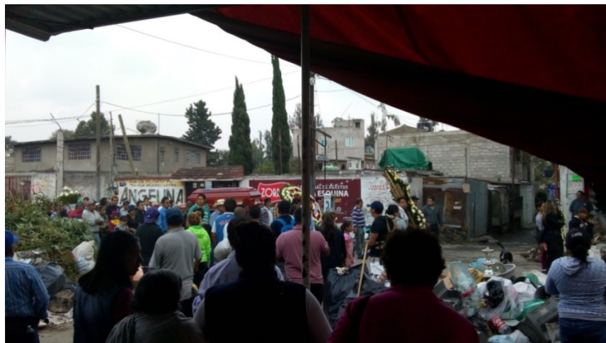
Difunto pasando por Av. Chapultepec.

Desafortunadamente también hubo pérdidas humanas, no solo en el momento del sismo, sino que en las siguientes semanas, incluso meses después, debido a que hubo personas que salieron gravemente heridas y no resistieron, otras más que enfermaron de depresión o tuvieron consecuencias de salud debido a las condiciones en las que vivían. Aunque nunca se precisó el número de víctimas.