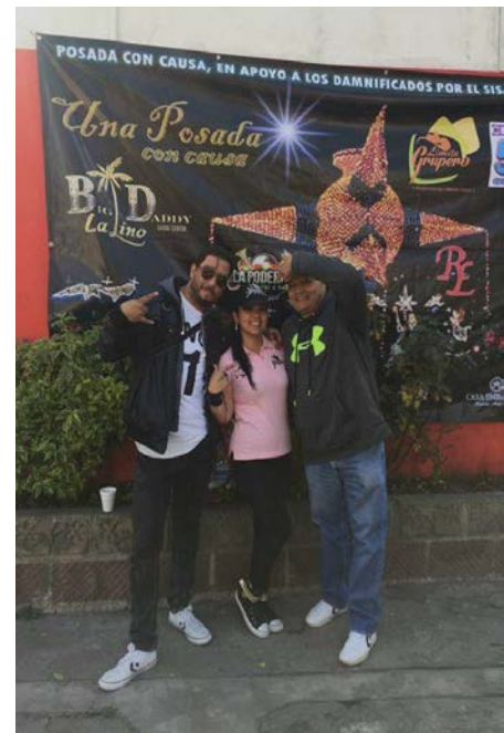
Grupo Limite Grupero. Autoría propia