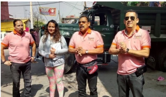
Locutores de estación de Radio de Estados Unidos.