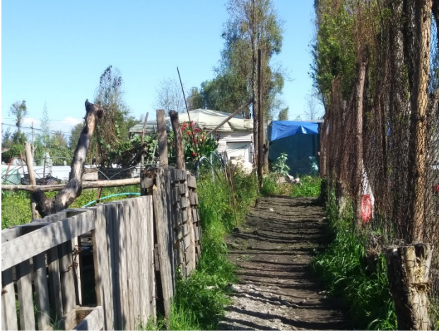
Callejones de la zona chinampera.