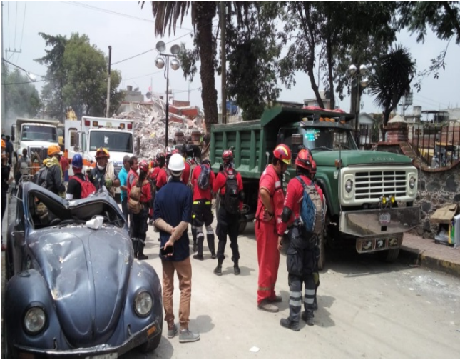
Brigada de Rescate.