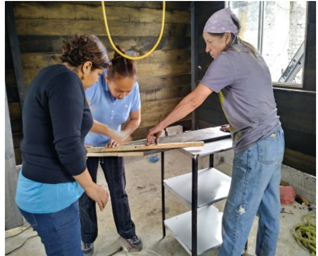
Damnificada e integrantes de “Construyendo Sueños”.

Analizar cómo el movimiento social “Construyendo Sueños” surgió como una respuesta ante el sismo del 19 de septiembre del 2017, en el pueblo de San Gregorio Atlapulco de la Alcaldía Xochimilco para iniciar el proceso de reconstrucción.