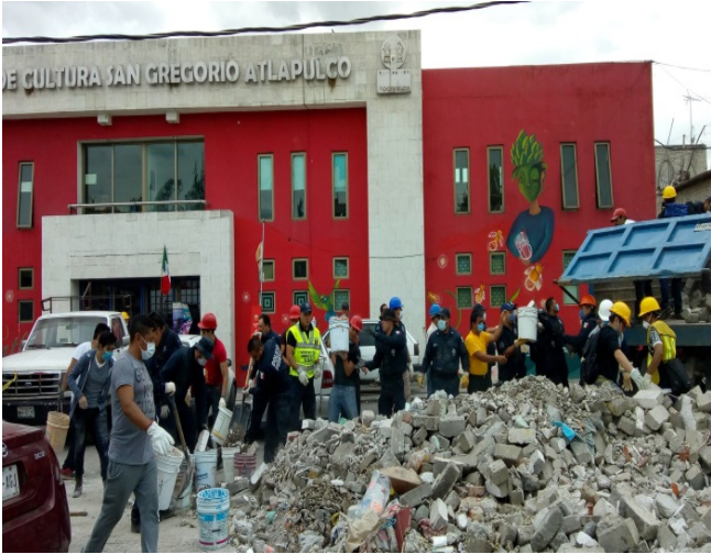
Policías Federales.

Cabe destacar que si hubo presencia del personal de la Marina, Policías Federales, Rescatistas, Bomberos y Militares, aunque hubo un cierto descontento con algunos Militares, pues desde el primer día que llegaron acordonaron la calle que da al centro del pueblo, obstaculizando e impidiendo el paso a los voluntarios, a personas que llevaban alimentos y a los camiones de carga, lo que causó enojo.