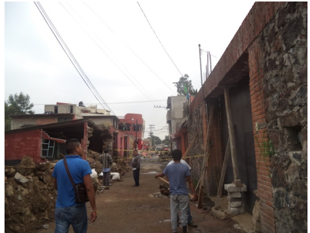
Calle Lázaro Cárdenas.