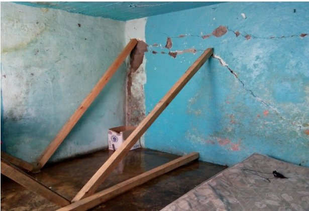
Casa apuntalada.