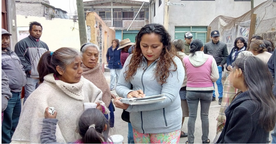
Donación de estación de radio de California.

En las siguientes semanas, se podía observar la manera en que llegaban diferentes dependencias de gobierno, fundaciones y asociaciones civiles para dar paso al comienzo de reconstrucción.