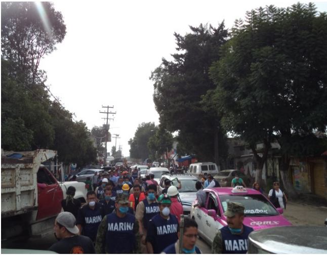
Personal de la Marina.