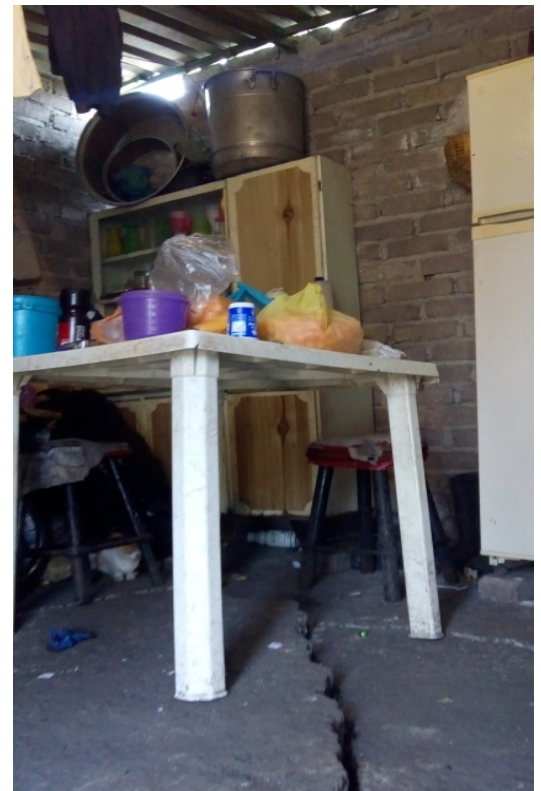
Casa de la señora Ángeles. Autoría propia