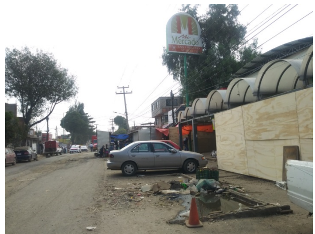
Carretera Avenida Chapultepec.