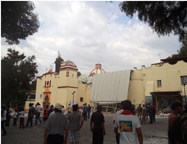
Parroquia de San Gregorio Magno.

El pueblo de San Gregorio Atlapulco ubicado en la Alcaldía Xochimilco, fue una de las zonas más devastadas por el sismo, cientos de casas no soportaron el movimiento telúrico y desplomaron al instante, otras más quedaron inhabilitadas, razón por la que un sinnúmero de familias se quedaron sin un techo donde dormir y muchas más que sufrieron daños menores, pero significativos. El sismo también afectó la parroquia, el mercado, negocios particulares, escuelas y avenidas principales del pueblo.