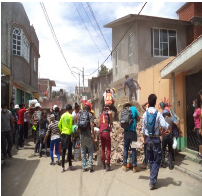
Voluntarios retirando escombros en el centro de San Gregorio Atlapulco.

Dar a conocer la zona chinampera, una de las zonas más afectadas tras el sismo.