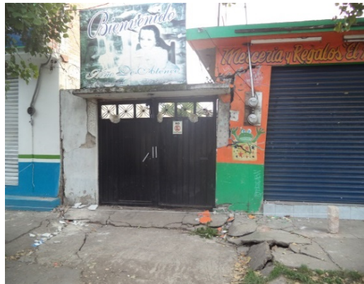
Local fracturado.