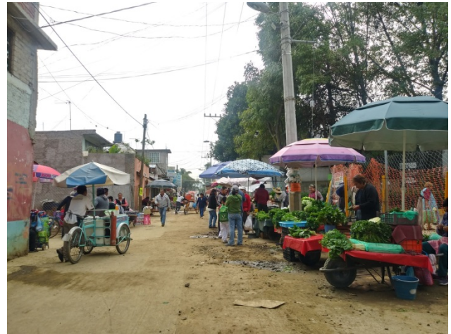
Calle Insurgentes San Gregorio Atlapulco.