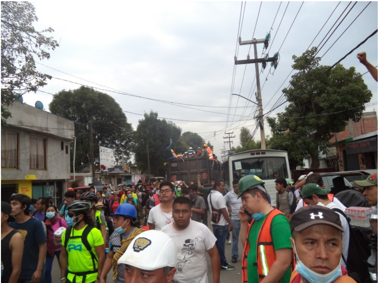
Avenida Chapultepec.

Una vez más el gobierno demostró que no está preparado para lo imprevisto, por lo que ante la ineficiencia notable del gobierno, los ciudadanos volvieron a tomar el control de la Ciudad, la gente rebasó a los servicios oficiales en su rapidez y eficacia de respuesta a la tragedia. Transcurridas las primeras horas del sismo las calles se abarrotaron de cientos de voluntarios, se establecieron brigadas de rescate conformadas por ciudadanos que se organizaron espontáneamente para remover los escombros y buscar personas atrapadas, las horas transcurrían y la gente no paraba de llegar, hubo quienes trajeron alimentos, material de curación y herramientas, también quienes facilitaban sus vehículos para trasladar personas o muebles y quienes prestaban sus servicios como Ingenieros, Arquitectos, Médicos, Veterinarios y Materialistas.