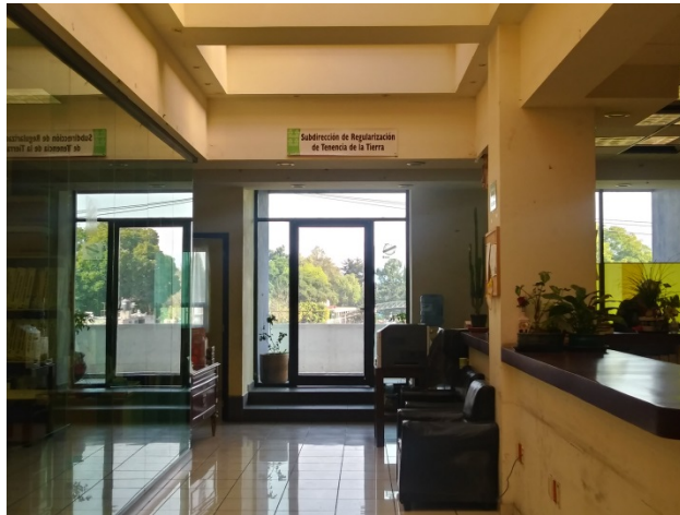
Oficina en la Alcaldía Xochimilco.