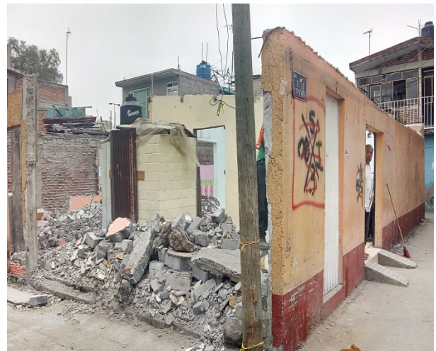
Calle 13 de septiembre.