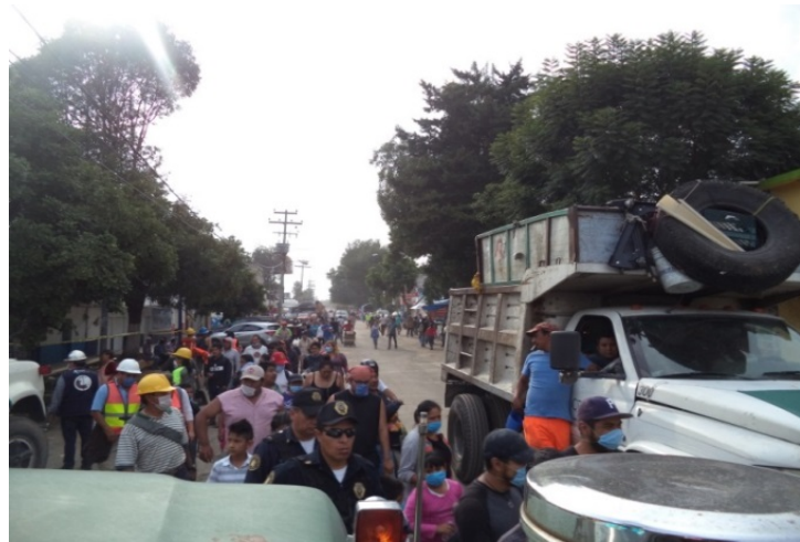
Voluntarios en Av. Chapultepec.

Desafortunadamente también hubo pérdidas humanas, no solo en el momento del sismo, sino que en las siguientes semanas, incluso meses después, debido a que hubo personas que salieron gravemente heridas y no resistieron, otras más que enfermaron de depresión o tuvieron consecuencias de salud debido a las condiciones en las que vivían. Aunque nunca se precisó el número de víctimas.