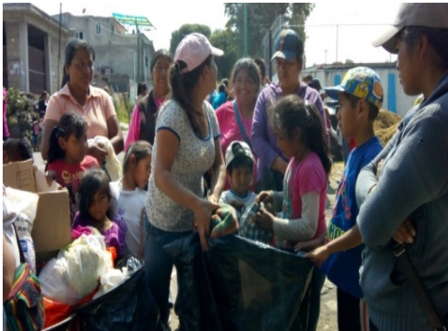
Donaciones que entregábamos de acuerdo a las necesidades.