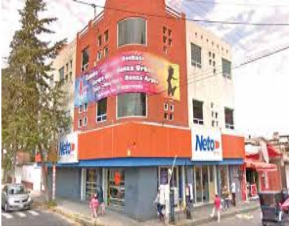
Tienda Neto. Excélsior.