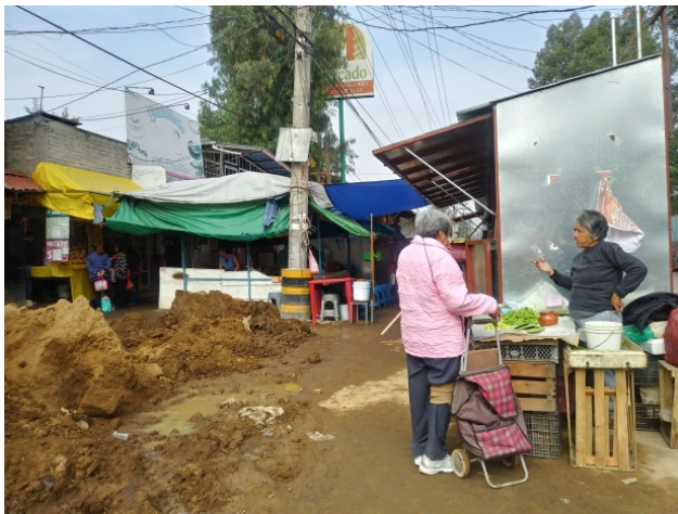
Mercado del pueblo de San Gregorio Atlapulco.