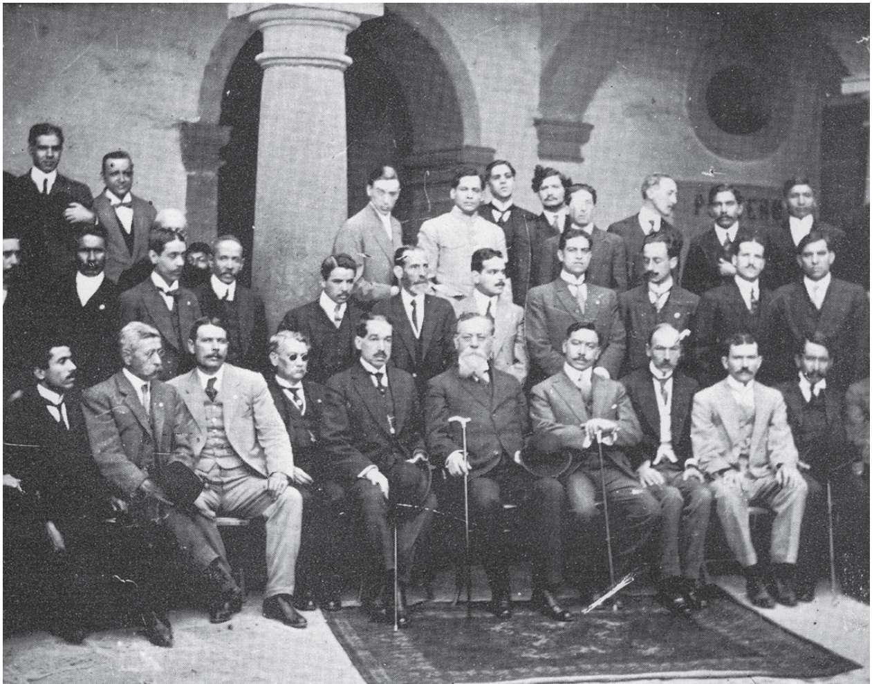
Imagen. Venustiano Carranza con Diputados Constituyentes de 1917, después de haber reformado la Carta Magna de 1857. Casasola, Gustavo Historia gráfica de la Revolución Mexicana , t. II, México, Edición Conmemorativa, Trillas, 1967, p. 1205.