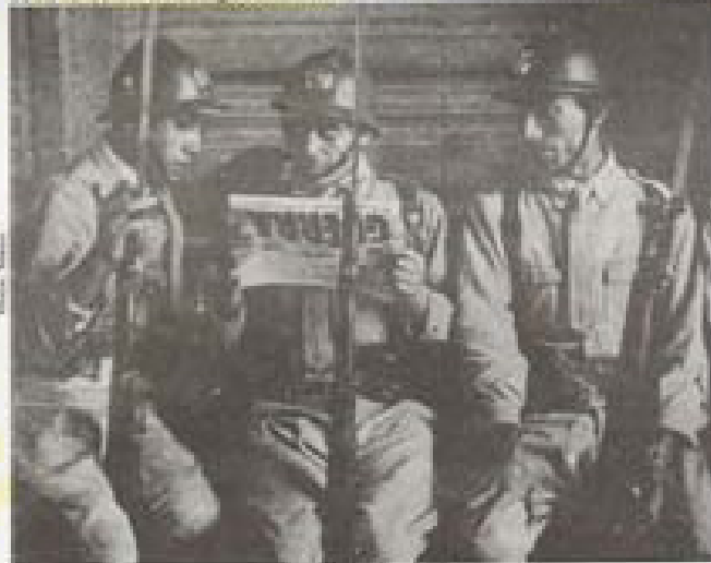
1941. Mesa redonda

La palabra sueca ombud , se refiere a una persona que actúa co-