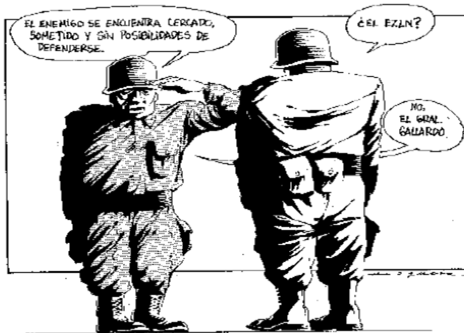
Caricatura elaborada por «Helguera», La jornada , 25 de enero de 1997. Fuente: Gallardo Rodríguez, José Francisco, op. cit. , nota 391, p. 279. Véase Anexo Catorce.

Esta aludida facción en su afán de intentar perpetuar su coto de poder comete arbitrariedades o realiza conductas ilícitas tendientes a exterminar a quien se oponga a sus fines. Para lo anterior, se valen de la distorsión y malinterpretación que se ha hecho del denominado fuero militar, ese régimen disciplinario interno es el instrumento legal del que se sirven para eliminar a todo aquel que se interponga a los intereses cupulares o personales de aquellos quienes dirigen al brazo armado del Estado mexicano. El procedimiento militar disciplinario, en cita, se ha convertido en el adnículo del cual se vale la cúpula del ejército para aniquilar a los miembros de la citada institución que no acatan el código no escrito, pero vigente y válido, de la obediencia absoluta e incuestionable hacia la persona que ostenta el grado jerárquico inmediato superior; de ahí que la Procuraduría General de Justicia Militar y los Tribunales militares son utilizados por la élite dirigente de esta institución para fines diversos a los legalmente instituidos, con lo que desvían su función orgánica (o poder) ya que «los planteamientos explícitos y reglamentarios en las fuerzas armadas son retóricos y sólo han servido para el faccioso ajuste de cuentas entre los mandos superiores contra oficiales de menor rango y tropa para cuando se necesite dar la imagen de su voluntad de respeto y autoridad en la materia» 426 .