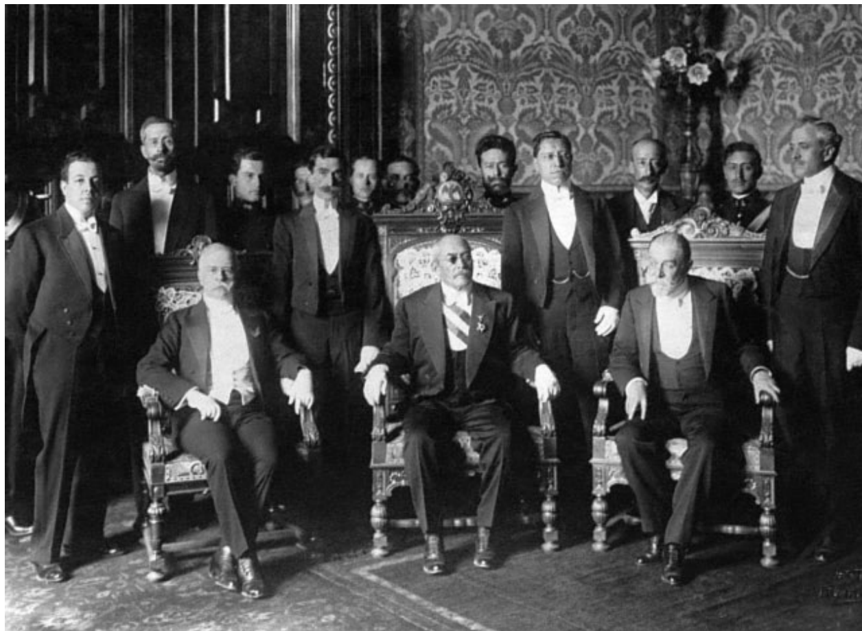
Imagen. En el fotograma se aprecia a Victoriano Huerta, ya nombrado presidente interino de México junto a su gabinete. El General Huerta fue uno de los principales conspiradores del golpe de Estado contra el legítimo gobierno de Francisco I. Madero.