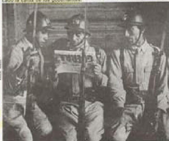
1941. Marea rosarina

La palabra sueca ombud , se refiere a una persona que actúa co-