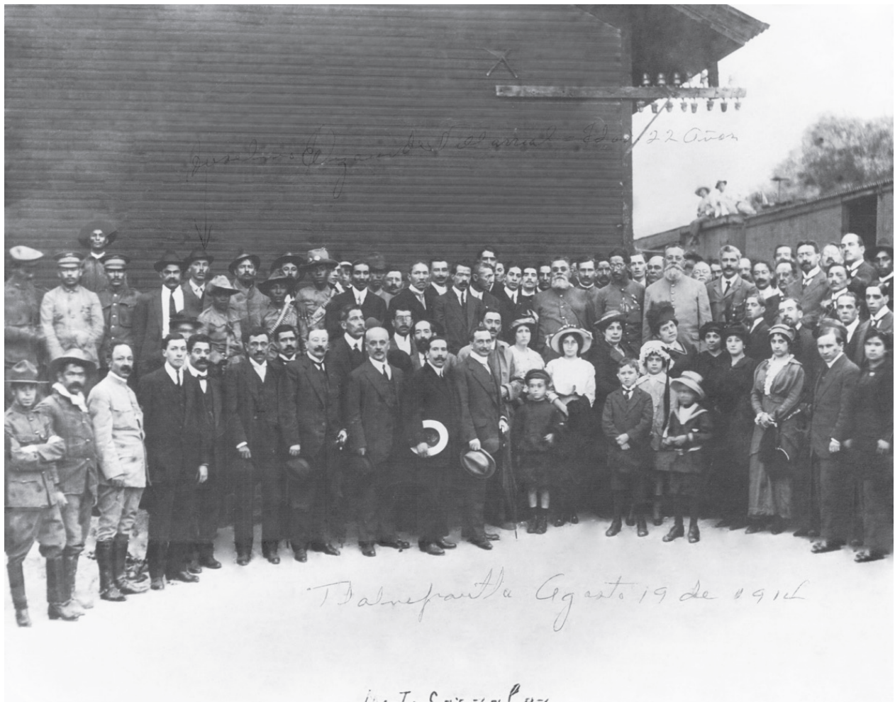
Imagen. El Primer Jefe del Ejército Constitucionalista don Venustiano Carranza en Tlalnepantla. En su paso hacia la Ciudad de México el ferrocarril de Carranza paró en Tlalnepantla donde fue recibido con festejos y música el 19 de agosto de 1914. Instituto Nacional de Estudios Históricos de las Revoluciones de México, Historia de los ejércitos mexicanos , México, Instituto Nacional de Estudios Históricos de las Revoluciones de México, 2014, p.34.