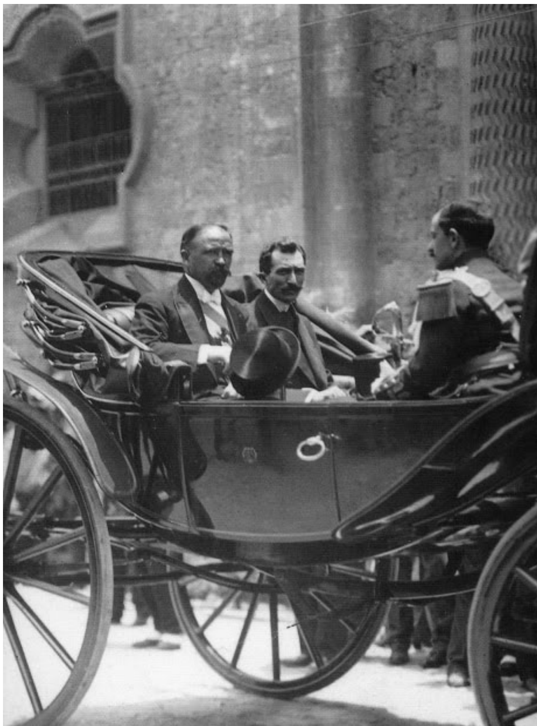
Imagen. Recorrido realizado el día 6 de noviembre de 1911 por el Presidente don Francisco I. Madero junto al Vicepresidente José María Pino Suárez después de tomar posesión de tan altos cargos con los que el pueblo de México los investió. Secretaría de la Defensa Nacional y Secretaría de Marina-Armada de México, Las Fuerzas Armadas en la Revolución Mexicana , México, Secretaría de la Defensa Nacional y Secretaría de Marina-Armada de México, 2013, p. 273.