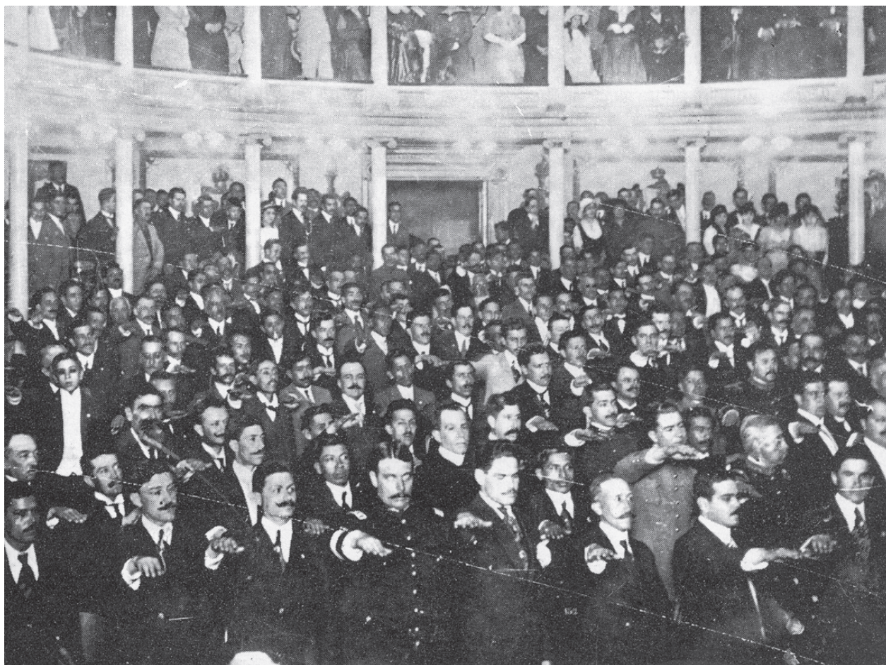
Imagen. Diputados del Congreso Constituyente de 1917 protestando guardar y hacer guardar la Constitución Política de los Estados Unidos Mexicanos. Casasola, Gustavo, Historia gráfica de la Revolución Mexicana , t. II, México, Edición Conmemorativa, Trillas, 1967, p. 1205.