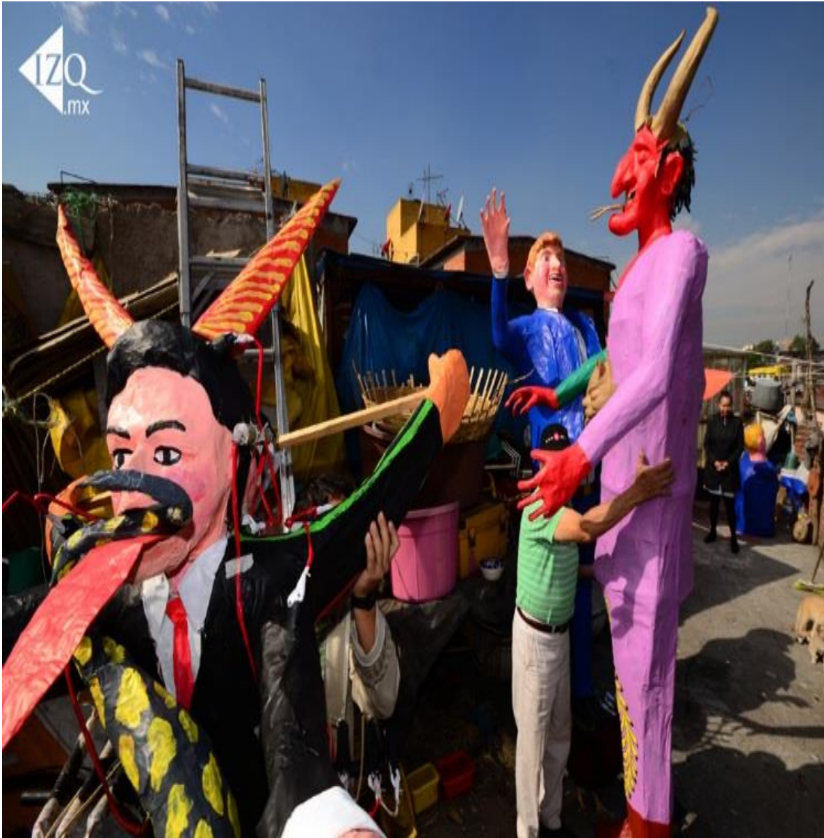
FIGURA 11. Diablos que se queman casi al terminar la Semana Santa en la Calle Oriente 30 en la colonia Merced Balbuena el 26 de marzo de 2016, dónde se resignifican y representan políticos, siendo el presidente Enrique Peña Nieto el más abucheado cuando se llegó la hora de quemarlo y que con desproporción que se dio a su imagen causaba risas en los asistentes que presenciaban la quema del mismo. Dichos personajes, que con sus acciones hacen que la comunidad y la sociedad los vea como malos y los asocian con ellos, fueron quemados y de manera simbólica se fue el mal que hacen y descontento social que causa con su presencia.

mismos que están en color rojo y de un tamaño más grande, no corresponden con la escala en la que está realizado el judas.