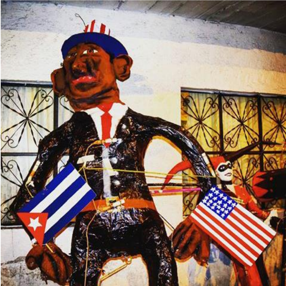
FIGURA 14. Judas del ex presidente Barack Obama en la quema de Judas en la Calle Oriente 30 de la Colonia La Merced Balbuena en la Ciudad de México, el 15 de abril de 2017. Figura pública que rebaso todas las fronteras y que sin duda alguna seguirá siendo importante para todo el mundo.

En el fondo Judas de Arlequín, personaje de la caricatura Batman y que es una mujer que enloquece para ayudar y ser pareja del Joker o Wason.