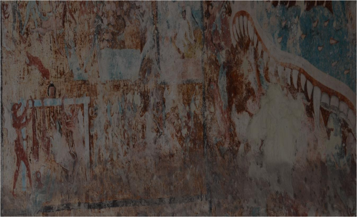
FIGURA 8. Capilla abierta del Templo San Antonio Tolentino. Actopan, Hidalgo. Julio de 2017. Los diablos y demonios arrojan a los indígenas al infierno por sus pecados. Las fauces abiertas significan las puertas al infierno, además de que se muestran de una manera grotesca al tener colmillos grandes y filosos, púas y al fondo de la boca se observa como hay personas sufriendo. Los demonios son representados de color rojo, con cuernos y cola, además de tener alas de murciélago.