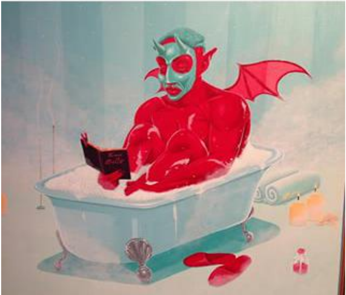
FIGURA 17. Representación en ilustración de un día cotidiano de un diablo o demonio. Presentada en la exposición 5 Diablos del 12 de septiembre al 22 de noviembre de 2013 en Rojo Bermelo, ubicado en Av. Amatlan 105, en la Colonia Condesa, esta ilustración muestra un demonio tranquilo, sin estrés, pasivo, que además cuida su físico, puesto que trae mascarilla y tiene un cuerpo atlético de color rojo, que se preocupa por leer, mantener la concentración y que no deja de ser un ángel caído puesto que tiene sus alas y los colores cálidos que utiliza el artista ayuda a que lo veamos de una estética impecable y de manera inofensiva.

tonos pastel y resalta en su totalidad el rojo, que es brillante, llamativo y no permite dejar de observar la imagen del demonio.