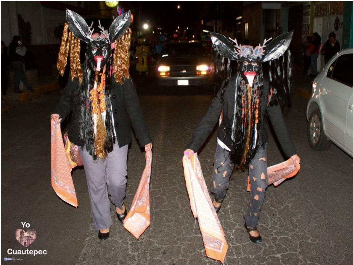
FIGURA 20. Bailarines de COMUNIDANZA, representado la Danza de los Diablos en el desfile de Día de Muertos en Cuautepec, organizado por el grupo cultural Yo Amo Cuautepec (Yo <3 Cuautepec) perteneciente a la Delegación Gustavo A. Madero el día 1 de noviembre de 2016. Se puede observar cual es el vestuario, son cuernos de venado, con orejas grandes, ropa desgastada o rota, paliacates para hacer ver los movimientos más grandes, tienen pelo largo que sale de sus orejas, barba larga y desalineada de la danza originaria de Oaxaca y que la compañía de danza quiere dar a conocer como parte de las tradiciones. Además de que muestran el sincretismo y el contacto de diferentes culturas. Los movimientos realizados son agresivos, bruscos e incluso realizan gritos para asustar a la población, puesto que son los diablos que vienen del infierno para atormentar a la gente en ese día.