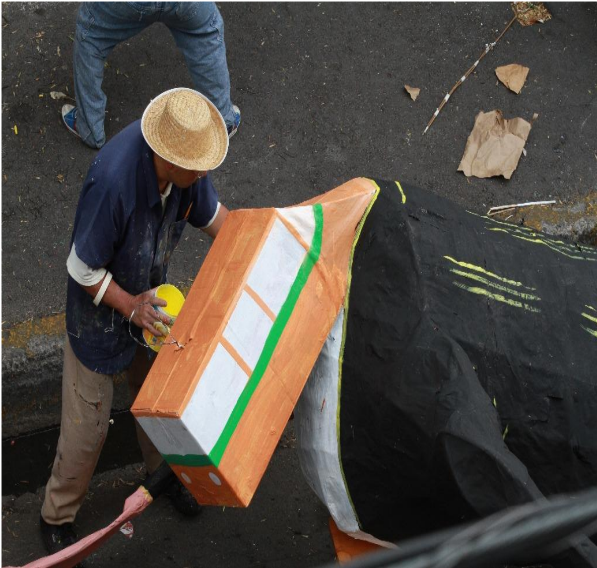
FIGURA 13. Diablito de un vagón del Transporte Colectivo Metro, que tiene como función la crítica social al mismo y al aumento del costo del boleto, este fue quemado en la Calle Oriente 30 en la Colonia Merced Balbuena dentro de la ya tradicional quema de Judas en el 2014. Esta crítica al aumento del precio del transporte público y su mal funcionamiento ocasiono que todos quisieran quemarlo ya que causa molestias y enojo a diario, no solo por lo lento, sino también a la economía. Poniéndolo con traje y corbata, pero quemando su imagen perfecta.