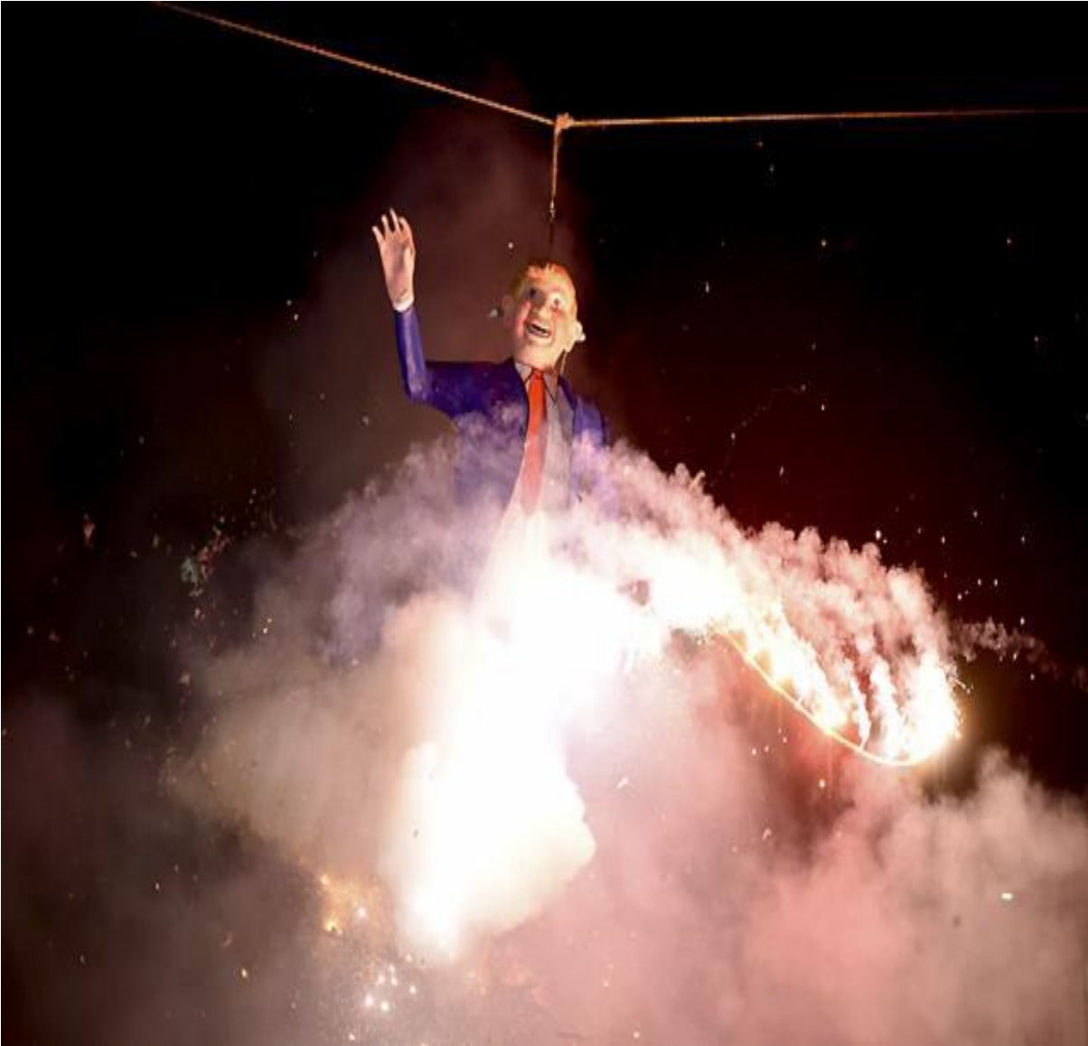
FIGURA 12. Quema de diablitos o Judas del actual presidente de Estados Unidos de Norteamérica, Donald Trump. En la calle Oriente 30 de la Colonia Merced Balbuena el 26 de marzo de 2016 también sobre salió la imagen del presidente mismo que genero polémica, descontento e indignación por los comentarios y críticas hacia el pueblo mexicano. Por ello no dudaron en realizar un Judas con su imagen, quemarlo y calmar ese enojo que causo. Con su traje perfecto, su copete rubio, corbata roja y la risa que lo caracteriza fue quemado entre lo cuetes y mandado al infierno.