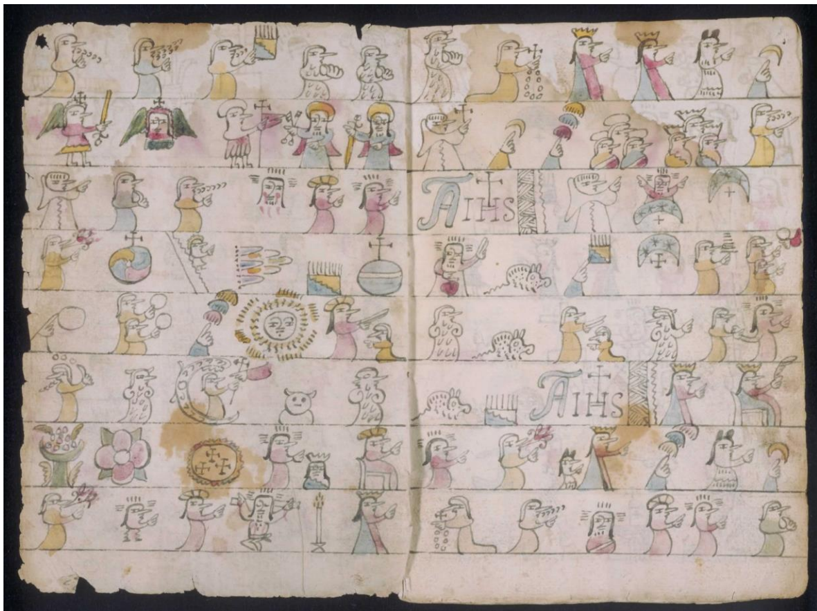
FIGURA 3. Códice Testeriano III. Se observa el Ave María y la imagen del demonio representado con cuernos. La representación es para que el pueblo indígena lo entendía y aplicara los dogmas religiosos .

En la Figura 3 se puede observar como se ve la representación de dicho Códice, donde se muestra el Ave María con signos y pictografías, en el cuál se ve la imagen del demonio debajo de un sol, para representar el mal.