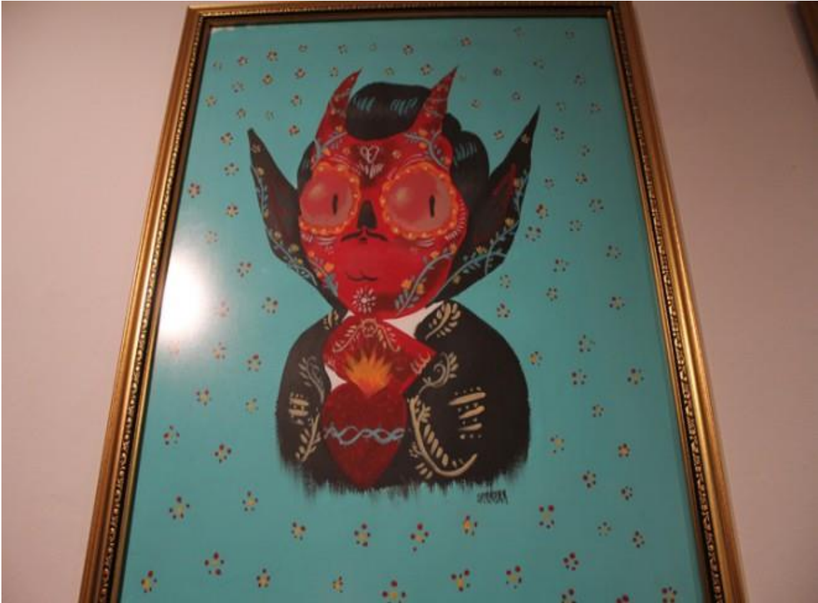
FIGURA 18. Ilustración de diablo con atuendo de charro. Expuesta en Rojo Bermelo ubicado en Av. Amatlan 105, en la Colonia Condesa como parte de la exposición 5 Diablos del 10 de septiembre al 22 de noviembre de 2013. Esta ilustración con tonos cálidos nos hace ver un diablo pícaro, coqueto y con el cual nos identificamos por el traje de charro, mismo que es representativo de nuestra cultura mexicana, este diablo rojo resalta e incluso parece que te observa en todo momento, como si estuviera esperando el momento indicado para atacar de manera inofensiva.