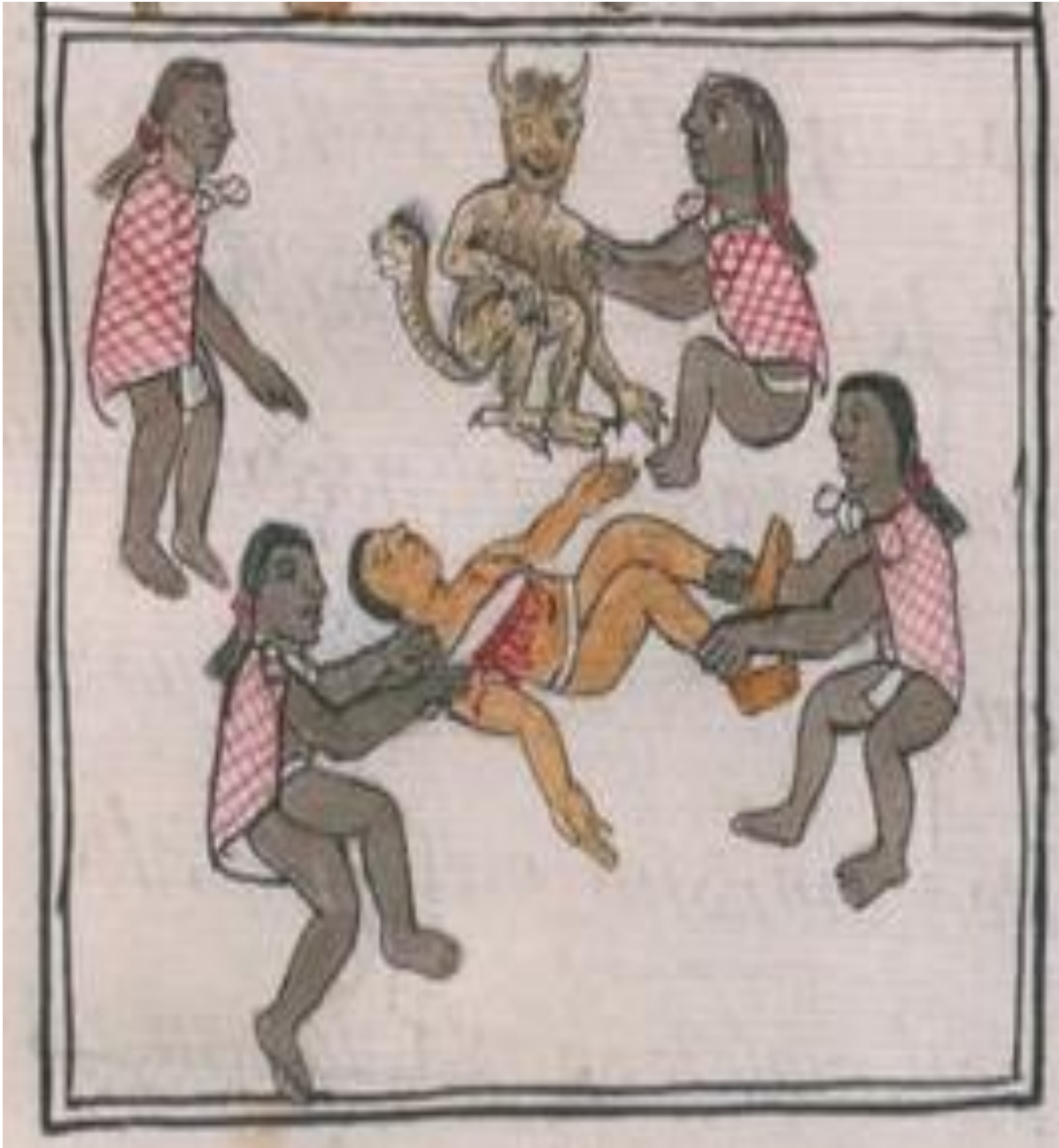
FIGURA 6. Códice Florentino. Lib. VIII, fol. 34v. Se puede ver como hacían los indígenas un sacrificó, sacándole el corazón a un guerrero que pertenecía a otro attlépetl. Era un ritual de la Triple Alianza. Hay que mencionar, que la Triple Alianza fue una formación política entre los gobiernos de Tenochtitlan, Texcoco y Tacuba, por la ofensiva contra Azcapotzalco y ser libres, teniendo como fin el dominio del mismo.

puesto que los demás personajes están en una actitud de respeto y este pareciera disfrutar las acciones que realizan los demás.