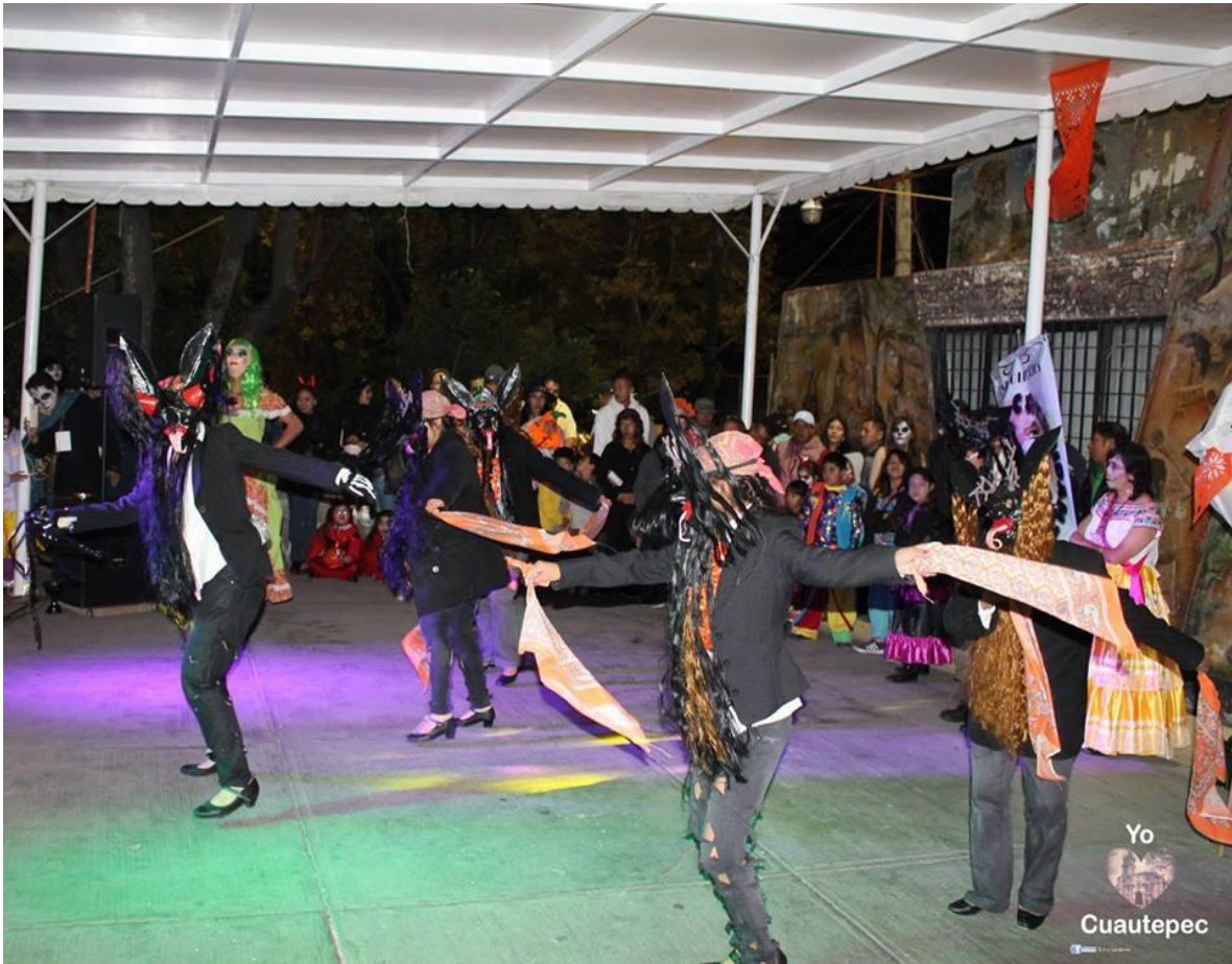
FIGURA 21. Representación de la Danza de los Diablos en el Desfile del Día de Muertos 1 de noviembre de 2016 en el Jardín Hidalgo. Alrededor de 7 bailarines del grupo de danza COMUNIDANZA dieron vida en el Teatro al aire libre, a la danza típica de Oaxaca, siendo el personaje principal el Diablo Mayor, quien llevaba un látigo, con el cual golpea a su mujer y a los diablos, además asustar a los espectadores por intentar golpearlos. Los bailarines interpretaron alrededor de 3 piezas donde generaron temor y asombro por la caracterización y representación de los diablos, además de que la representación también tuvo cargado de humor y crítica hacia el machismo que existe en nuestro país. Con movimientos bruscos, fuertes y caídas inesperadas mostraron el caos que pueden provocar además de manifestar la importancia de retomar nuestras tradiciones.