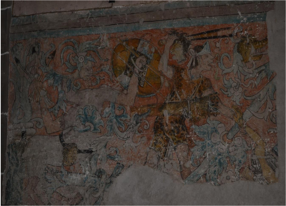
FIGURA 9. Mural Ex convento de San Miguel Arcángel. Ixmiquilpan, Hidalgo. Julio, 2017. Se muestra a guerrero mesoamericano peleando y muestra su victoria cargando en mano derecha una cabeza y en la mano izquierda un brazo. Atrás de él un figura zoomorfa y delante de él la cabeza de un demonio. Se explica cómo los frailes veían las acciones de los indígenas guiadas por el demonio.