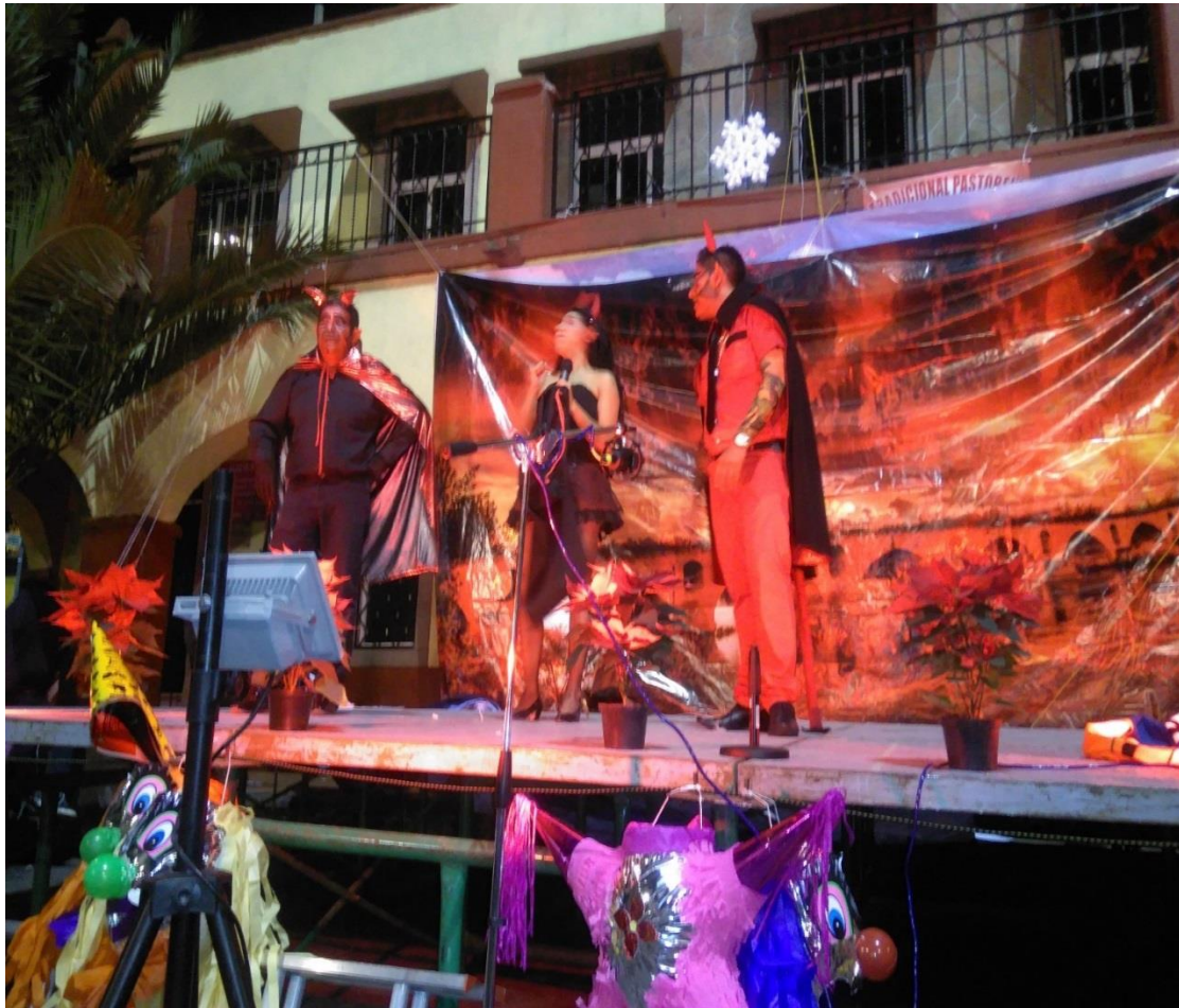
FIGURA 10. Muestra de una pastorela contemporánea Bailando por niño Dios, realizada en la zona de Cuauhtepac Barrio Bajo, delegación Gustavo A. Madero el 10 de diciembre de 2016. Donde los demonios Sulfurito, Luciferina y Satánico (de izquierda a derecha) tienen características diferentes, tanto en el vestuario, como en la representación misma, pero mantienen los elementos clásicos, es decir el color rojo, cola, cuernos y lo cómico en sus personajes.