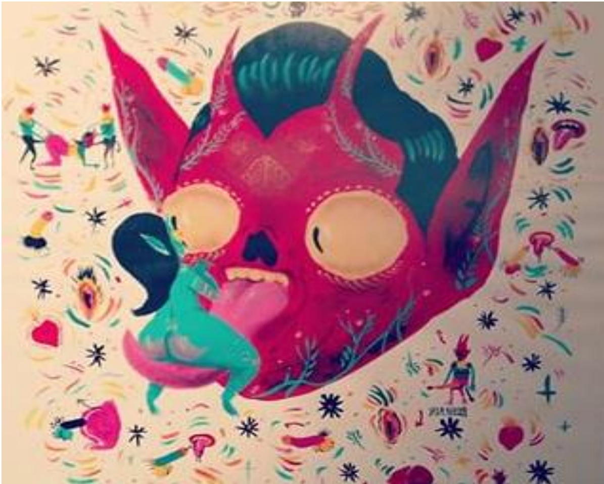
FIGURA 19. Diablo que muestra lo erótico, sensual del sexo, dando una representación de lo perverso que se puede llegar a ser. Ilustración del Artista Señor Calavera, expuesta en Rojo Bermelo, en la exposición 5 Diablos que se llevó a cabo del 12 de septiembre al 22 de noviembre en 2013. La imagen del diablo muestra también que este sigue guardando las características clásicas, ya que es de color rojo, tiene orejas grandes y al estar representado con la lengua larga da un toque de comicidad, pero de miedo al mismo tiempo. Los diablos que están a su alrededor con penes erectos están de igual manera en color rojo y con cuernos, las vaginas y penes se mantiene del mismo color para que sobre salgan y de alguna manera indicar que son acciones malas.

erótico, que ya no se ve como un tabú, sino como una manifestación cultural. Los diablos usan ropa en colores brillantes, lo que quiere decir que dentro de cada uno hay un demonio y al pensar en el disfrute del sexo, este se manifiesta.