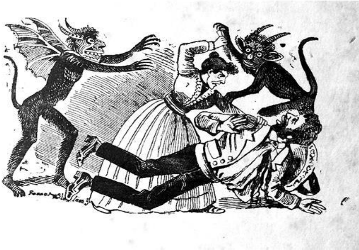
FIGURA 16. Pesiller, Carlos, (1992), José Guadalupe Posada: Ilustrador de la vida Mexicana, México: Fondo Editorial de la Plástica Mexicana, p.175. Mujer provocada y alentada para atacar a un hombre, cuya acción pareciera imposible, pero que con la fuerza y consejos del demonio se convierte en realidad.

Del lado izquierdo, el demonio con rostro de perfil no posee orejas y en la cara pareciera tener una especie de escamas que al mostrar los dientes genera una especie de gesto de maldad, asimismo de que, en lugar de tener dedos en las manos y pies, tiene garras como de ave, igualmente tiene alas de ave.