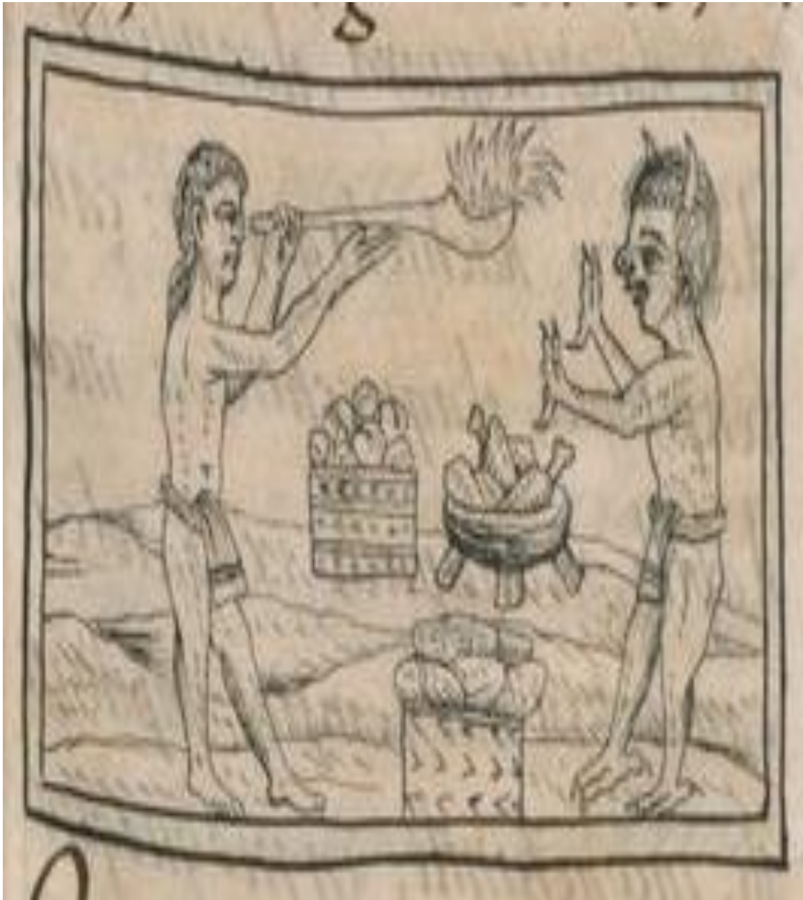
FIGURA 5. Códice Florentino. Lib. VI, fol. 28r. Se observa como los indios oraban y le pedían al dios Tezcatlipoca favores contra la pobreza.