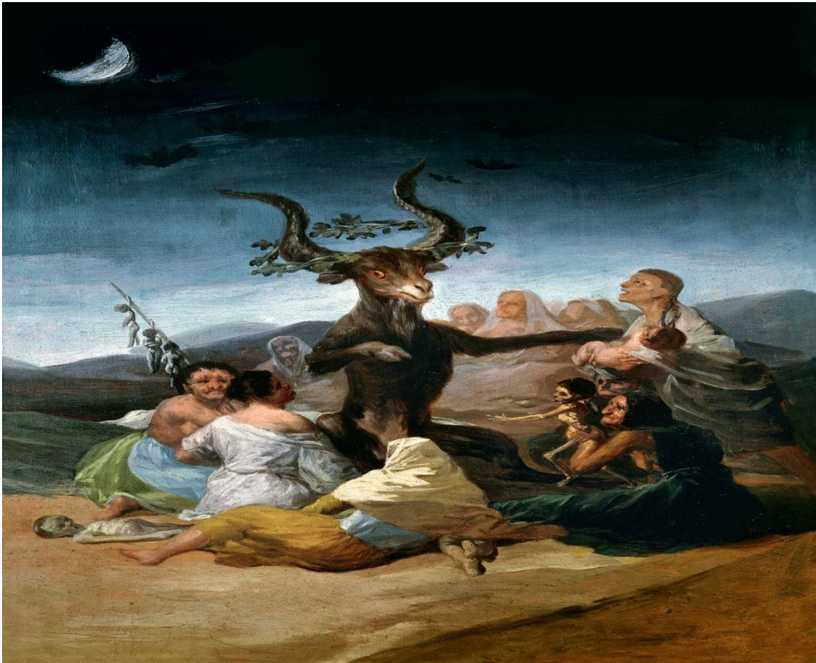
FIGURA 1. Representación de un macho cabrío con cuernos rodeado de lo que serían brujas y dando en adoración u ofrenda a niños, que posteriormente se ve en Mesoamérica de la misma manera con dioses con características similares

El Aquelarre de Goya Óleo de Francisco Goya. 1797-1798. Museo Lázaro Galdiano, Madrid.