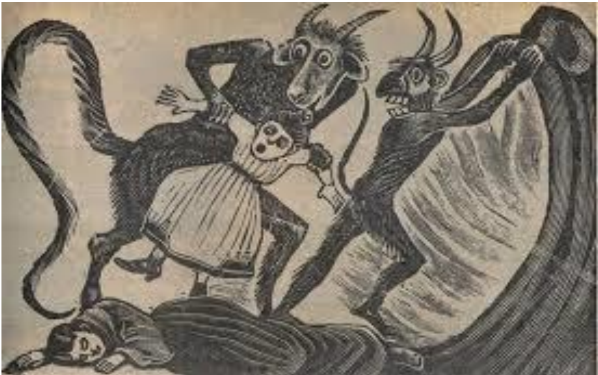
FIGURA 15. Pesiller, Carlos, (1992), José Guadalupe Posada: Ilustrador de la vida Mexicana, México: Fondo Editorial de la Plástica Mexicana, p.176. Grabado de José Guadalupe Posada donde se muestra como una mujer es herida y su hija arrebatada para que los demonios se la lleven al infierno a través de la boca de un ser antropomorfo.

un tamaño mayor, sino que tiene las características comunes que anteriormente he descrito, tiene grandes cuernos en la parte superior de la cabeza, cola larga y además el cuerpo cubierto de vello, hay algo muy interesante en la manera en que Posada grabo al demonio, puesto que mezcla partes de cuerpos de animal y de seres humanos, como las manos para representar al demonio, al ponerle también patas de macho cabrío, orejas y ojos grandes, con un hocico parecido de igual manera a la de una cabra. Esta representación del demonio muestra firmeza, miedo, al mismo tiempo caos, por la situación en la que se encuentra y aunque no se vea proporcionado este demonio, por la falta de cuello y la simetría en su cuerpo, sí refleja la indiferencia ante la situación por la falta de expresión en su rostro.