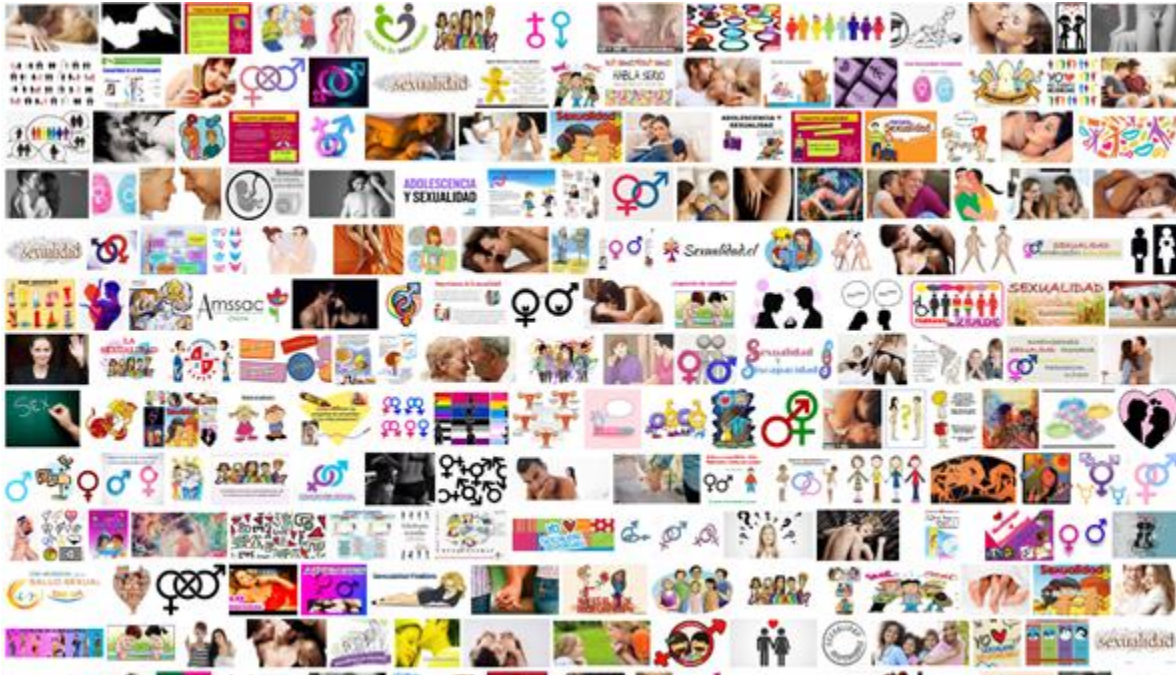
Figura 1. Captura de pantalla de google sobre sexualidad.