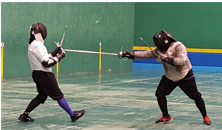
Fig. 7. Asalto o duelo de espada ropera y daga, Esgrima Histórica de Madrid . En este encuentro se muestra el desarrollo de una técnica con dos arneses, espada y daga. 57

no como el fin mismo de la práctica, pudiendo asemejar este punto al sentido de arqueología experimental , es decir, como herramienta interpretativa. 56