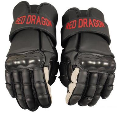
Fig. 16. Guantes de protección. The Time Seller S.L.U. Copyright © 2015. 155