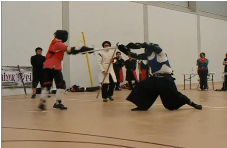
Fig.3. 3º Torneo Nacional de Esgrima Antigua. 27