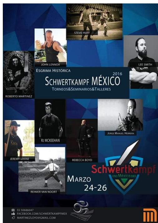
Fig.10. Imagen publicitaria del Schwertkampf 2016. 75

salón en su escuela [ubicada en] una zona de bajos recursos en Jalisco [a través de las captaciones monetarias derivadas de las inscripciones de los participantes] (...) [y] después de mucho negociar, pudimos conseguir una sede donde estuvieron dispuestos a prestarnos sus instalaciones para llevar a cabo el evento, además de que los instructores estuvieron dispuestos también a pagar la mayoría de sus gastos con tal de ayudar. 74