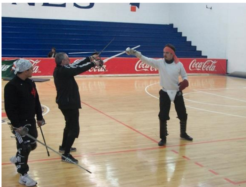
Fig.5. Técnica con espada ropera, 2º Encuentro de la Unión de Artes Marciales; Toluca, México, 09 de febrero de 2013.