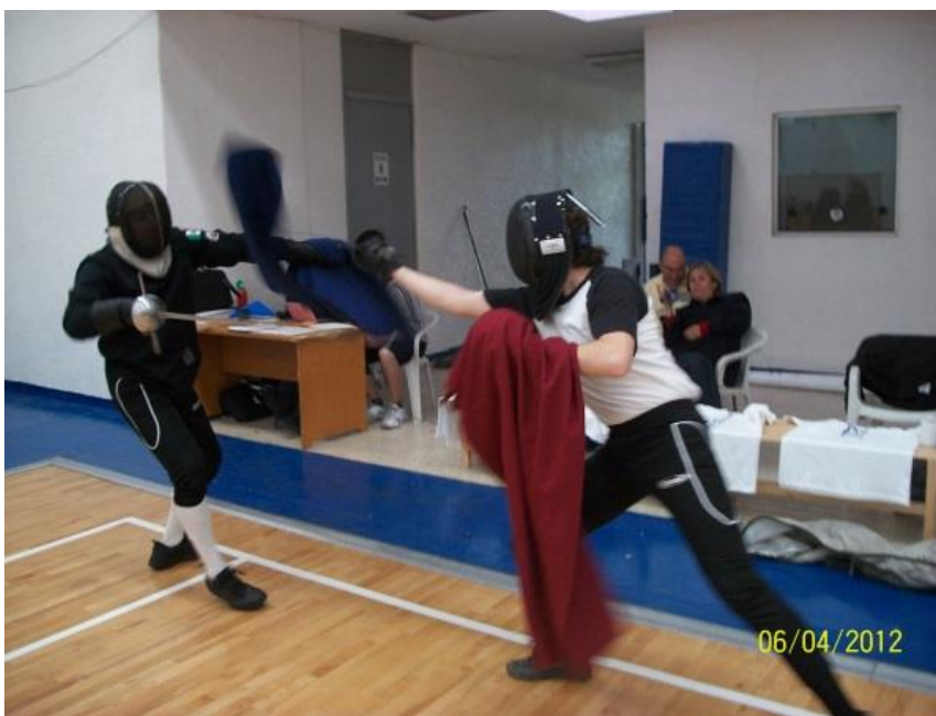
Fig. 8. Taller de espada ropera y capa, 1er Encuentro de la Unión de Artes Marciales Europeas; Toluca, México, 06 de abril de 2012.