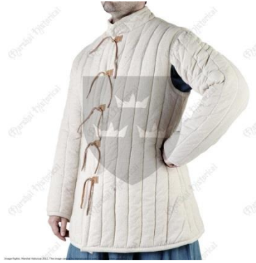
Fig. 15. Gambesón grueso. The Time Seller S.L.U. Copyright © 2015. 154