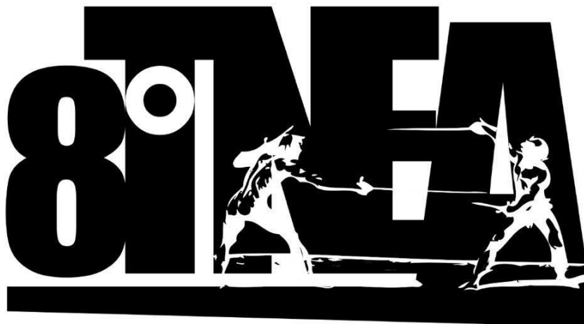
Fig. 11. Imagen publicitaria del 8º Torneo Nacional de Esgrima Antigua, organizado por la agrupación Maza de Plata, México. 78

Asimismo, el Torneo Nacional de Esgrima Antigua no sólo representa un espacio donde anualmente se reúnen, sino todos, la gran mayoría de los tiradores de todo el país para medir, a través de la realización de competencias, el avance que han tenido a lo largo de ese periodo en la interpretación y desarrollo de sus técnicas, sino que también resulta un espacio de convivencia, donde gente con el mismo interés por estudiar y practicar esgrima antigua se encuentra, dialoga, debate las perspectivas de sus diferentes interpretaciones, las pone en práctica no sólo durante las competencias, sino también en sparrings (duelos) libres, es decir, sin algún mediador (juez) de por medio, dentro de los cuales se detienen entre acciones (cada vez que se concluye un punto) a charlar sobre lo que ha sido favorable y desfavorable en la ejecución de su técnica. De igual manera, al ser un evento con una duración de dos o tres días, se lleva a cabo una cena grupal, en la cual cada individuo cubre