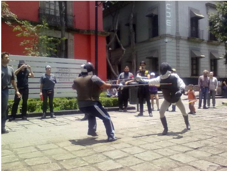
Fig.2. 4º Torneo del Hábito de Santiago, Plaza de la Santa Veracruz, Ciudad de México, 25 de julio de 2016.

Debido a que la rama de influencia estadounidense y la rama de influencia española crecieron prácticamente a la par, tan sólo un año después del 1er Torneo Anual del Hábito de Santiago (de la AEHCM), en el año 2008, se realizó el 1er Torneo Nacional de Esgrima Antigua (TNEA) , el cual fue organizado por personas más cercanas a la tradición norteamericana; sin embargo, ésta idea no se gestaría sólo con practicantes de la Ciudad de México, sino a partir de la unión de diversos tiradores de varios estados de la República.