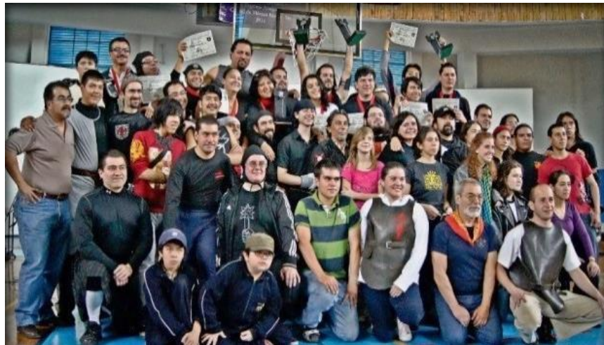
Fig.4. 4º Torneo Nacional de Esgrima Antigua. 28