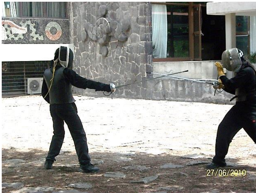
Fig. 1. Práctica de la AEHCM, Ciudad Universitaria, Ciudad de México, 27 de junio de 2010.