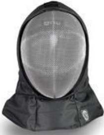
Fig. 14. Fundas para careta con protección occipital. The Time Seller S.L.U. Copyright © 2015. 153