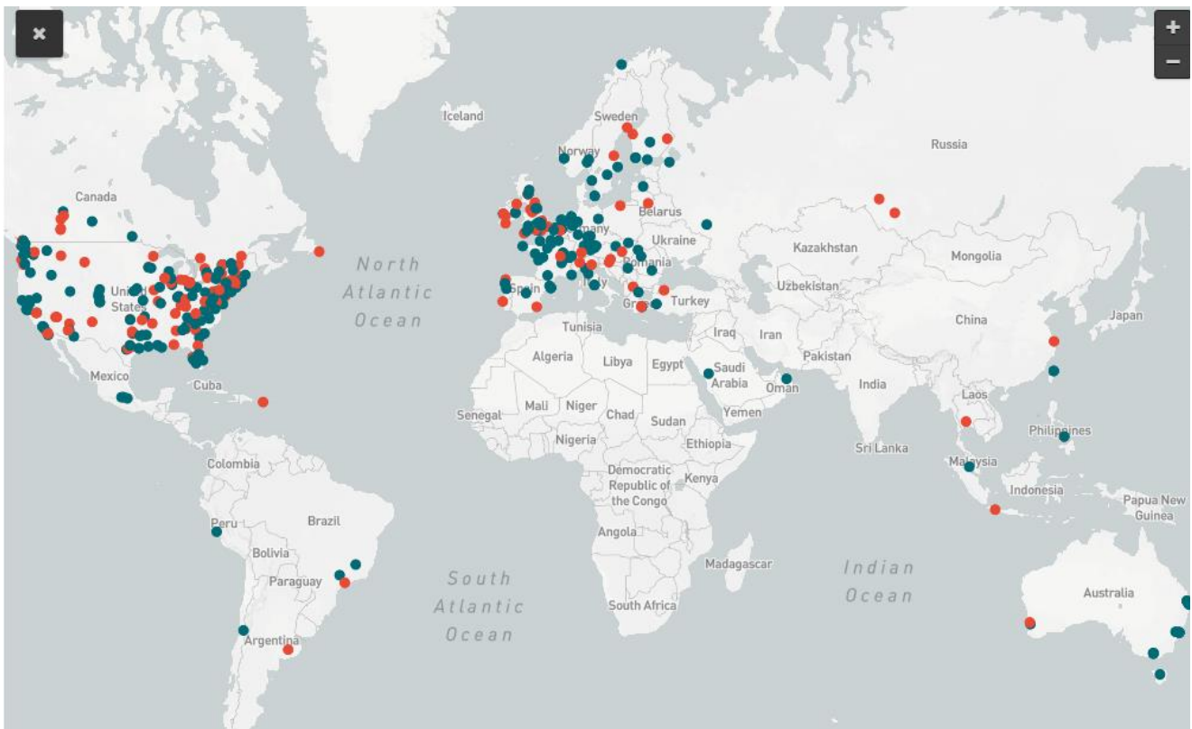
Fig. 17. Mapa de agrupaciones registradas en la página oficial del HEMA Alliance 2017. 156

específicamente para dicha práctica. Para obtener una mejor visualización de dicho mercado, a continuación se muestra un mapa diseñado por HEMA Alliance , que en principio tiene como propósito identificar las agrupaciones practicantes afiliadas a la misma para que los interesados en esta práctica puedan identificar las salas ya establecidas, pero que en esta ocasión utilizaremos el mismo con el propósito de observar el campo de mercado tan amplio que existe en el extranjero, especialmente, como mencionamos, en Europa y en Norte América.