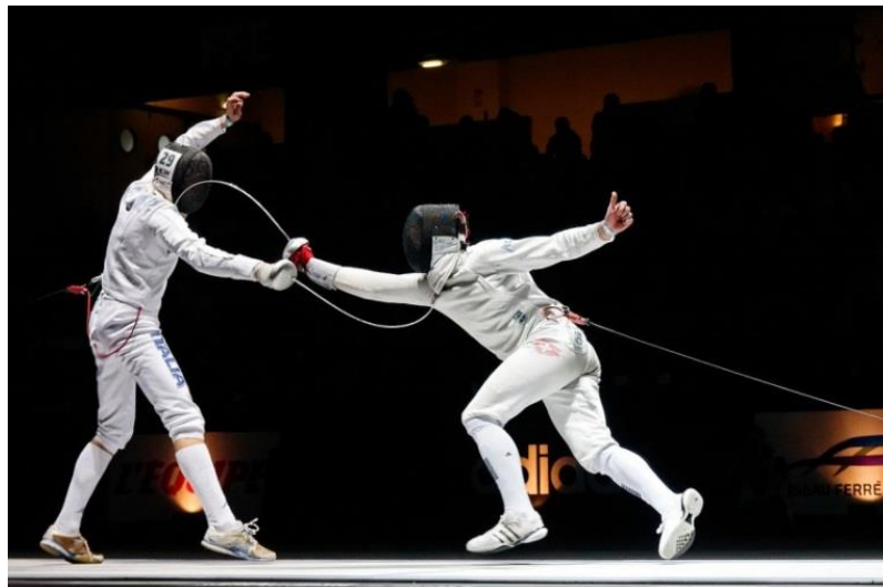
Fig.6. Esgrima deportiva. Se aprecian dos competidores siendo tocados; sin embargo, el primero que hubiese tocado, aún con la diferencia de décimas de segundo, es el que se considera ganador. 55

La práctica de la esgrima deportiva requiere desarrollar aptitudes físicas como la coordinación, velocidad, precisión, entre otras, y la "idea principal de este deporte es tocar y no ser tocado, lo cual puede hacerse con tres (...) [simuladores de] arma (...), sable, espada o florete" 54 , esto durante un entrenamiento previo a una competencia o durante la misma. Durante el uso de todas ellas, se privilegia el primer toque, por lo que, aunque ambos sean tocados por el simulador del otro, el primer toque es el que se toma en cuenta, mismo que se considera por el sonido que éste produce a través de un circuito eléctrico que se activa cuando el botón, ubicado en la punta del simulador, toca al contrario. Por ende, la trascendencia de la esgrima deportiva recae en ser el más rápido durante las competencias.