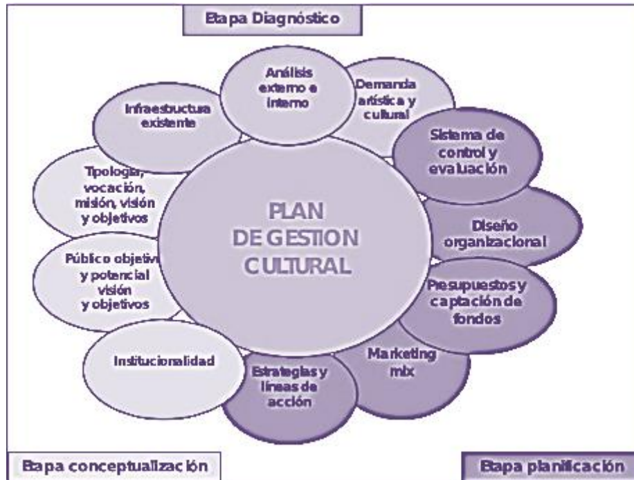
Fig.12. Mapa conceptual que permite ver los distintos componentes del Modelo de Gestión en sintonía, Consejo Nacional de la Cultura y las Artes de Chile 80

un cuadro en donde se observan las acciones que conlleva cada etapa, las cuales ofrecen mejores resultados de impacto si se implementan.