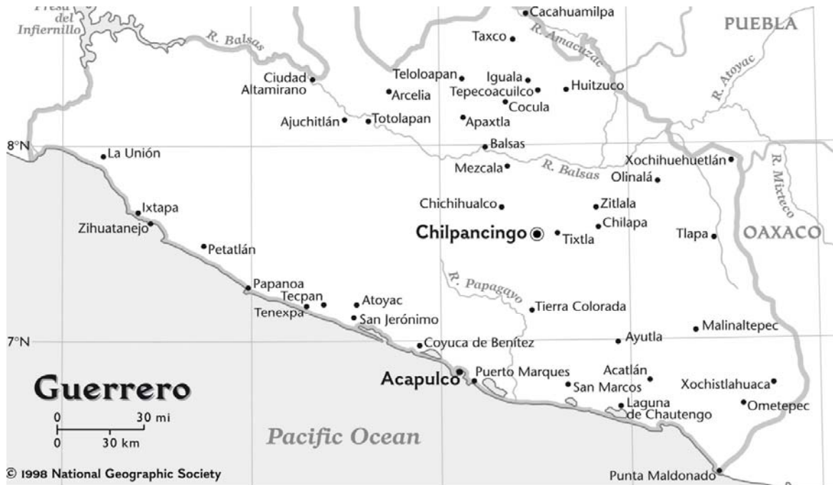
Mapa del estado de Guerrero

Xochistlahuaca o Suljaa es un territorio accidentado que tiene una altura de 600m sobre el nivel del mar, aproximadamente, en donde predomina un clima sub-húmedo-cálido que varía de los 25°C a 32°C y cuenta con una precipitación pluvial que varía de 1100mm a 2000mm dependiendo de las estaciones, las temporadas de lluvia que abarcan principalmente los meses junio, julio agosto y septiembre (Guzmán 1997:47-52.).