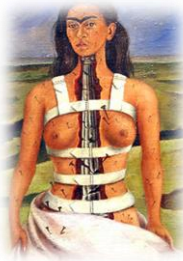
7. La comuna rota (1944)