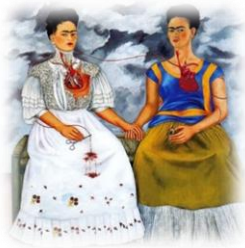
6. Las Dos Fridas (1939)