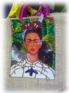
1 Bolsas con lentejuelas