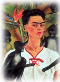
8. Autorretrato con monos (1943)