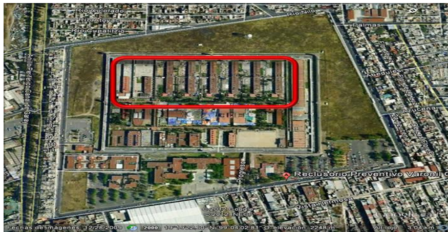
Foto de la ubicación del reclusorio Oriente.