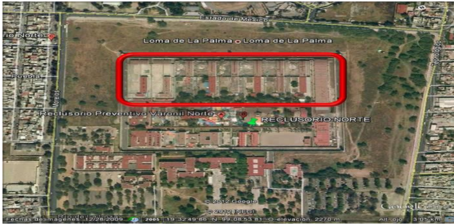
Foto de la ubicación del Reclusorio Norte.