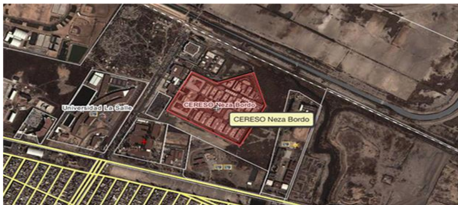
Fotos de la ubicación del CERESO de Neza Bordo.