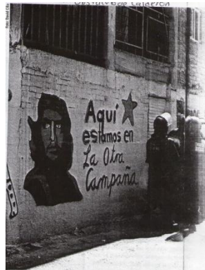
La otra campaña En Contralínea

El 20 de abril de 1999 se inicia la huelga, nuevamente los convocantes son los estudiantes universitarios inmersos en un descontento por la privatización de la Casa de Estudios más grande de México. Una vez más se retomó la imagen de El Che como un símbolo de revolución y de cambio. 69 El Guerrillero Heroico representa la inconformidad y la rebeldía de los estudiantes universitarios, acompañado del Sub Comandante Marcos del EZLN que también es un personaje relacionado con la izquierda mexicana.