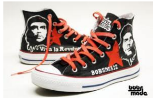
Tenis “Viva la revolución”

Son impresionantes los lugares o productos donde se dejan ver estos personajes, pero así como Frida y el Che también podemos encontrar a Mao o La Gioconda de Da Vinci. La masificación de los personajes mencionados ha dado beneficios económicos a las industrias encargadas de la reproducción obviamente ven en ellos una “Mina de oro” que perdurara durante toda la vida.