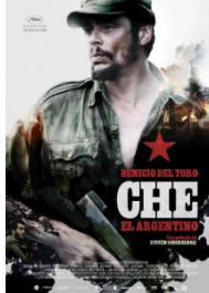
Foto de Che el argentino Primera parte

entrevistas en Egipto, Ramala y Gaza a personas que conocieron a Guevara 77 . El documental fue presentado en el ciclo “Árabes y americanos. El cine como espejo” que organizó la Casa Árabe de Madrid.