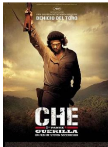
Foto Che Guerrilla Segunda parte

Para ser presentada de forma masiva la vida del Che, se recreó al personajes en cine, en el que se ha plasmado su lucha en Cuba en distintos largometrajes, las dos cintas más conocidas son: Che, El Argentino , del director Steven Soderbergh, del año 2008 que es la primera parte basado en los Pasajes de la Guerra Revolucionaria y Diario del Che en Bolivia y la segunda parte se llama Che, Guerrilla que es acerca de su intento por la revolución en Bolivia.