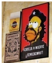
Cartel en Mister Ekis 2009

En Londres se vende la cerveza El Che, que a pesar de no ser un producto de primera necesidad tiene como objetivo satisfacer una necesidad del organismo, detrás hay toda una infraestructura comercial y económica que finalmente integra al consumidor al proceso de apropiación, ya que desde que se pide la bebida se está iniciando el reconocimiento con el Héroe Guerrillero, más no la identificación con el hombre real y su ideología.