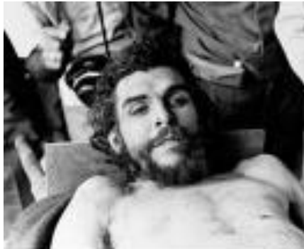
El cuerpo de Ernesto Guevara de la Serna en 1967

Bolivia y después sus restos fueron trasladados a Valle Grande en donde los militares presentaron su cuerpo a la prensa.