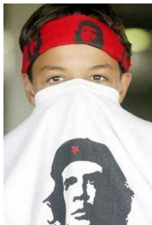
Del artículo El Che Guevara Revolucionario en la moda de EU.

En México también tienen gran aceptación las playeras con el rostro del Che, ya que por lo que pude observar en la Facultad de Filosofía y Letras de la UNAM, lugar que elegí para realizar las entrevistas para la investigación, los jóvenes usan esas playeras; incluso en algunas tiendas que hay alrededor se venden los productos del Che y al menos saben reconocer al personaje por su historia y trayectoria.