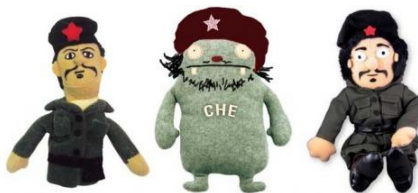
El Che en peluche

En comparación con la sociedad de 1968 a la fecha ha habido muchas transformaciones por los constantes cambios vividos. Unos años después de la muerte del Che aún se generaba una identidad, pero cuando se industrializa la fotografía se pierde ese sentido y da inicio la lógica del consumo.