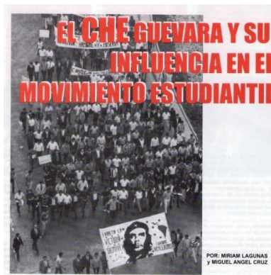
Foto del Movimiento Estudiantil del 68 en México En Temas del Mundo

En 1968 al ser reciente la muerte del revolucionario, aún se le recordaba y se le reconocía por su lucha, por lo que en México fue pertinente que el Guerrillero Heroico encabezara el movimiento debido a que la ideología era compartida por quienes integraban y apoyaban el movimiento estudiantil, ya que creyeron en la lucha que encabezó el Che en vida y por supuesto en su propia lucha.