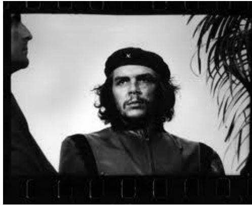
Ernesto Guevara Serna Fotografía tomada el 5 de marzo de 1960 por Alberto Díaz Korda Toma original.

Che Guevara, fue tomada el 5 de marzo de 1960 en los funerales de las víctimas del sabotaje al barco de La Coubre en la Habana. 42