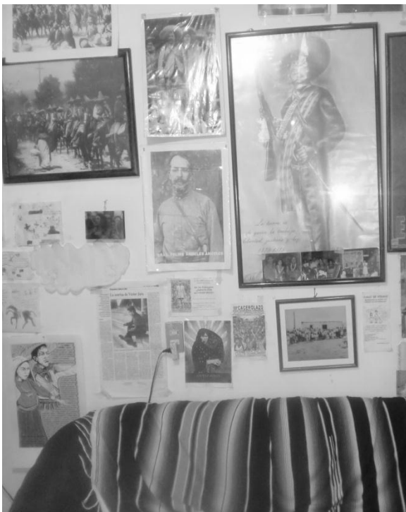
Sala de una de las señoras entrevistadas