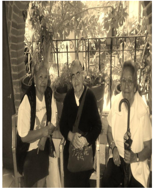
Señoras de la comunidad dentro de la Escuelita Emiliano Zapata.