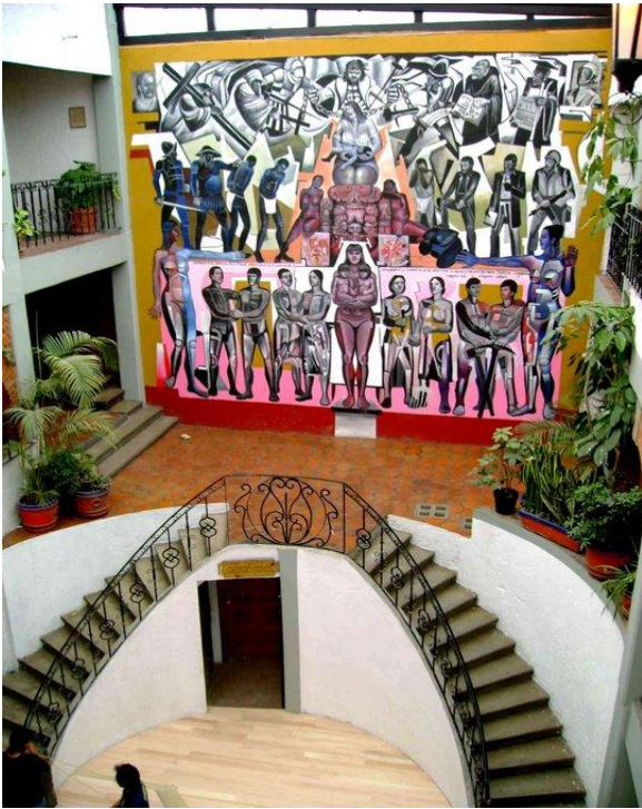
Escuelita Emiliano Zapata: Casa de cultura independiente de gobiernos y partidos políticos, fundada por la unión de colonos de Santo Domingo..