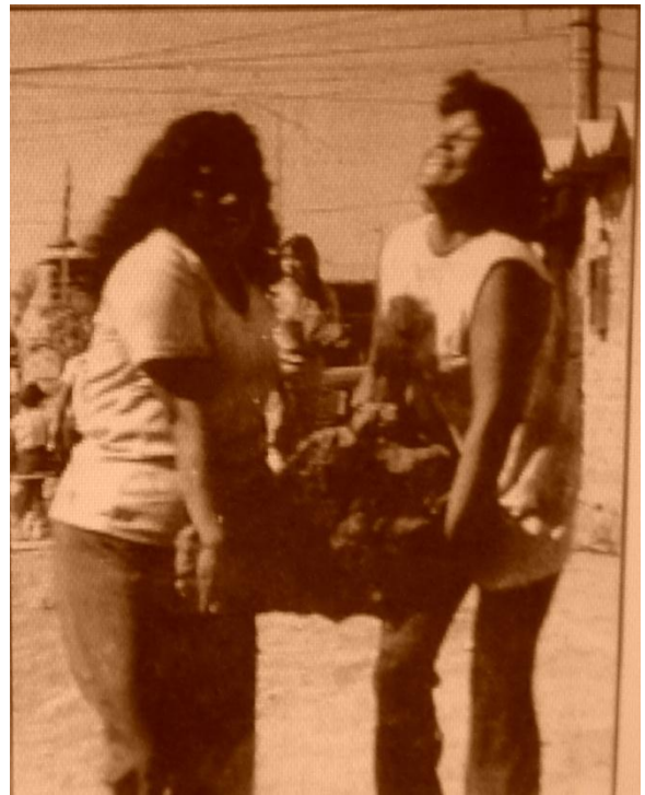
Mujeres acarreado piedras.