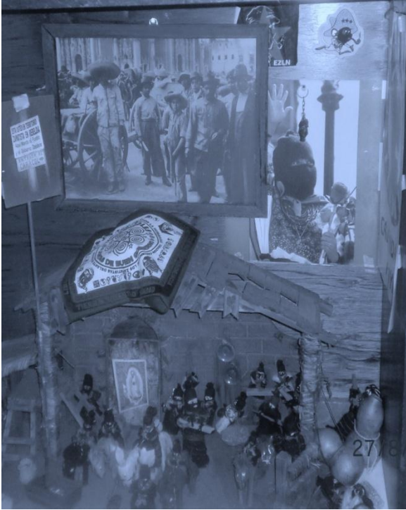
Nacimiento en honor al zapatismo. Creado por una de las señoras entrevistadas.