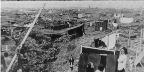
Construyendo sobre las piedras. Santo Domingo 1971.