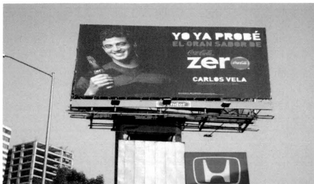
Ficha de datos imagen 2