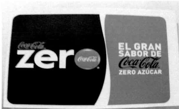
Ficha de datos imagen 7