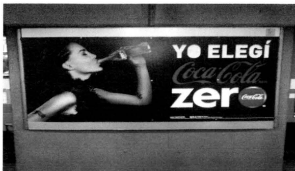
Ficha de datos imagen 1