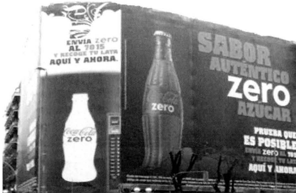
Ficha de datos imagen 4