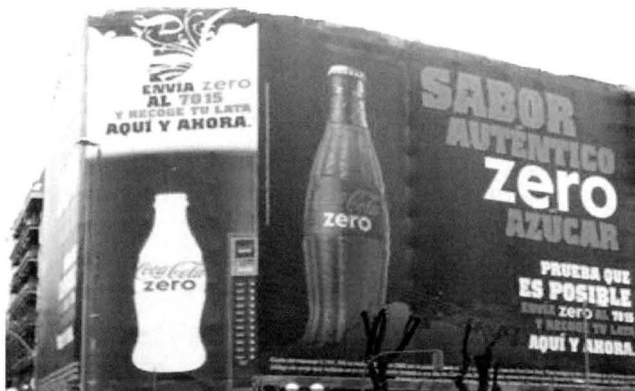
Ficha de datos imagen 4