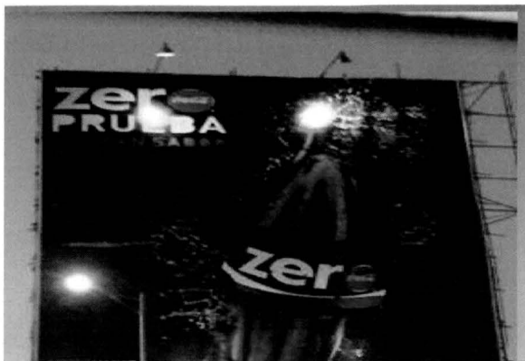
Ficha de datos imagen 8