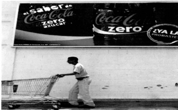
Ficha de datos imagen 5