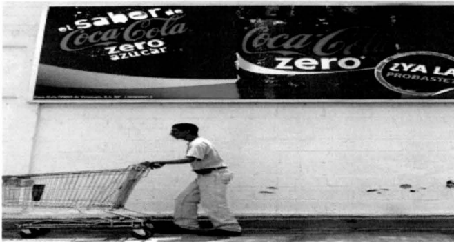
Ficha de datos imagen 5