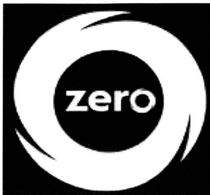
Ficha de datos imagen 3