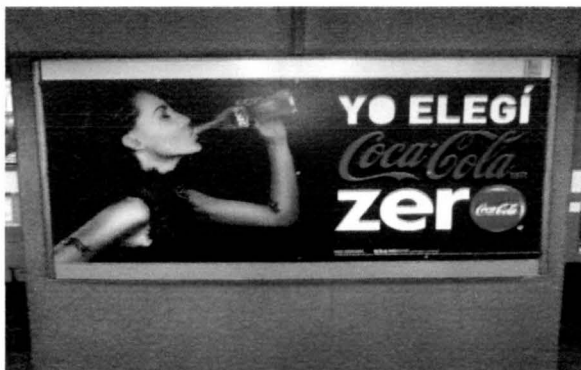
Ficha de datos imagen 1