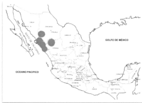
Zonas del país donde fueron localizados plantíos de marihuana en 1949. 30

Durante el mandato del presidente norteamericano Dwight Eisenhower (1953-1961), el gobierno de México firmó varios tratados y acuerdos internacionales sobre la prohibición del cultivo y procesamiento de drogas, sin embargo, según testimonios recabados por la Oficina Federal de Investigación (FBI por sus siglas en Inglés), la mayoría de los pilotos y las aeronaves de la Fuerza Aérea Mexicana en Baja California eran utilizados para el contrabando de droga hacia Estados Unidos. 31 En los últimos años de la década de los cincuenta el gobierno mexicano, comenzaba a tener preocupación por el tráfico de drogas debido al número considerable de detenidos 32 por el ilícito de contrabando, comenzaron a presentarse brotes de enfrentamientos armados entre policías, militares y “gomeros” de la zona de Culiacán, pero el control del territorio siguió siendo controlado por el Estado mexicano. 33