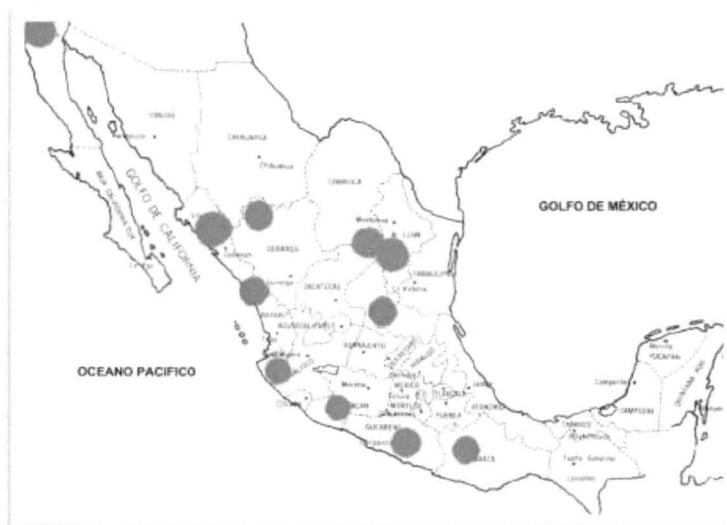
Zonas del país donde fueron localizados plantíos de droga en 1960.

embargo, ya como gobernador, sería uno de los principales personajes protagonistas del inicio de una nueva etapa en el narcotráfico en México.