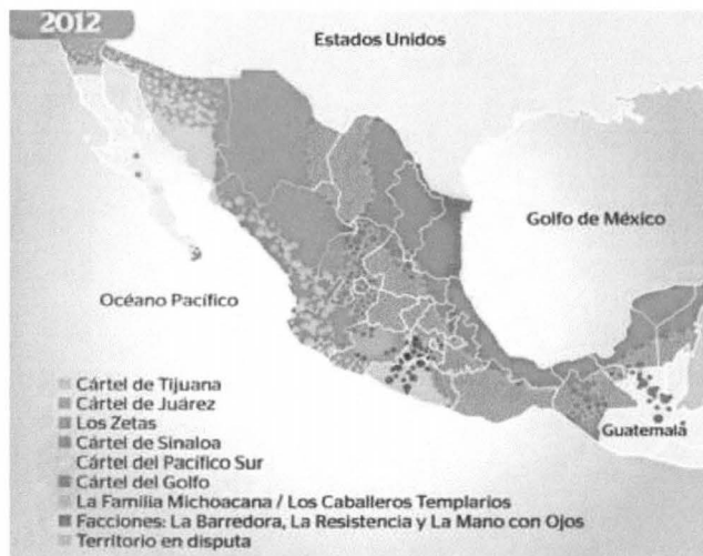
Mapa de las principales organizaciones criminales existentes en México 2012 185

distintas organizaciones y 200 mil son operativos (empacadores, transportistas, distribuidores, vigilantes, informantes). 184 Mientras el número de homicidios al concluir el sexenio según el periódico Reforma, sostiene una cifra de alrededor de 42,253 muertos, sin embargo el semanario Zeta sostiene cerca de 83 mil muertos ligados al narcotráfico.