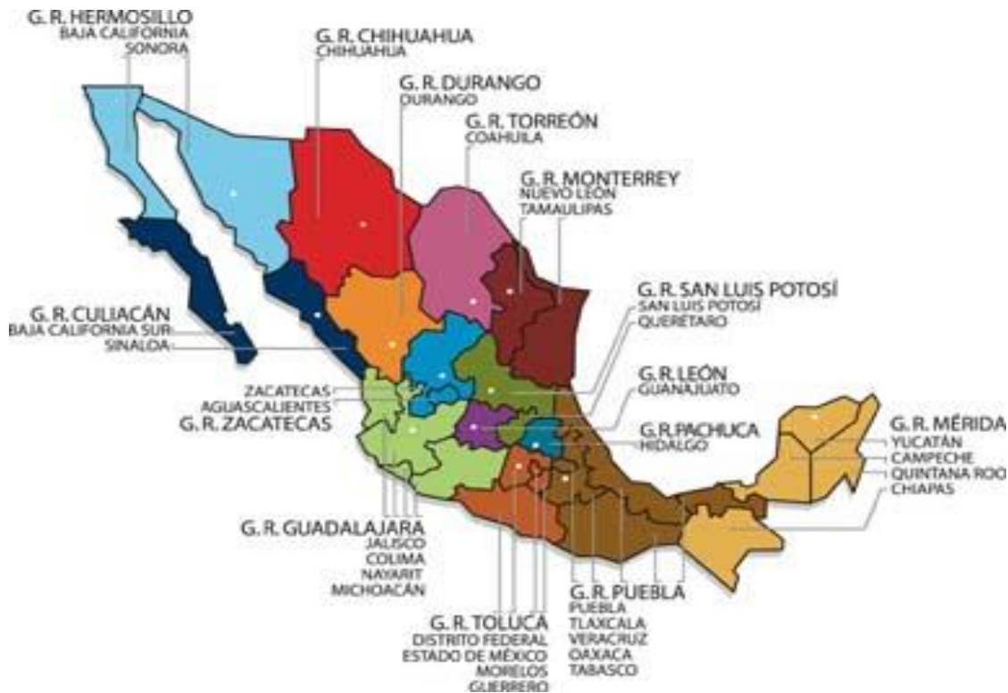
(Mapa de las zonas mineras de México, s/a, consultado el 10 de octubre de 2016).

Con la regulación para la explotación de recursos mineros bajo las doctrinas neoliberales que atraviesan el país, se ha producido una serie de cambios en la regularización para la explotación de recursos en la minería, tenido como consecuencia otorgamiento de permisos y entrada a compañías extranjeras. En Real de Catorce existe un área “protegida” llamada Wirikuta en donde el capital canadiense de la minera First Majestic Silver Corp. desarrolla un proyecto minero que ha tenido como consecuencia manifestaciones y un gran descontento por medio del pueblo indígena wixarika así como de activistas y grupos en su defensa ya que se otorgaron concesiones por medio del Estado (Ovalle, 2011).