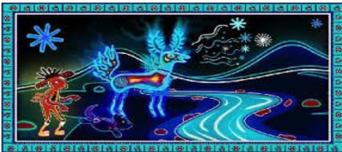
Imagen representativa de la peregrinación a Wirikuta por los ancestros. Referencia de exposición temporal en el Museo Nacional de Culturas Populares, Coyoacán, marzo 2015.

Se trata de recrear el camino de los dioses para darle cuerda al mundo y arreglar el tiempo, las lluvias, la enfermedad. Al tercer día, se prende de nuevo una hoguera para confesar los pecados recordados en el camino. No hay manera de callarlos. Las palabras escapan de las bocas, sin su permiso, como si el fuego les ordenara salir de las entrañas del pasado (Neurath, 2009).